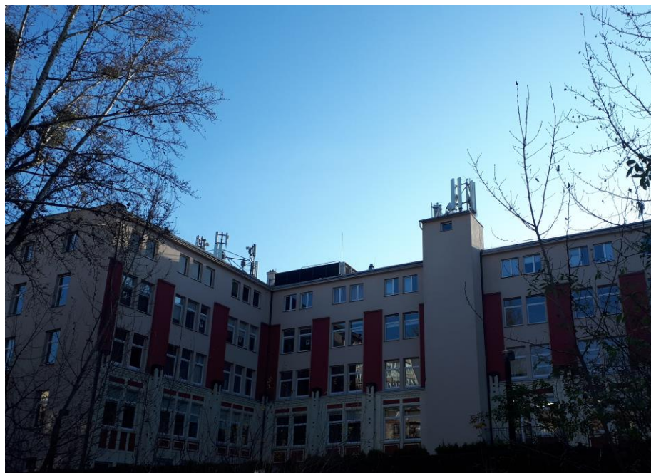
Fot. 1: Widok anten stacji bazowych: ID: WRO1187, ID: BT33394, ID: 2417 (77042N!), zlokalizowanych pod adresem: ul. Prosta 36, 53-508 Wrocław