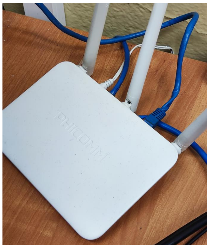
Fot. 3: Widok punktu dostępowego model KE 2M