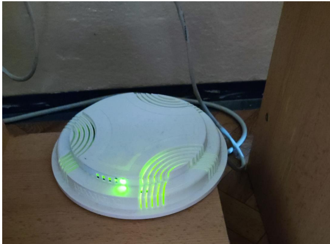
Fot. 4: Widok punktu dostępowego model RBcAP2n