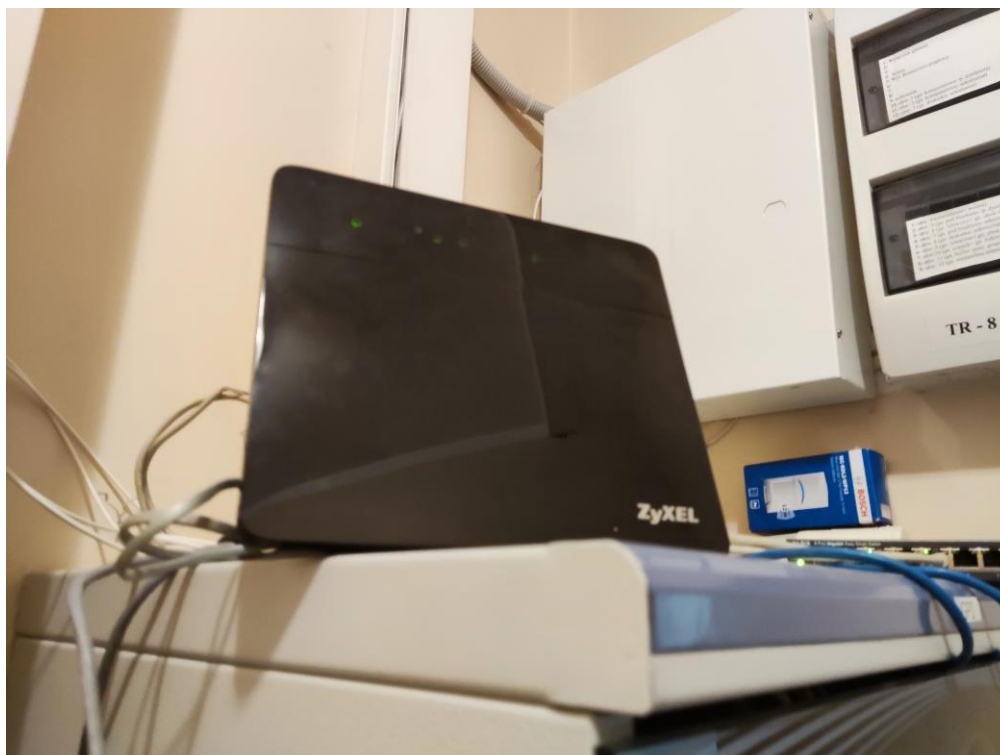
Fot. 2: Widok punktu dostępowego model VMG8924-AC