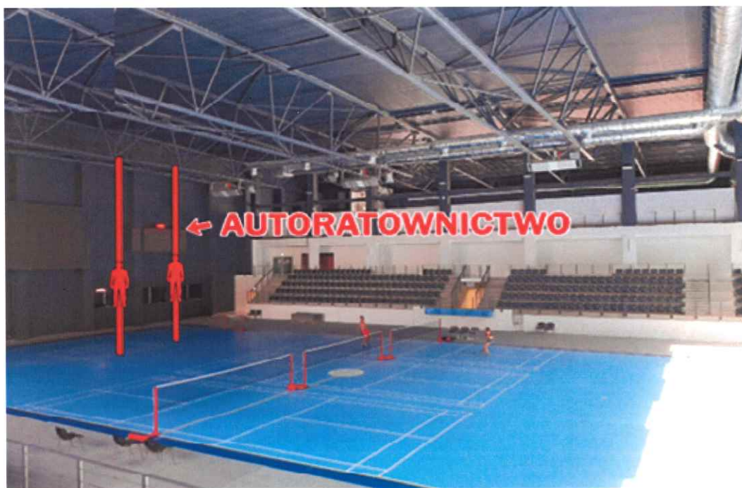
Zdjęcie nr 2: Autoratownictwo – uwalnianie manekina z przyrządów do zjazdu.