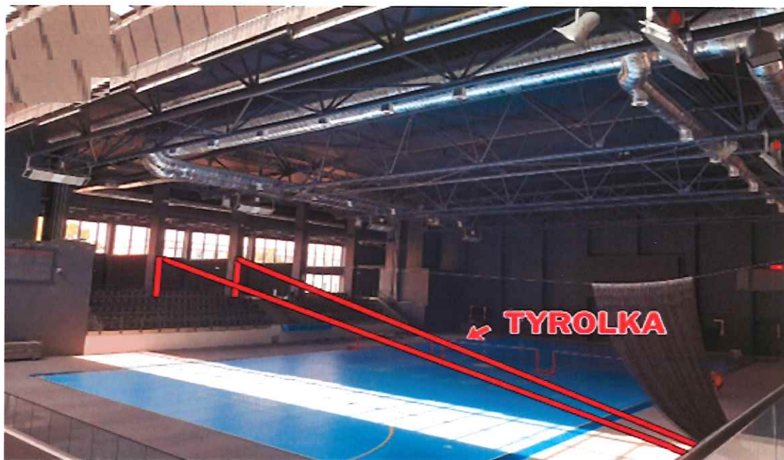
Zdjęcie nr 3: Tyrolka.