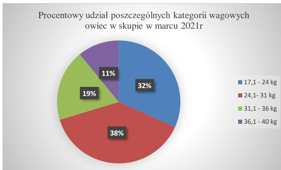
Procentowy udział poszczególnych kategorii wagowych owiec w skupie w marcu 2021r