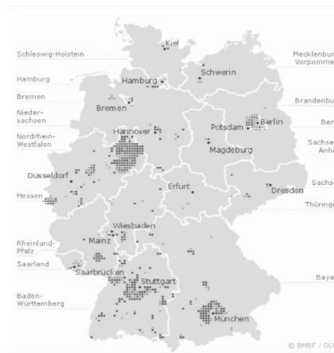
Rys. 2: Mapa na stronie Platformy Przemysłu 4.0 Źródło: http://bit.ly/2lyKN1a (15.03.2017)

się w pięciu grupach roboczych, których zadaniami jest m.in. wypracowywanie standardów dla przemysłu 4.0. Ważnym efektem prac platformy jest stworzenie mapy 12 uwzględniającej instytucje zajmujące się konkretnymi wyzwaniami w ramach przemysłu 4.0. Ponadto ze wsparciem platformy działa Labs Network Industrie 4.0 13 zajmująca się testowaniem rozwiązań dla przemysłu 4.0.