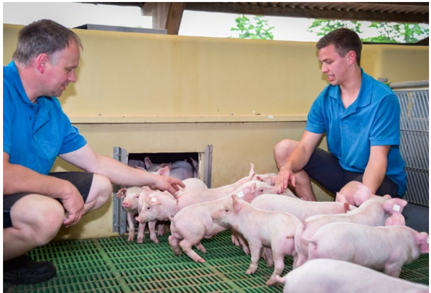
W tegorocznym naborze wniosków o wsparcie finansowe na Modernizację gospodarstw rolnych rolnicy mogli ubiegać się o pomoc na: rozwój produkcji psiań (obszar A)...

Nabór rozpoczął się 21 czerwca 2021 r. i trwał trzy miesiące – do 20 września, po przedłużeniu terminu (o co wnioskowali rolnicy i organizacje branżowe). W tym czasie można było wystąpić o wsparcie w ramach pięciu obszarów pomocy realizowanych w ramach Modernizacji gospodarstw rolnych . A były to: rozwój produkcji psiań (obszar A); rozwój produkcji mleka krowiego (obszar B); rozwój produkcji bydła mięsnego (obszar C); inwestycje związane z racjonalizacją technologii produkcji, wprowadzeniem innowacji, zmianą profilu produkcji, zwiększeniem skali produkcji, poprawą jakości produkcji lub zwiększeniem