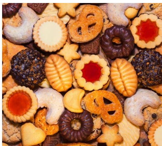
Polskie pieczywo cukiernicze (herbatniki, wafle) znane jest na wszystkich kontynentach