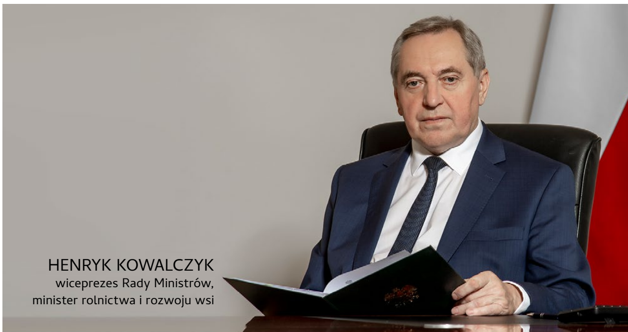
HENRYK KOWALCZYK wiceprezes Rady Ministrów, minister rolnictwa i rozwoju wsi