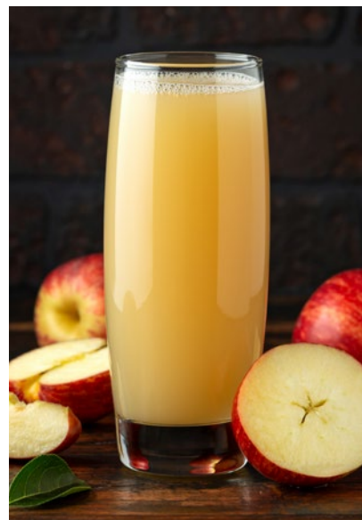
Zagęszczony sok jabłkowy to polski hit eksportowy

i w okresie I–VII 2021 r. osiągnęło poziom 6817 mln euro . Oznaczało to wzrost o około 8,1% w porównaniu z tym samym okresem 2020 r. (+6309 mln euro).