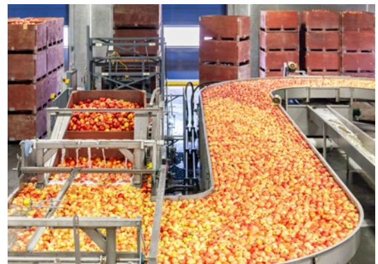
Nowe rozwiązania ułatwią funkcjonowanie grupom producentów rolnych

• Wprowadzono możliwość zmiany planu biznesowego dla organizacji producentów – wniosek o zmianę planu powinien być złożony do właściwego dyrektora