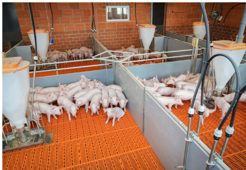
W sierpniu br. uruchomiony został „Program wsparcia gospodarstw utrzymujących świnie”, zapewniający realizację działań prewencyjnych oraz wspierających odbudowę gospodarstw dotkniętych skutkami występowania ASF

Na inwestycje niezwiązane bezpośrednio z budową, modernizacją budynków inwentarskich lub adaptacją innych istniejących w go-