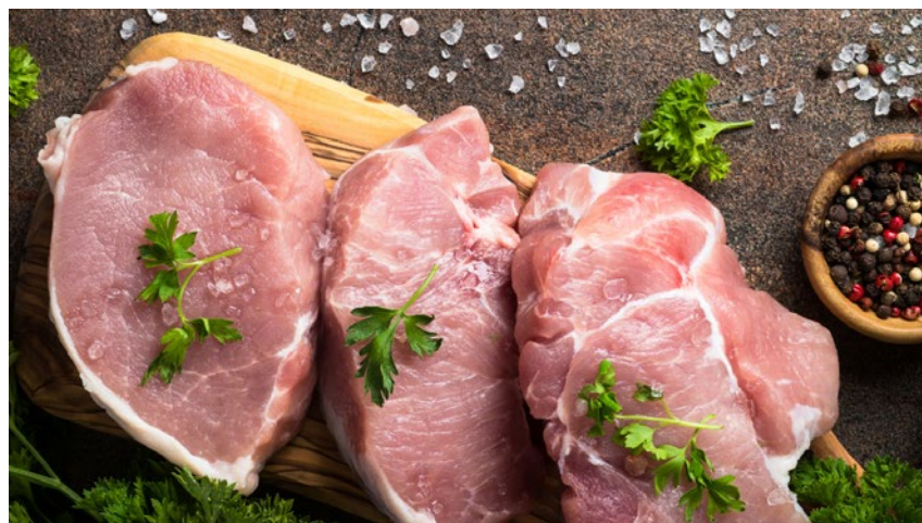
W strukturze asortymentowej eksportu produktów wieprzowych z Polski dominowało mięso świeże i mrożone

W okresie I–VII 2021 r. pod względem wartości eksportowano