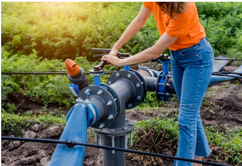
... i nawadnianie w gospodarstwie

rolników, poziom dofinansowania jest wyższy i wynosi 60%.