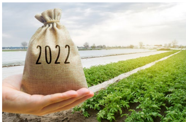
Małe i średnie gospodarstwa otrzymają dopłaty powyżej średniej unijnej

Obiecaliśmy polskim rolnikom, że będą traktowani na równych zasadach i Polski Łąd jest spełnieniem tej obietnicy, bo zdecydowana większość polskich gospodarstw będzie korzystała z dopłat na poziomie powyżej średniej UE.