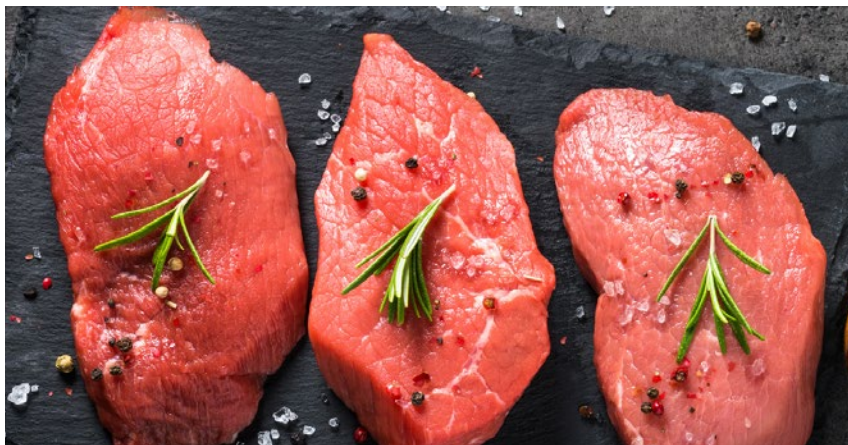
Na eksport przeznaczane jest ok. 85–90% krajowej produkcji wołowiny

UE była również Arabia Saudyjska (353 mln euro) oraz USA , gdzie wartość eksportu wyniosła ponad 334 mln euro. Znaczącymi odbiorcami produktów żywnościowych z Polski była także Algieria (282 mln euro), Izrael (162 mln euro), Norwegia (142 mln euro) oraz Białoruś (141 mln euro).