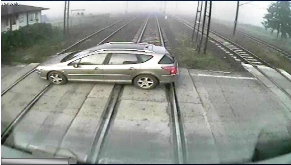
Widok z kamery zamontowanej w kabinie pociągu KM nr 90221 wjeżdżającego naprzeciw.