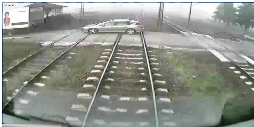
Widok z kamery zamontowanej w kabinie pociągu KM nr 90221 znajdującego się ok. 15 metrów od przejazdu.