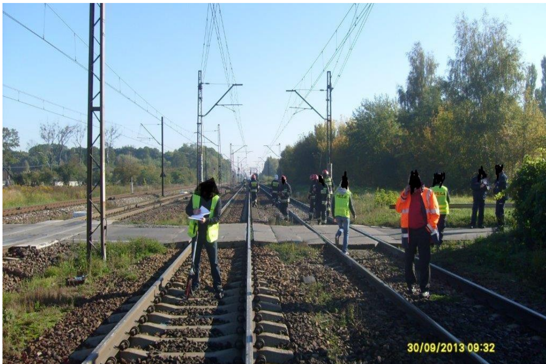
Widok nawierzchni przejazdu – widok z boku.