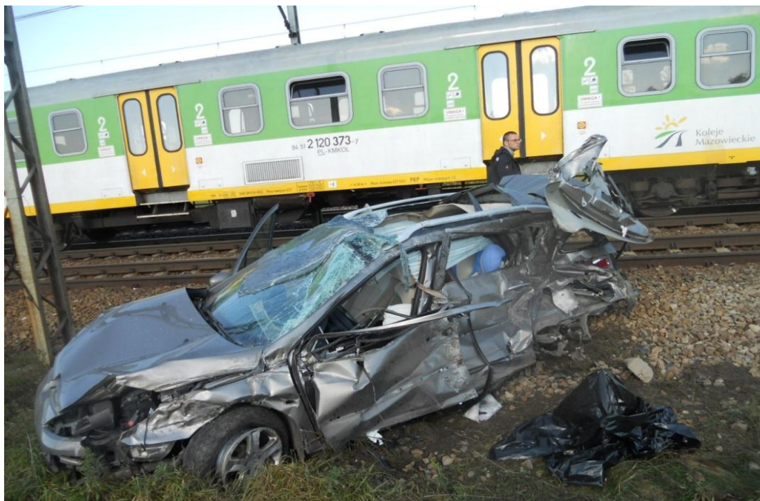
Widok samochodu marki Peugeot 407 po wypadku

Samochód osobowy Peugeot 407 uczestniczący w wypadku – uszkodzenia stwierdzonej obrębie podstawowych układów mających wpływ na bezpieczeństwo jazdy samochodu powstały na skutek działania zewnętrznych sił doraźnych w trakcie wypadku. Nie ma podstaw do przyjęcia, że w/w pojazd mógł być niesprawny przed wypadkiem.