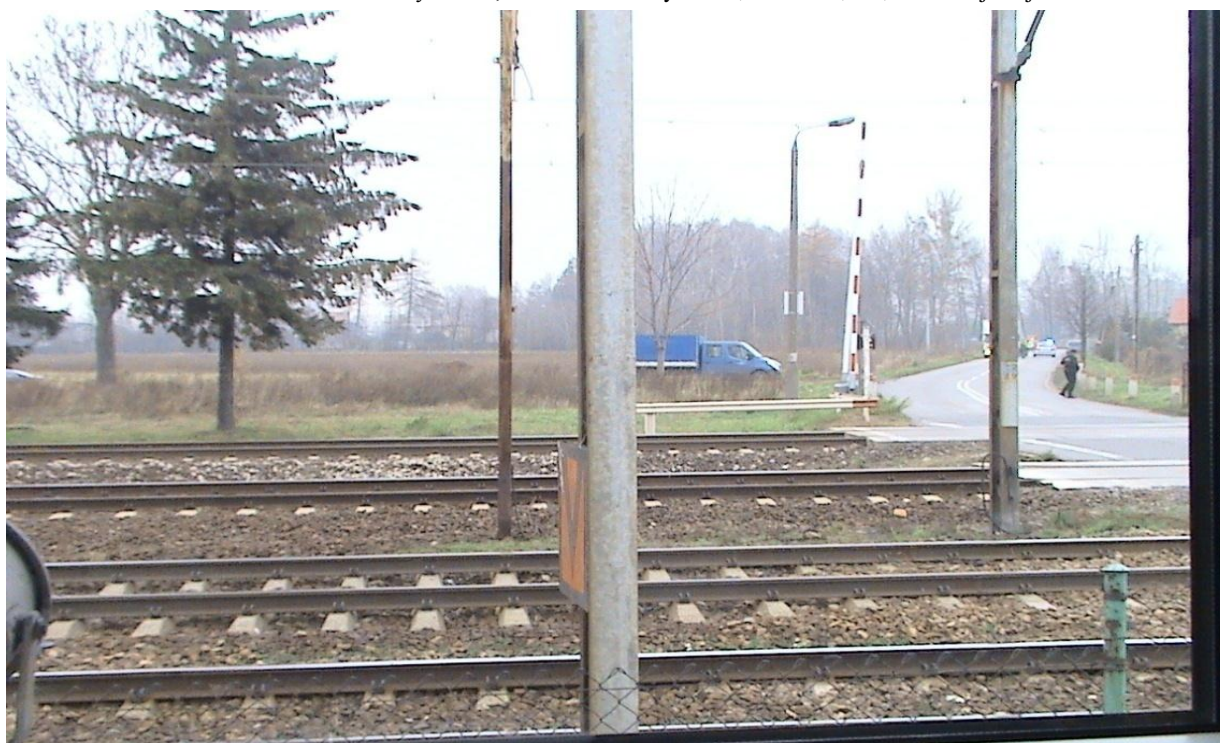
Widok ze stanowiska dróżnika przejazdowego z posterunku nr 1 „POM”

Raport z badania poważnego wypadku kolejowego kat. A18 zaistniałego w dniu 30 września 2013 r. na szlaku: Grodzisk Maz. – Żyrardów, w torze szlakowym nr 1, w km. 32,955, linii kolejowej nr 001