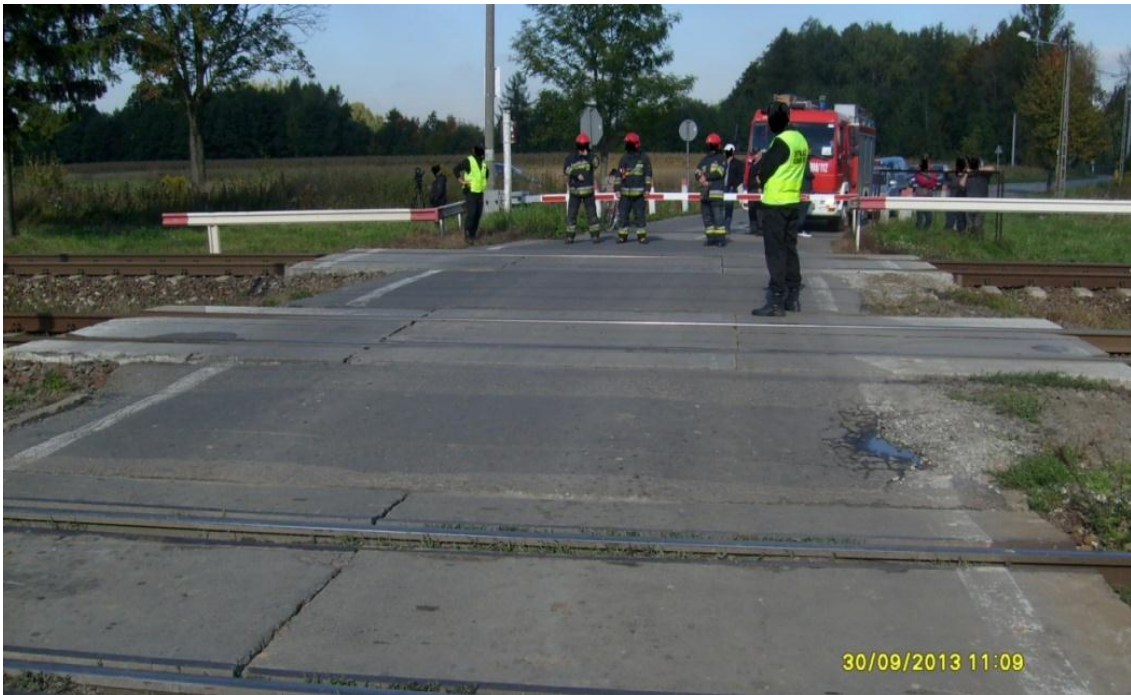
Widok nawierzchni przejazdu .