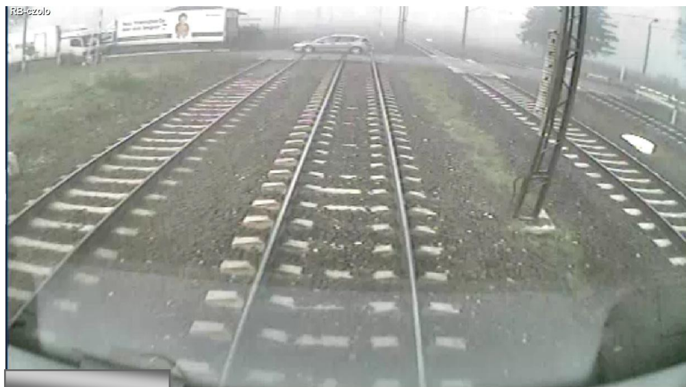
Widok z kamery zamontowanej w kabinie pociągu KM nr 90221 znajdującego się ok. 70 metrów od przejazdu.

S.A. - Zakład Centralny, uderzając w jego tylną część bagażową. Spowodowało to częściowe obrócenie i przemieszczenie samochodu osobowego poza skrajnię toru nr 2. Czoło pociągu nr MPE 91502 zatrzymało się w km 32.435, tj. w odległości 520 m za przejazdem i 566 m od miejsca uderzonego samochodu. Samochodem osobowym marki Peugeot 407 kierowała kobieta lat 36 przewożąca dwoje dzieci w wieku 1,5 i 9 lat.