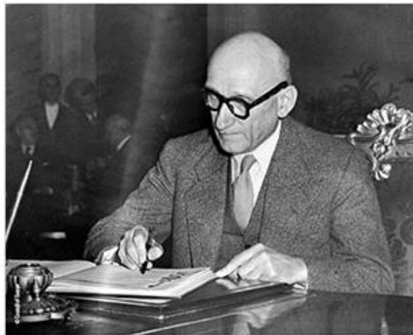
Minister spraw zagranicznych Francji Robert Schuman

„Europa nie powstanie od razu ani w całości: będzie powstawała przez konkretne realizacje, tworząc najpierw rzeczywistą solidarność.”