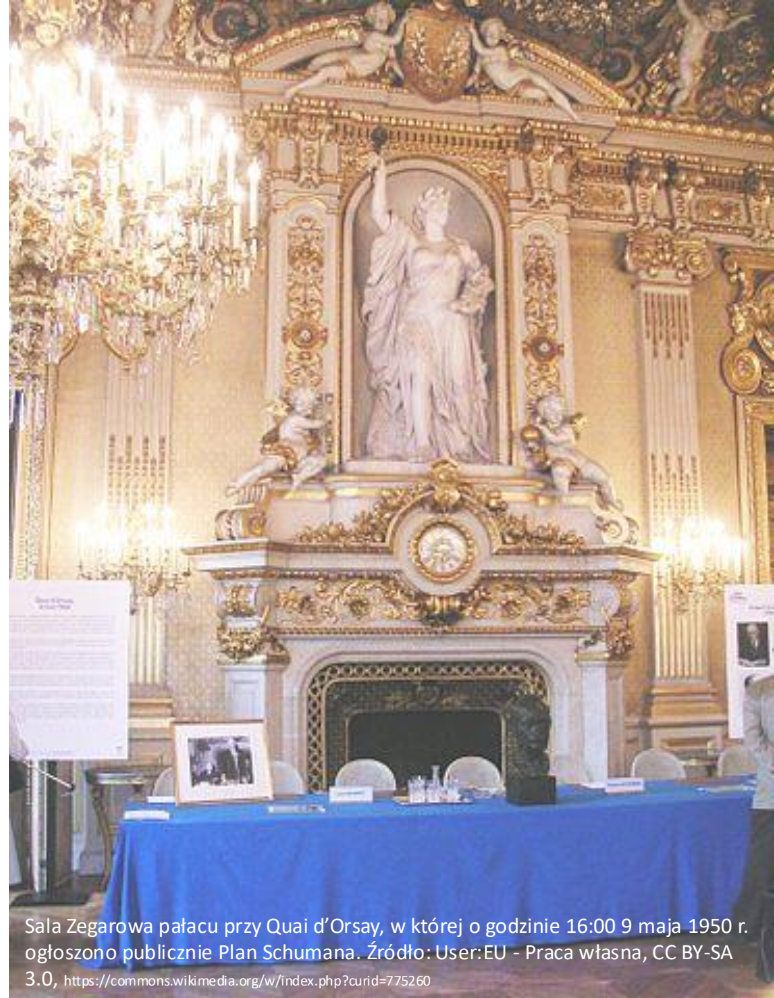
Sala Zegarowa pałacu przy Quai d'Orsay, w której o godzinie 16:00 9 maja 1950 r. ogłoszono publicznie Plan Schumana.

EWWiS (założona przez: Belgię, Francję, Holandię, Luksemburg, Niemcy i Włochy) była pierwszą w historii ponadnarodową instytucją europejską, która ostatecznie przekształciła się w Unię Europejską