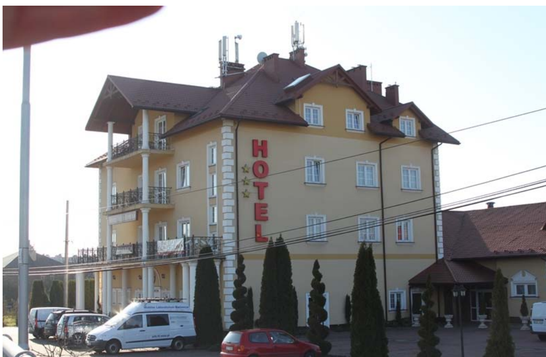
Fot. 2: Widok anten stacji bazowych zlokalizowanych na dachu budynku hotelowego w Rzeszowie przy Al. Gen. Władysława Sikorskiego 118 (widok z punktu pomiarowego nr 22)