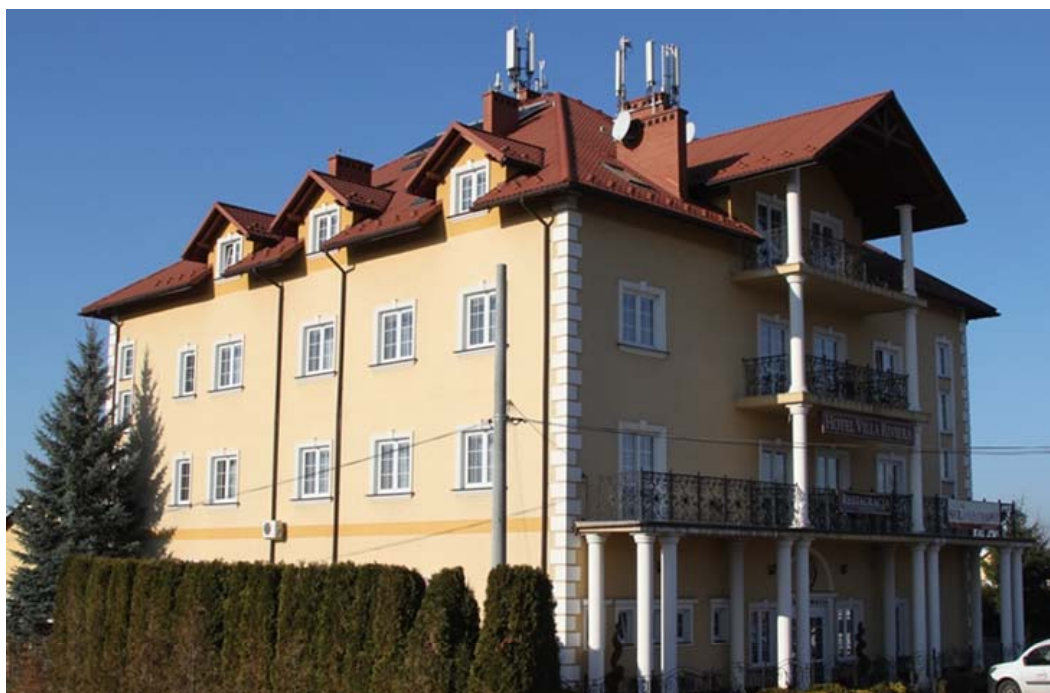
Fot. 1: Widok anten stacji bazowych zlokalizowanych na dachu budynku hotelowego w Rzeszowie przy Al. Gen. Władysława Sikorskiego 118 (widok z punktu pomiarowego nr 37)