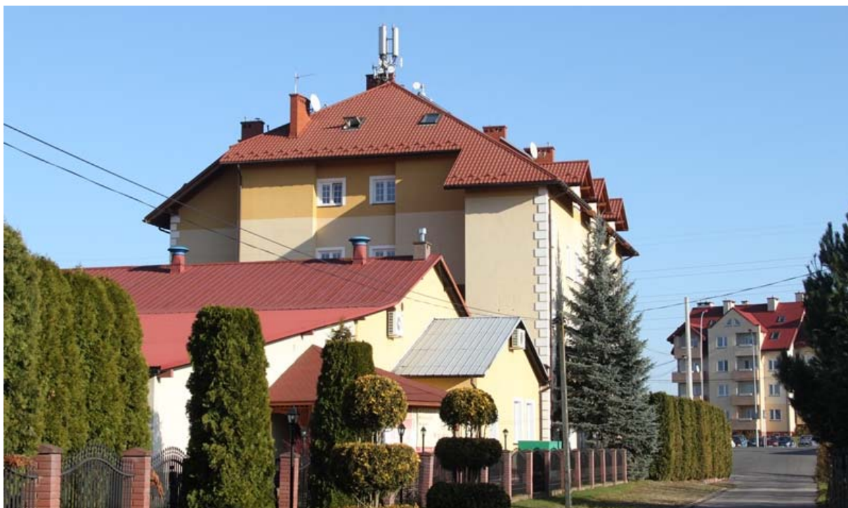
Fot. 3: Widok anten stacji bazowych zlokalizowanych na dachu budynku hotelowego w Rzeszowie przy Al. Gen. Władysława Sikorskiego 118 (widok z punktu pomiarowego nr 40)