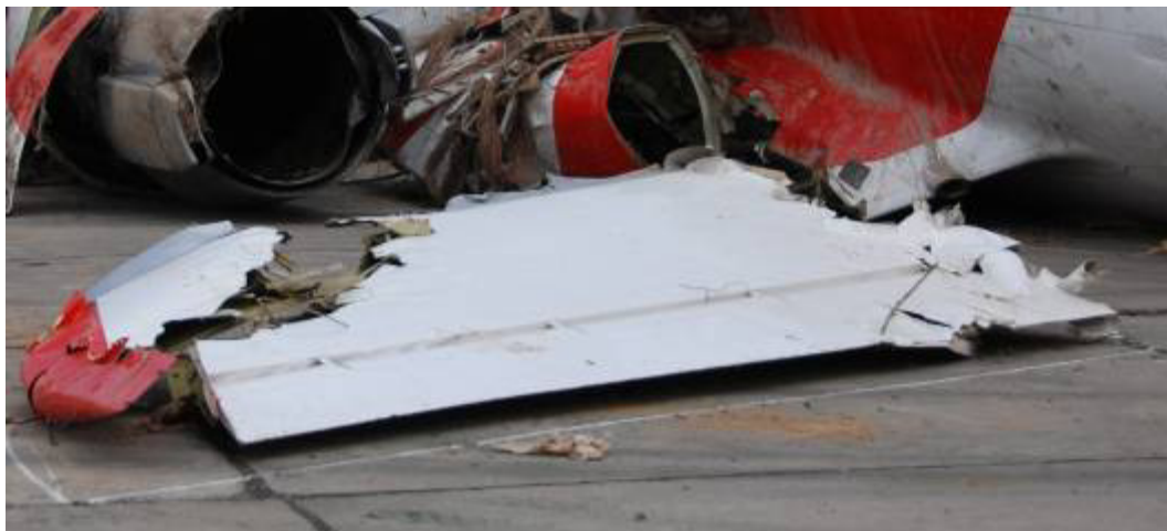
Rys. 21. Lewa część statecznika poziomego ze sterem wysokości

Lewa część statecznika oderwana w odległości 1,5 m od miejsca mocowania w stateczniku pionowym. Oderwany fragment (zewnątrzny narożnik), krawędź oderwania poszarpana. Liczne wgniecenia o owalnym kształcie na krawędzi natarcia (rys. 21). Lewy statecznik oddzielił się od płatowca jeszcze przed zderzeniem samolotu z ziemią.