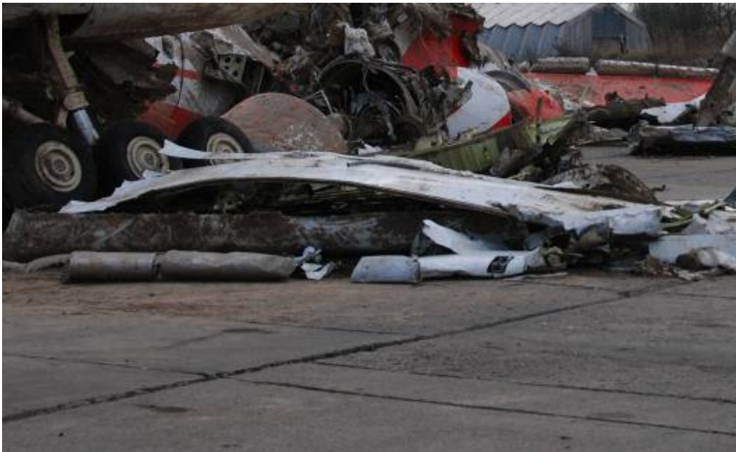
Rys. 18. Środkowa część lewego skrzydła