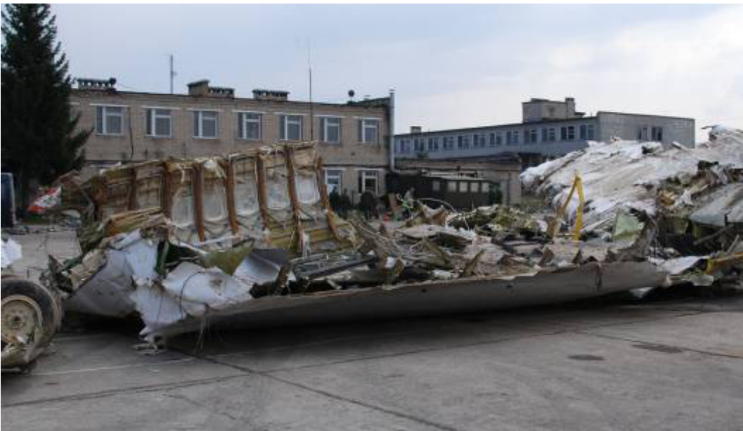
Rys. 9. Przednia część kadłuba – pierwszy salonik