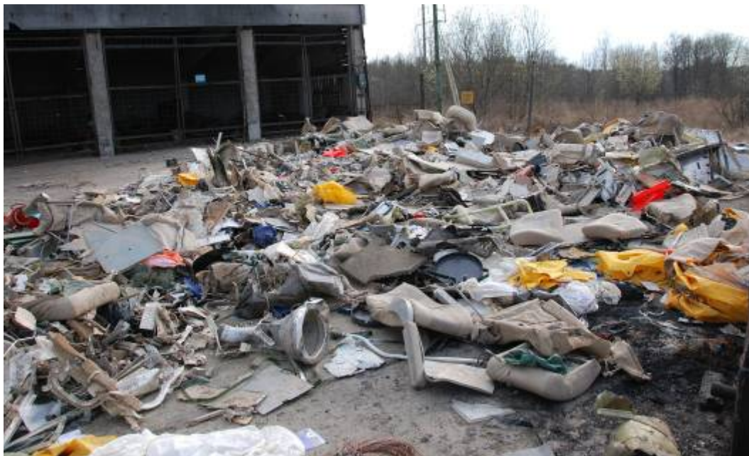
Rys. 31. Pozostałości wyposażenia kabiny pasażerskiej

Fotele pasażerskie wyrwane z mocowań, porozrywane na części. Osłony wewnętrzne ścian kabiny pasażerskiej połamane na drobne fragmenty (rys. 31). Kamizelki ratunkowe porzrzucone w miejscu upadku samolotu.