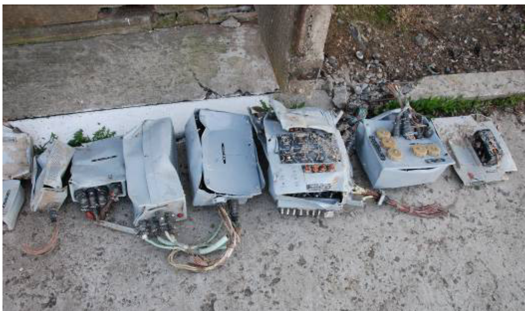
Rys. 30. Skrzynki sterowania instalacji elektrycznej

Wiązki przewodów elektrycznych porozrywane. Skrzynki sterowania zdeformowane. Pogięte i pourywane dźwigienki przełączników (rys. 30). Obudowy akumulatorów pokładowych zdeformowane. Część ogniw rozszczelniona.