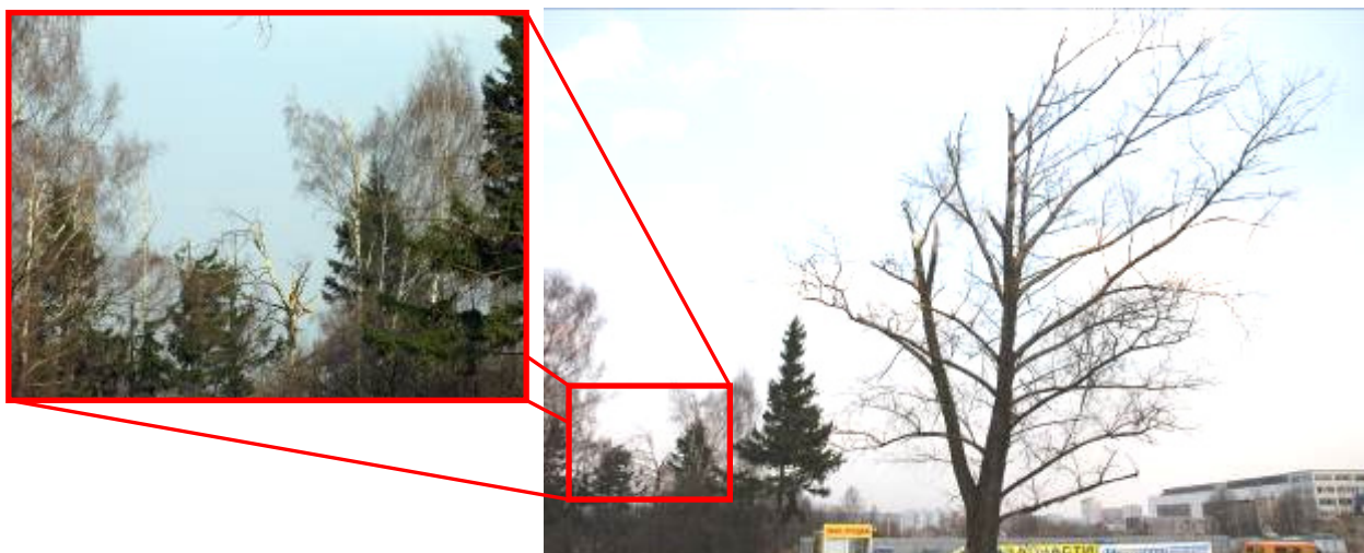
Rys. 5. Drzewa, które spowodowały dalsze uszkodzenia na krawędziach natarcia skrzydeł oraz oderwanie lewego statecznika poziomego

W odległości 525 m od progu pasa startowego, 105 m w lewo od jego osi ( 54^{\circ}49'28,09''N , 32^{\circ}03'7,26''E ) nastąpiło pierwsze zderzenie samolotu z ziemią.