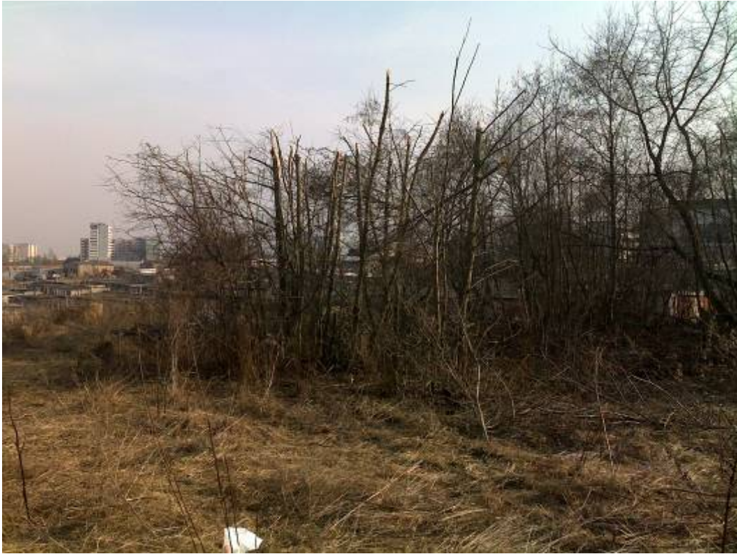
Rys. 2. Grupa młodych drzew ściętych lewym skrzydłem

Zderzenia spowodowały charakterystyczne wgniecenia na krawędzi natarcia skrzydła oraz odkształcenia i liczne rozerwania poszycia na dolnej powierzchni skrzydeł oraz wychylonych kłapach zaskrzydłowych (rys. 3). Niewykluczone, że w tym momencie powstały pierwsze uszkodzenia wiązek przewodów elektrycznych.