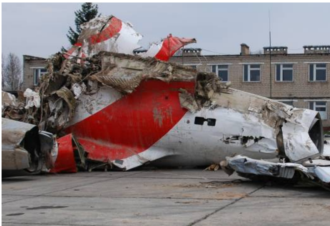
Rys. 12. Końcowa część kadłuba

Z wyjątkiem końcowej sekcji kadłuba pozostałe fragmenty miały całkowicie rozczłonkowane górne części poszycia zewnętrznego. Zachowane elementy to pogniecione fragmenty podłogi oraz dolnego poszycia samolotu. Przy dwóch sekcjach zachowały się pozostałości burt bocznych.