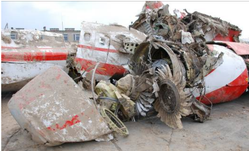
Rys. 23. Silnik lewy

Silnik nr 1 (lewy) oderwany od konstrukcji samolotu. Tarcze sprężarki niskiego ciśnienia oddzielone od silnika. Łopaty wirnika zgięte przeciwnie do kierunku obrotów (rys. 23).