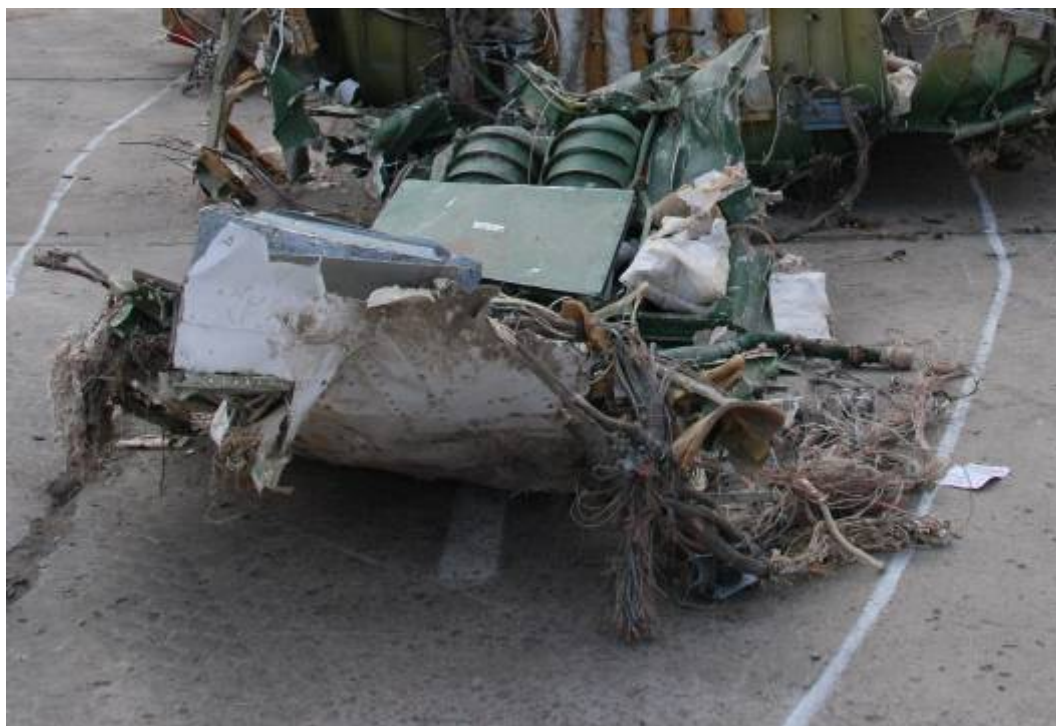
Rys. 7. Pozostałości przedniej części samolotu