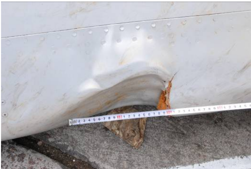
Rys. 3. Charakterystyczne owalne wgniecenia na krawędzi natarcia skrzydeł

Zderzenia spowodowały charakterystyczne wgniecenia na krawędzi natarcia skrzydła oraz odkształcenia i liczne rozerwania poszycia na dolnej powierzchni skrzydeł oraz wychylonych kłapach zaskrzydłowych (rys. 3). Niewykluczone, że w tym momencie powstały pierwsze uszkodzenia wiązek przewodów elektrycznych.