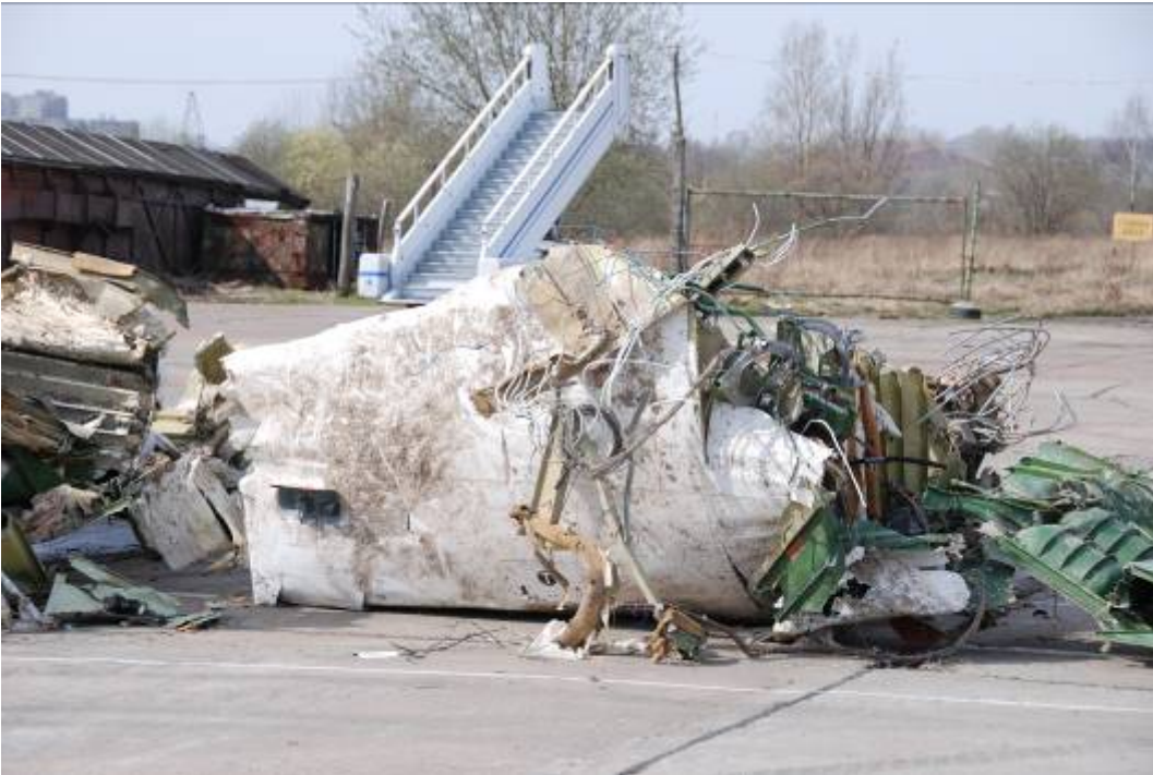
Rys. 8. Fragment kadłuba w miejscu mocowania przedniej nogi podwozia

w rejonie mocowania przedniej nogi podwozia. Cała górna część kadłuba z tego rejonu została porozrywana na drobne elementy;