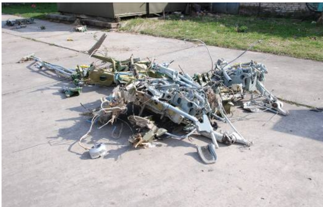
Rys. 26. Pozostałości układu sterowania samolotem – elementy zabudowane w kokpicie i pod podłogą kabiny załogi