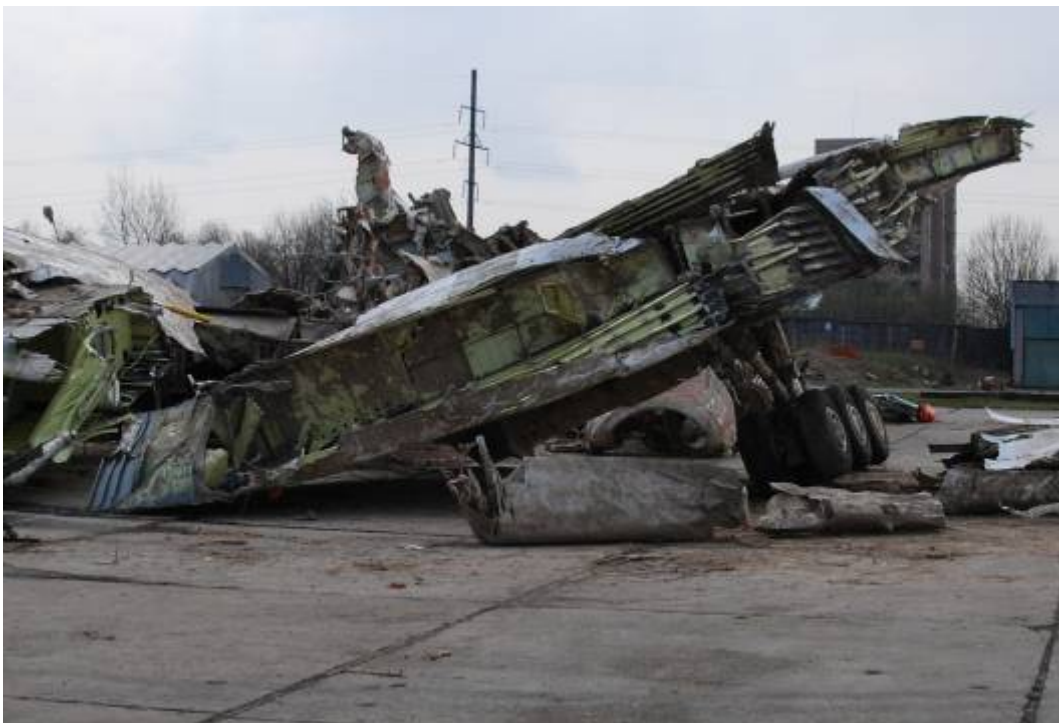
Rys. 16. Rozerwana krawędź natarcia lewego skrzydła