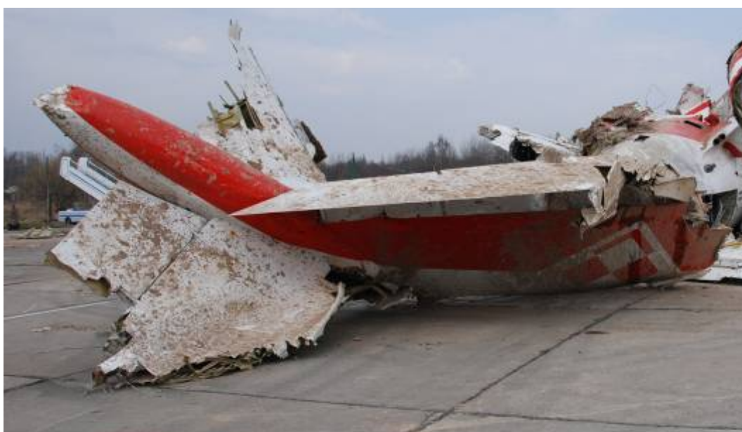
Rys. 22. Statecznik pionowy

Oderwane od końcowej części kadłuba u nasady. Zmiażdżona przednia część osłony aerodynamicznej mechanizmu przestawiania statecznika poziomego. Mechanizm przestawiania statecznika poziomego intensywnie zanieczyszczony błotem. Wychylenie trzonu mechanizmu odpowiada ustawieniu statecznika poziomego na -3^\circ . Zerwane poszycie na krawędzi natarcia statecznika pionowego. Ster kierunku zachował się zamocowany do statecznika pionowego – wychylony w lewo o kąt około 20^\circ (rys. 22).