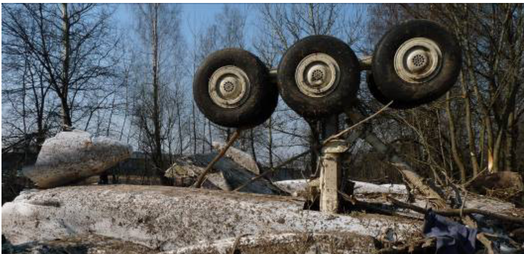
Rys. 28. Lewe podwozie główne