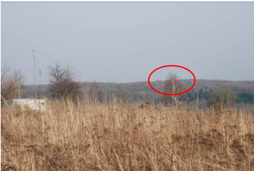
Rys. 1. Brzoza ze ściętymi wierzchołkami

W odległości około 2,7 km przed progiem drogi startowej samolot Tu-154M nr 101 znalazł się poniżej nakazanej ścieżki zniżania i kontynuował zmniejszanie wysokości lotu. Około 30 m przed bliższą radiolatarnią (BRL) samolot znalazł się na tyle nisko, że nastąpił kontakt z pierwszą przeszkodą terenową (1099 m od progu pasa, 39 m w lewo od jego osi). Końcówka prawego skrzydła uderzyła w wierzchołek brzozy na wysokości około 10 m, w wyniku czego przycięte zostały cienkie gałązki o długości około 1 m (rys. 1). Zderzenie to nie spowodowało uszkodzeń mających wpływ na zdolność samolotu do lotu (prawdopodobnie powstały tylko miejscowe uszkodzenia powłoki lakierniczej na krawędzi natarcia skrzydła).