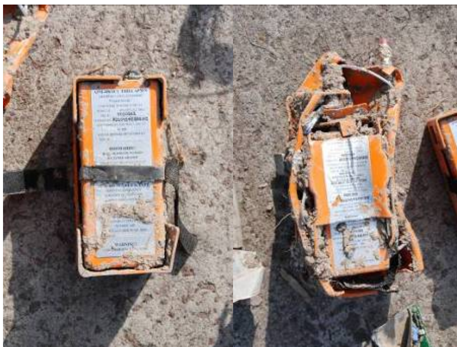
Rys. 36. Radiostacje awaryjne typu ARM-406AC1 (z lewej) i ARM-406P (z prawej)

Zabudowane podczas ostatniego remontu radiostacje awaryjne typu ARM-406AC1 nr 7523242494 i ARM-406P nr 7524241208 oraz ich systemy antenowe zostały uszkodzone w chwili wypadku w stopniu uniemożliwiającym ich zadziałanie.