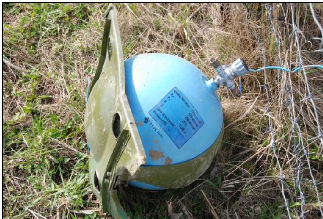
Rys. 32. Butla УБШ-25/150М wraz z częścią podstawy i przewodami tlenowymi

Na miejscu wypadku została znaleziona jedynie butla УБШ-25/150М nr 1100477, cała, nierozzerwana, wyrwana (wraz z częścią podstawy, do której była przymocowana) podczas niszczenia konstrukcji samolotu (rys 32).