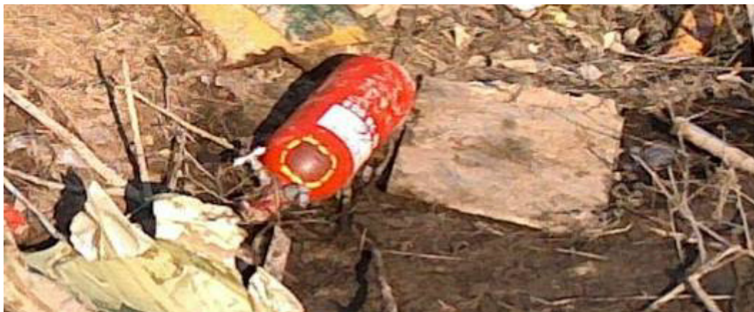
Rys. 33. Butla OCY-5II-01

Na miejscu wypadku została znaleziona jedna butla OCY-5II-01 nr 08056, cała, nierozzerwana, wyrwana podczas niszczenia konstrukcji samolotu (rys. 33).