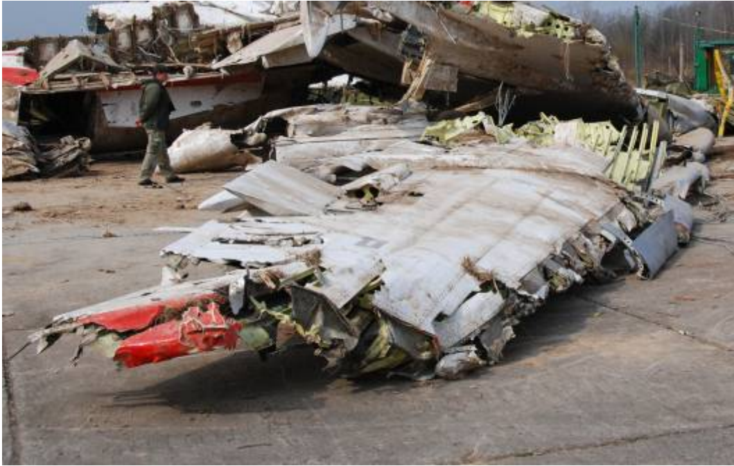
Rys. 13. Prawa część skrzydła