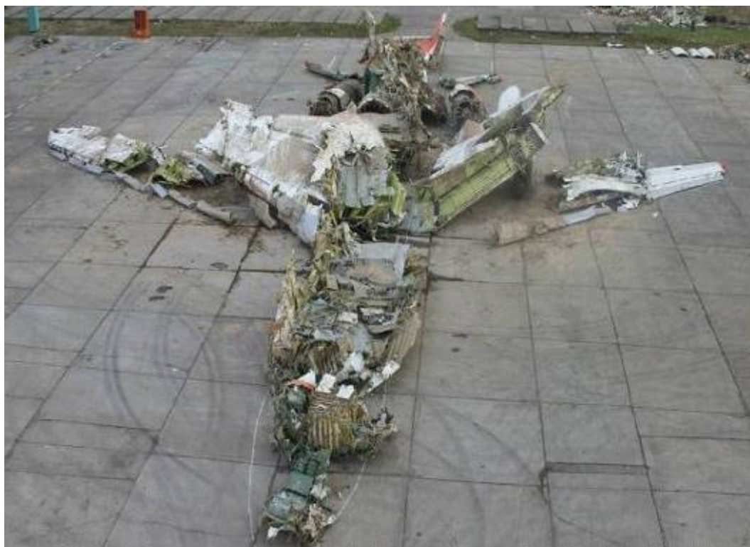
Rys. 37. Części samolotu ułożone na placu