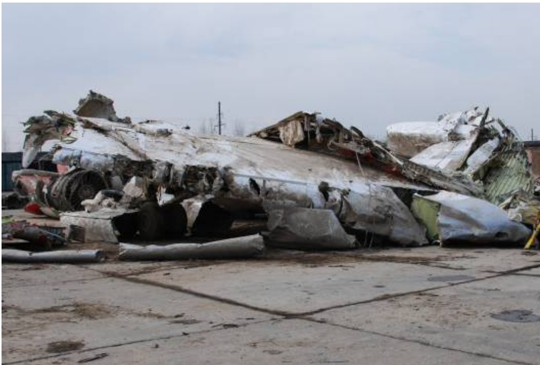
Rys. 14. Krawędź natarcia przykadłubowej części prawego skrzydła