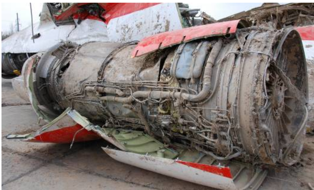
Rys. 24. Silnik prawy

Silnik nr 3 (prawy) oderwany od konstrukcji samolotu, intensywnie zanieczyszczony błotem (rys. 24). Łopaty wirnika zgięte przeciwnie do kierunku obrotów.