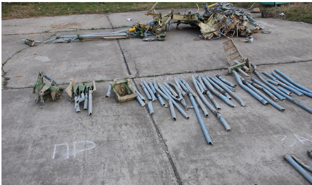
Rys. 25. Ciężna układu sterowania samolotem

Zachowały się fragmenty wolantów oraz zdeformowane pedały wraz z mechanizmami znajdującymi się pod podłogą kabiny załogi. Ciężna z układów sterowania sterem wysokości, lotkami i sterem kierunku mają liczne rozerwania w miejscach nitowania do końcówek oraz na prostych odcinkach (rys. 25 i 26). Linki układu sterowania porwane.