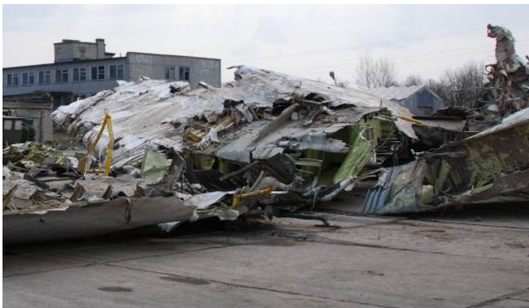
Rys. 10. Środkowa część kadłuba w rejonie centropląta