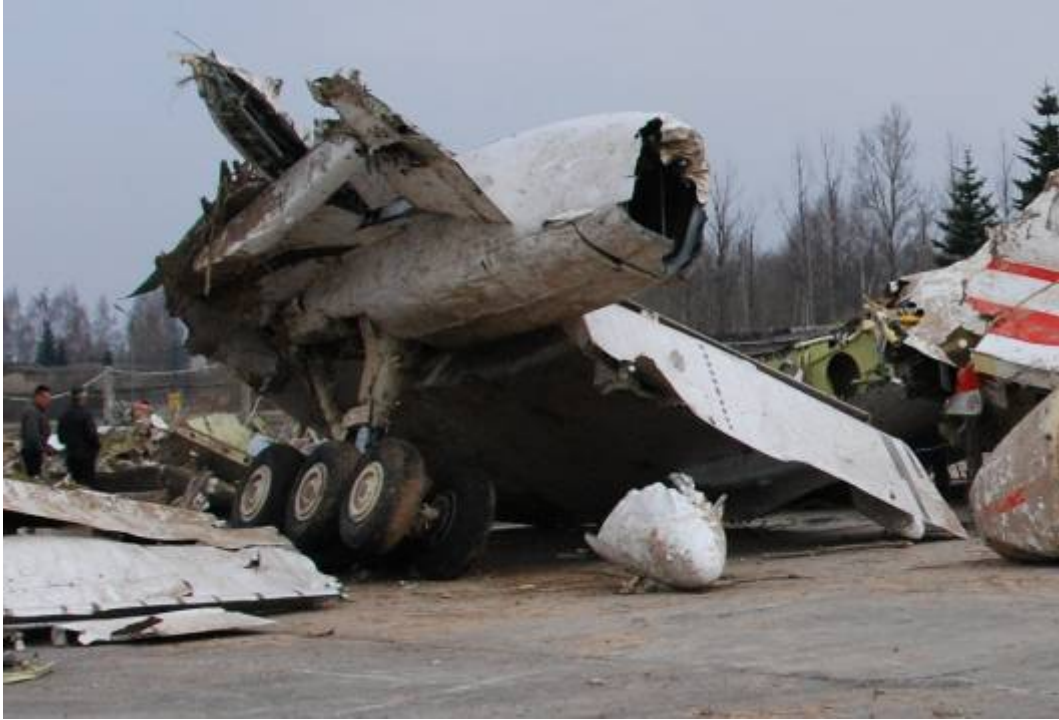
Rys.17. Krawędź spływu lewego skrzydła oraz lewe podwozie główne