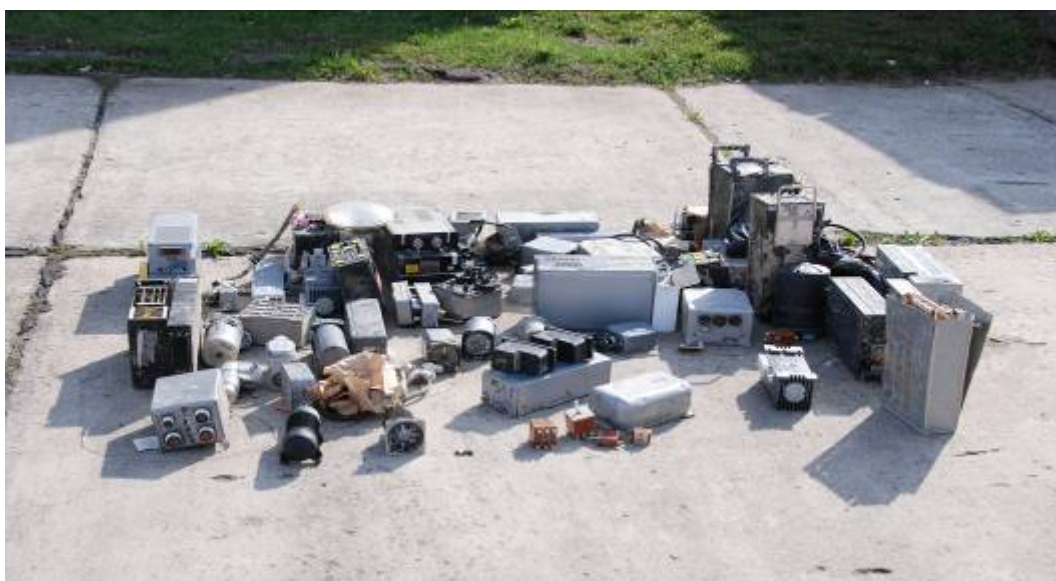
Rys. 35. Części zamienne przewożone w luku bagażowym

Najlepiej zachowały się agregaty przewożone w luku bagażowym – części zamienne, stanowiące tzw. „apteczkę techniczną” (rys. 35).