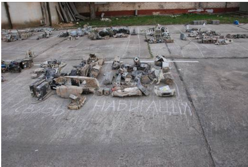
Rys. 34. Agregaty wyposażenia nawigacyjnego i łączności

Najlepiej zachowały się agregaty przewożone w luku bagażowym – części zamienne, stanowiące tzw. „apteczkę techniczną” (rys. 35).