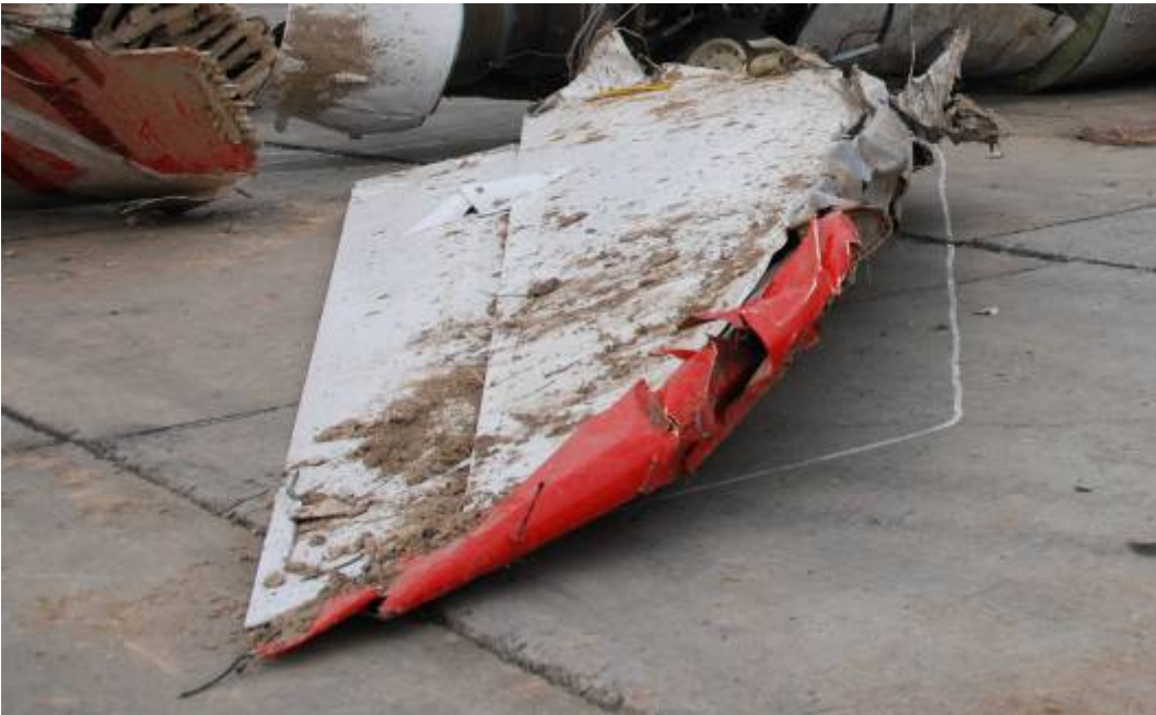
Rys. 20. Prawa część statecznika poziomego ze sterem wysokości

Prawa część statecznika oderwana w odległości 1 m od miejsca mocowania w stateczniku pionowym. Liczne wgniecenia na krawędzi natarcia, skrzywienie konstrukcji statecznika (rys. 20).