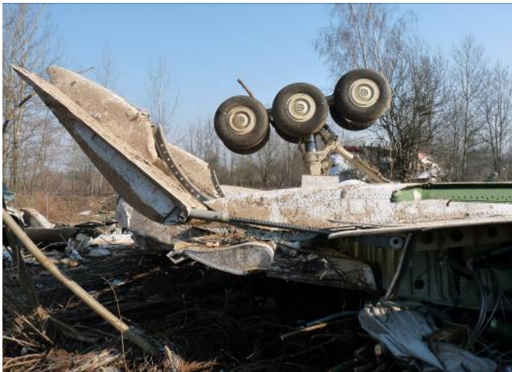
Rys. 29. Prawe podwozie główne