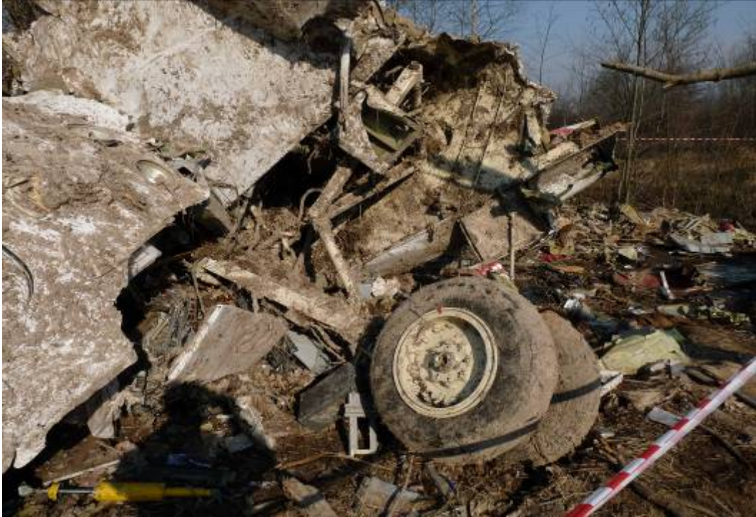
Rys. 27. Podwozie przednie

Przednia goleń podwozia ze śladami uderzeń zachowała się przymocowana do fragmentu przedniej części kadłuba samolotu. Zastrzał przedniej goleni podgięty. Golenie podwozia głównego z niewielkimi śladami uderzeń konarów drzew widoczne w szczególności na osłonach zastrzałów. Podwozie w pozycji wypuszczonej zablokowane. Koła podwozia głównego i przedniego bez widocznych śladów uszkodzeń, zabłocone (rys. 27-29).