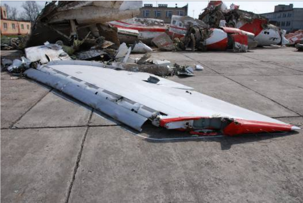
Rys. 19. Lewa końcówka skrzydła

skrzydła. Niewielkie wgniecenia o owalnym kształcie na krawędzi natarcia (slocie). Oderwany przedni fragment opływu na końcówce skrzydła;