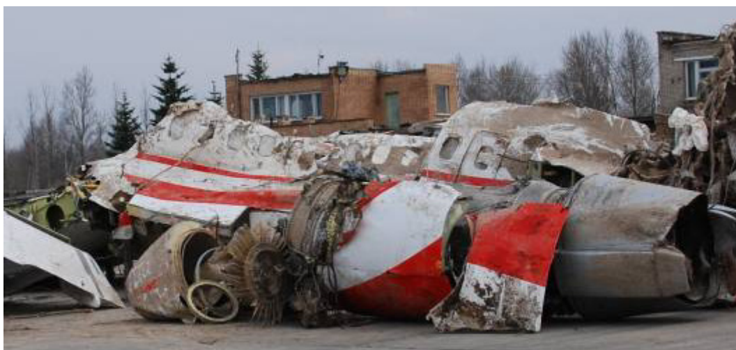
Rys. 11. Tylna część kadłuba – kabina pasażerska