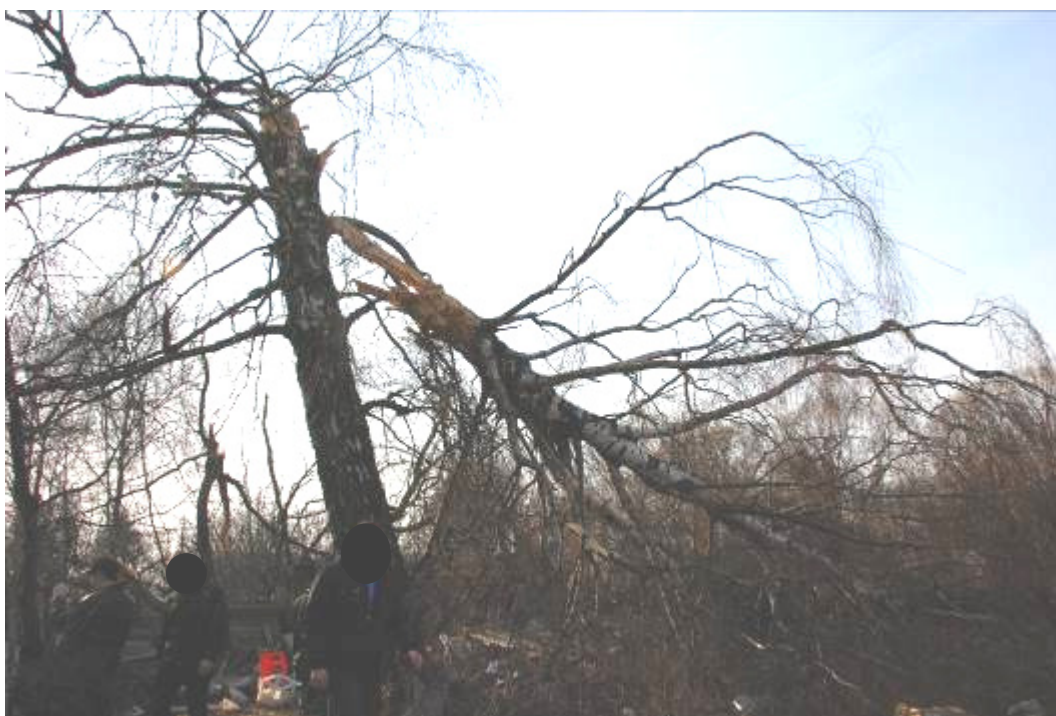
Rys. 4. Zderzenie z brzozą spowodowało oderwanie części lewego skrzydła

Zderzenie to spowodowało jednocześnie rozszczelnienie wszystkich trzech instalacji hydraulicznych – przerwane zostały przewody hydrauliczne zasilające mechanizm sterowania lewej lotki typu RP-55. Rozerwaniu przewodów hydraulicznych towarzyszył ubytek płynu hydraulicznego z instalacji oraz spadek ciśnienia w każdej z nich.