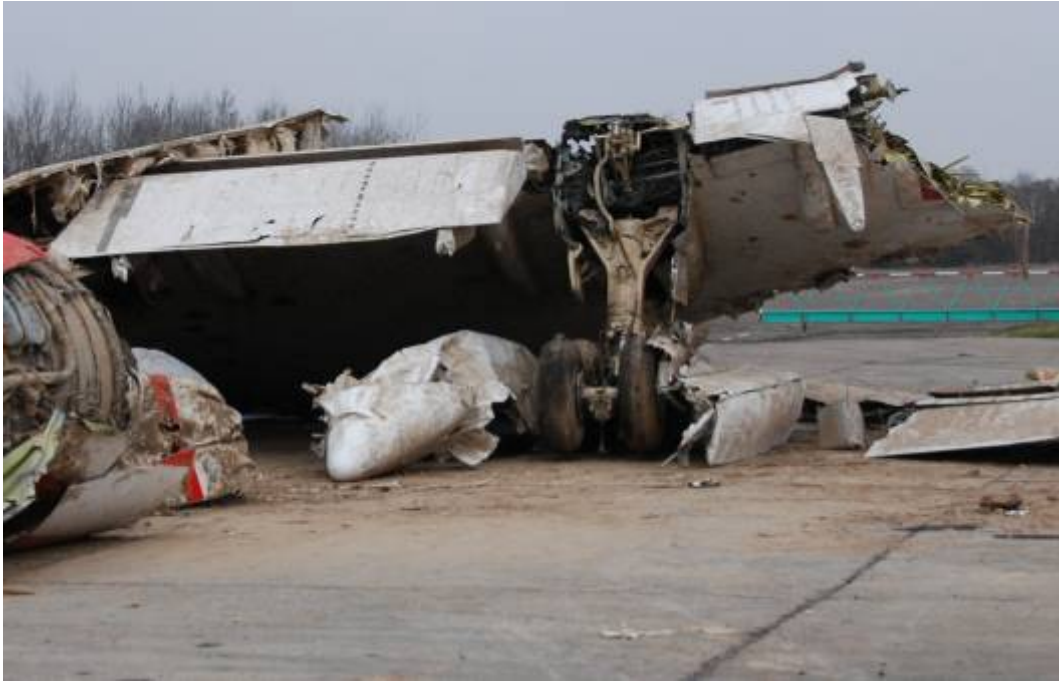
Rys. 15. Krawędź spływu prawego skrzydła oraz prawe podwozie główne