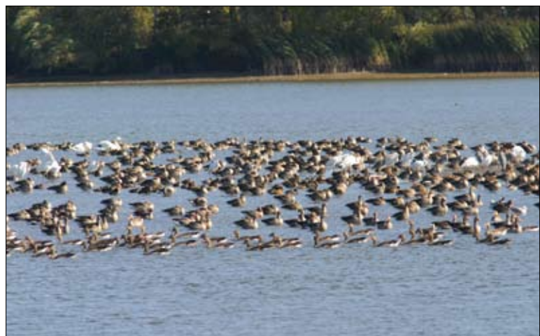
Stawy Milickie – ostoja ptactwa wodno-błotnego