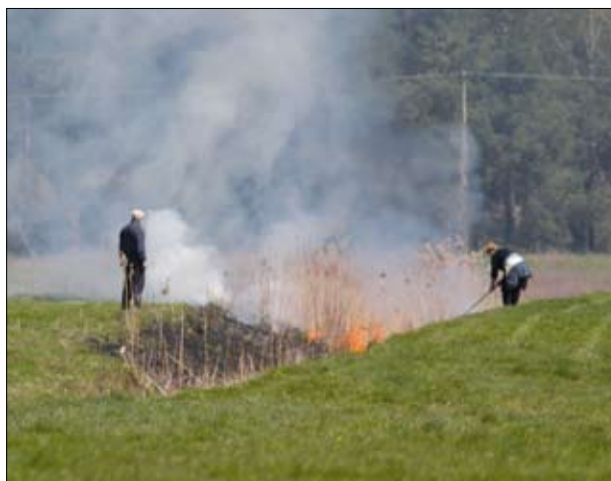
Wypalanie jest niezgodne z zasadami Dobrej Kultury Rolnej

Grunty orne położone na stokach o nachyleniu powyżej 20% nie mogą być wykorzystywane do uprawy roślin wymagających utrzymania redlin wzdłuż