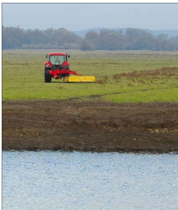
Koszenie w parku narodowym „Ujście Warty”

„Torfianki” zostały objęte szczegółowym monitoringiem pod kątem liczebności wodniczki.