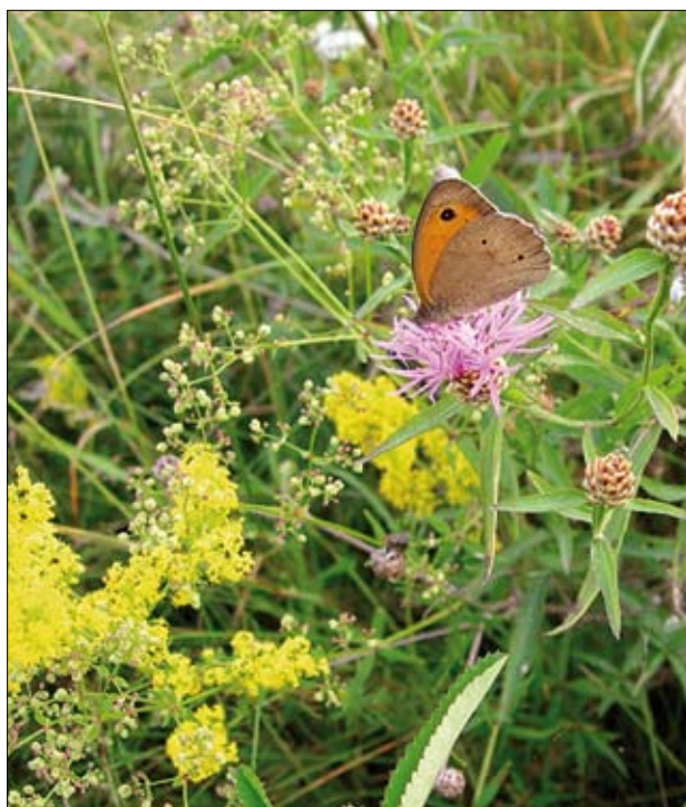
Różnorodność świata roślin wpływa na utrzymanie bogactwa gatunkowego owadów

soby, a w szczególności na bioróżnorodność. Nie wyklucza to jednak udziału przedsiębiorstw, w których przypadku inwestycje umożliwiłyby eliminację lub znaczne zmniejszenie negatywnego wpływu na bioróżnorodność. Przedsiębiorstwa starające się o wsparcie muszą być zainteresowane dokonaniem inwestycji zwiększającej pozytywny wpływ ich działalności na bioróżnorodność. Wymagane będzie także od nich poddanie się audytowi przyrodniczemu i udostępnienie niezbędnej informacji związanej z sytuacją finansową oraz zdolnością kredytową, a także wykazanie gotowości współpracy i akceptacji doradztwa w przedmiocie kredytu i inwestycji. Elementem wsparcia działalności małych i średnich przedsiębiorstw będą kredyty preferencyjne . Inicjatywa ta jest dopiero w fazie pilotażowej polegającej na typowaniu i wyborze pierwszych przedsiębiorstw, które będą w przyszłości mogły skorzystać z kredytu.