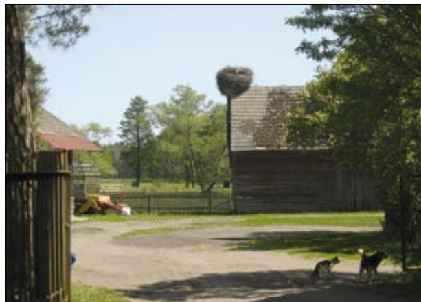
Zagroda wiejska

Zgodnie ze zmianami w prawodawstwie krajowym, regulującym kwestie ochrony przyrody, dla