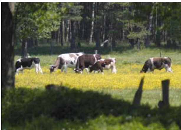
Zwierzęta wypasane w sąsiedztwie gospodarstwa

kaz wypasów zwierząt oraz działań agrotechnicznych, w tym zastosowania nawozów i wykonanych zabiegów przy użyciu środków ochrony roślin. W odniesieniu do zastosowanych nawozów rejestr jest prowadzony dla całego gospodarstwa, a więc także dla działek rolnych niezgłoszonych pod żaden pakiet rolnośrodowiskowy. Formularz rejestru oraz instrukcję jego wypełniania można otrzymać w biurze powiatowym ARiMR lub pobrać ze strony internetowej ARiMR ( www.arimr.gov.pl ).