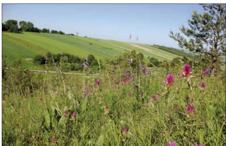
Murawa kserotermiczna

terenie tego konkretnego województwa. Po odczytaniu nazw obszarów możemy dokonać wstępnej klasyfikacji położenia danego obszaru. Jeżeli w tym miejscu rolnik zorientuje się, że jego gospodarstwo może znajdować się na terenie konkretnego obszaru, powinien przejść do załączonych z prawej strony map, z których przynajmniej wstępnie da się odczytać granice i potwierdzić lub wykluczyć położenie gospodarstwa na obszarze Natura 2000. Strona Ministerstwa Środowiska jest dotychczas jedynym miejscem, gdzie można znaleźć mapy z granicami obszarów Natura 2000. Co prawda mapy te nie są na tyle dokładne, by odnaleźć na nich konkretną działkę rolną, ale z pewnością pozwalają się dość dobrze zorientować w położeniu.