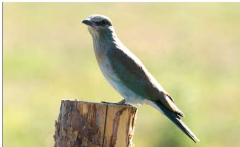
Krasza – ginący gatunek krajobrazu rolniczego Polski