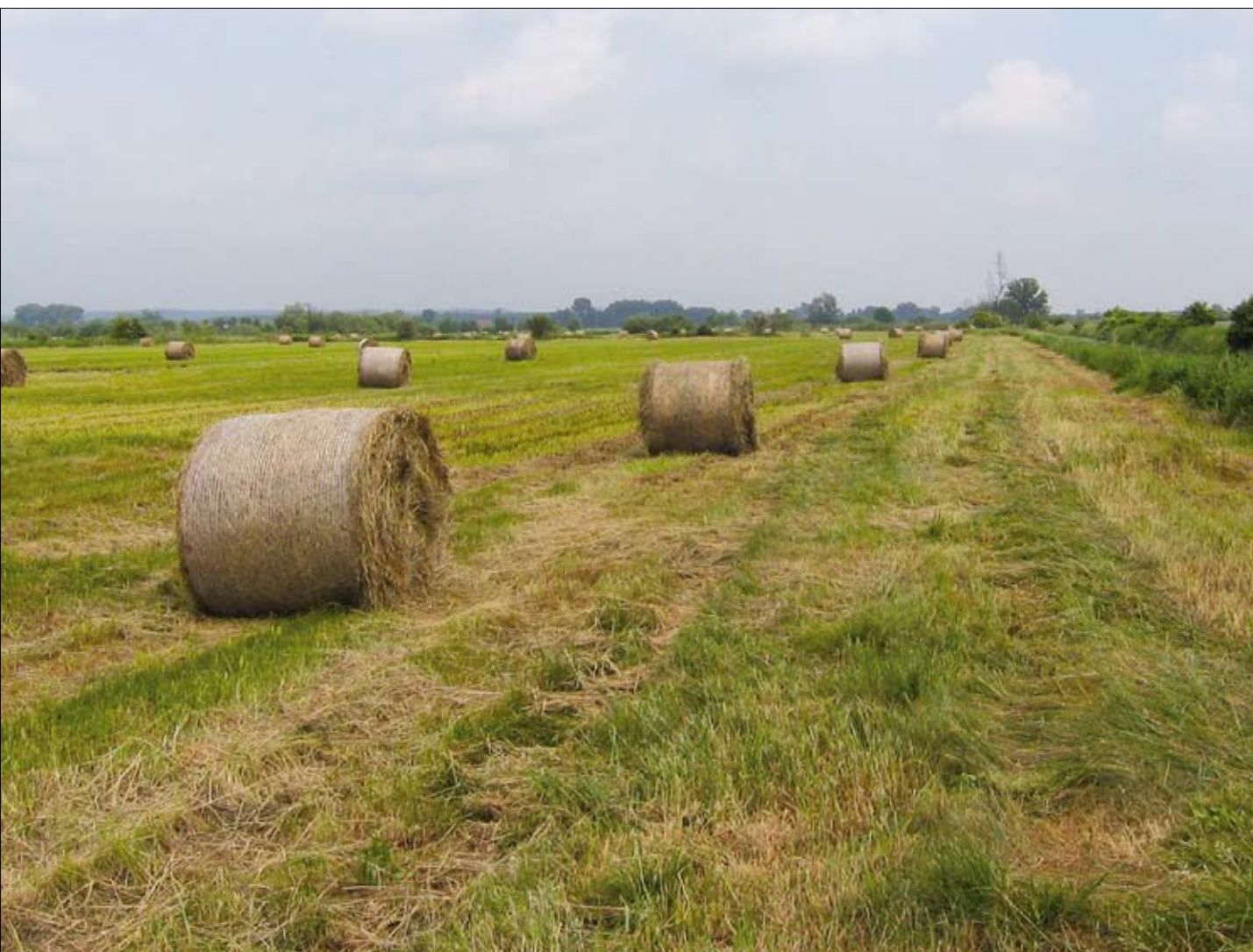
Baloty siana przygotowane do zbioru

Gospodarstwo zlokalizowane jest w granicach Obszaru Natura 2000 „Ujście Warty”, który położony jest w mezoregionie Kotlina Gorzowska, makroregionie Pradolina Toruńsko-Eberswaldzka. Administracyjnie należy on do gminy Słońsk. Powierzchnia całego gospodarstwa wynosi 194,64 ha, z czego 74,00 ha (działka 329) znajduje się w granicach Parku Na-