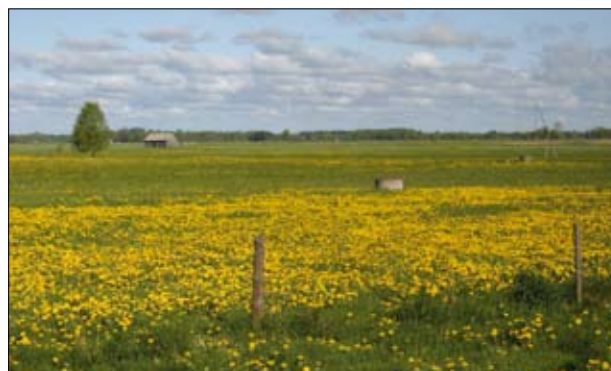
Łąki w dolinie Omulwi – siedlisko występowania kulika wielkiego

Zróżnicowana rzeźba terenu, różnorodność warunków glebowych i klimatycznych sprawiają, że Polska odznacza się dużym zróżnicowaniem siedlisk i krajobrazów naturalnych. Na obszarze Polski występuje 485 zespołów roślinnych, z których 12% stanowią zespoły często spotykane, natomiast 22% zespołów występuje rzadko i jest rejestrowana tylko na nielicznych stanowiskach. Zróżnicowany jest także udział zbiorowisk roślinnych w tworzeniu pokrywy roślinnej i szaty roślinnej, przy czym zbiorowiska wielkopowierzchniowe, zajmujące wielohektarowe przestrzenie (np. bory, agrocenozy czy łąki), stanowią 38% wszystkich zbiorowisk występujących w kraju ( Krajowa Strategia Ochrony i Umiarkowanego Użytkowania Różnorodności Biologicznej wraz z programem działań, 2007 ). Charakter naturalny i półnaturalny zachowały siedliska błotne i torfowiskowe, ekstensywne łąki i pastwiska zlokalizowane w naturalnych dolinach rzecznych, zakrzewienia śródpolne, murawy górskie i kserotermiczne z wieloma gatunkami endemicznymi. Walory środowiskowe tych terenów są zagrożone wskutek intensyfikacji produkcji rolniczej, wypalania traw, a także porzucania użytków zielonych o niskich walorach paszowych w sytuacji ogranicza-