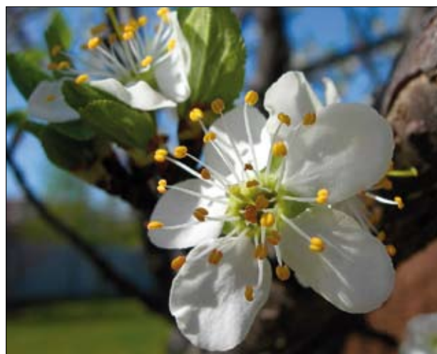
Kwitnące jabłonie starych odmian