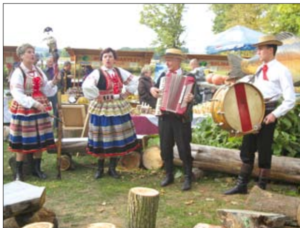
Jarmarki i święta są okazją do promocji produktów regionalnych

W ramach tego działania rolnicy uczestniczący mogą liczyć na refundację kosztów stałych związanych z uczestnictwem w wybranym systemie jakości żywności. Wsparcie jest udzielane dla następujących systemów: system Chronionych Nazw Pochodzenia , Chronionych Oznaczeń Geograficznych , Gwarantowanych Tradycyjnych Specjalności , produkcja ekologiczna oraz produkcja integrowana. W ramach działania można zwracać producentowi rolnemu (rolnikowi) „koszty stałe” związane z funkcjonowaniem w ramach systemu, np. koszty poniesione na wprowadzenie wspieranego systemu jakości żywności, roczna składka za udział w tym systemie, koszty związane z wydatkami na wymagane kontrole sprawdzenia zgodności z wymaganiami systemu. W ramach działania wsparcie przysługuje wyłącznie producentom rolnym wytwarzającym produkty rolne przeznaczone do spożycia. Odchodzi się zatem od biernego wspierania producentów rolnych, którzy nie wytwarzają produktów w celu wprowadzenia ich do obrotu. W przypadku