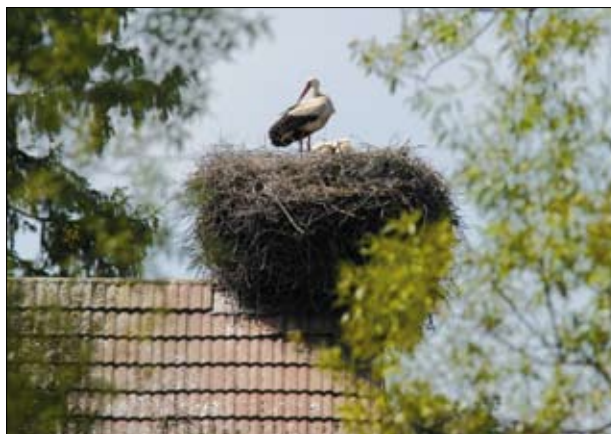
Bociany białe

Informacje na temat agroturystyki można odnaleźć na stronach Wojewódzkich Ośrodków Doradztwa Rolniczego. Znajdują się tam też adresy kwatery agroturystycznych w poszczególnych regionach.