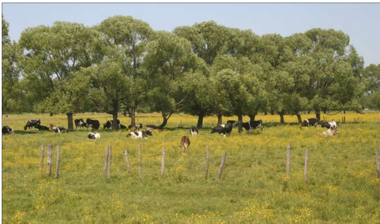
Dzięki wypasowi utrzymuje się niską roślinność pastwisk

ska opracowała i wdrożyła w ramach Planu Rozwoju Obszarów Wiejskich na lata 2004–2006 – Krajowy Program Rolnośrodowiskowy. Program ten jest już zamknięty dla nowych beneficjentów, jednakże w szczytowej jego fazie realizowało go prawie 70 tys. beneficjentów. Na terenie kraju jego całkowite zakończenie nastąpi wraz z końcem lutego 2012 r. Wraz z nową perspektywą programowo-finansową, Polska opracowała Program Rozwoju Obszarów Wiejskich na lata 2007–2013, a w jego ramach nowy program rolnośrodowiskowy. W swoim założeniu realizacja tego programu ma przyczynić się do zrównoważonego rozwoju obszarów wiejskich z jednoczesnym zachowaniem różnorodności biologicznej. W ramach programu rolnośrodowiskowego w sposób szczególny chronione są najcenniejsze środowiska, tj.: łąki, pastwiska, stare sady wraz z całą