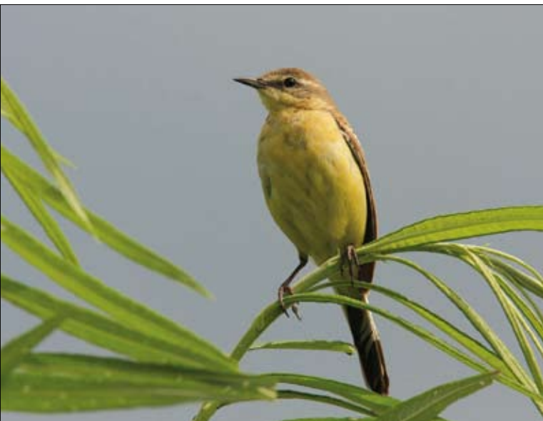
Pliszka żółta – typowy gatunek terenów rolniczych

rzystne oddziaływanie (są to takie zasoby jak gleba, czy woda), których ochrona jest niezbędna dla zagwarantowania żywotności czy też wydajności każdego gospodarstwa rolnego.