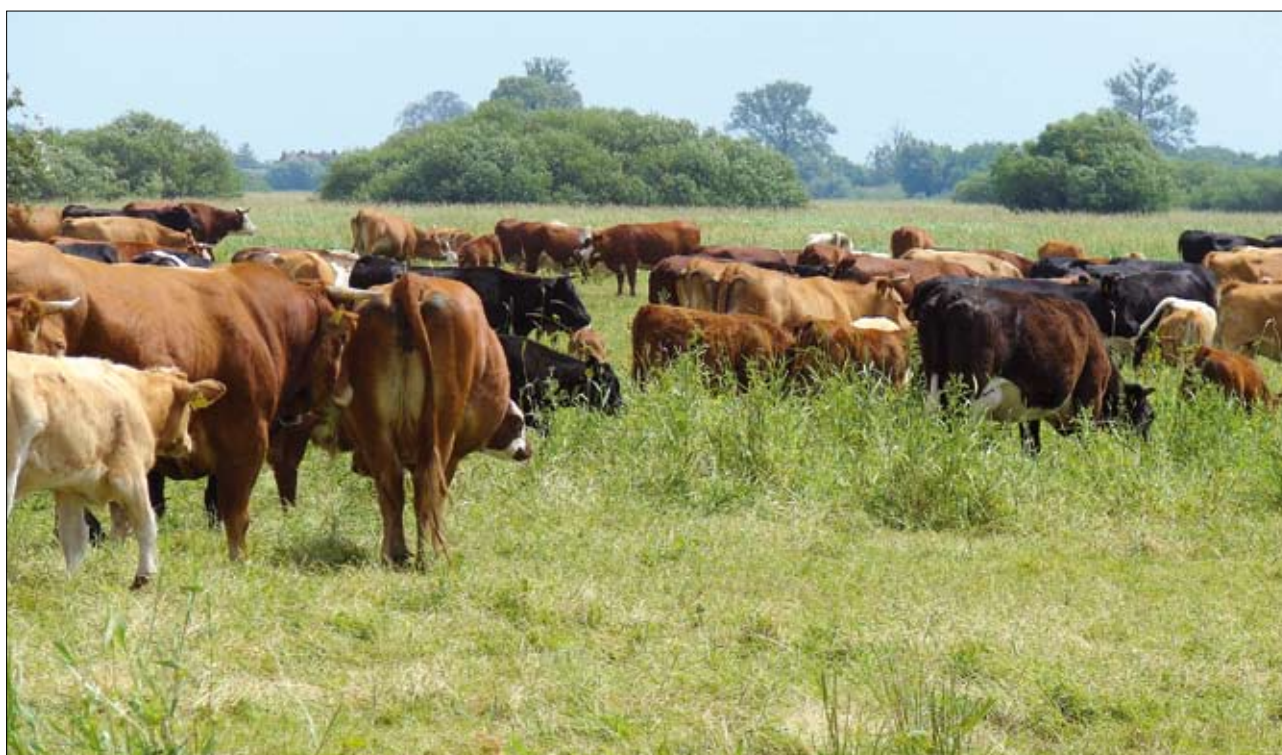
Bydło ras mięsnych wypasane na terenie parku narodowego „Ujście Warty”

rząt na naturalnym pastwisku. Dominującą rasą jest rasa Limou-sine. Stado liczy teraz około 2000 sztuk. Kierunek przyszłościowy to specjalizacja w chowie czystorasowym bydła mięsnego tej rasy. Stado mateczne pochodzi z najlepszych hodowli francuskich, niemieckich i holenderskich. Stamtąd pochodzą również rozplodniki, które są używane do krycia naturalnego. Stado jest pod oceną hodowlaną Polskiego Związku Hodowców i Producentów Bydła Mięsnego. Materiał hodowlany z tego gospodarstwa jest wpisywany do ksiąg hodowlanych prowadzonych przez Związek. Wysoką wartość hodowlaną bydła rasy Limousine potwierdzają liczne puchary i dyplomy zdobywane przez zwierzęta z tego gospodarstwa na regionalnych rolniczych wystawach i w konkursach hodowlanych. W produkcji bydła mięsnego stosowane są tu naturalne metody chowu. Są one oparte na przyjaznych zwierzętom i ekologicznych, nadodrzańskich i nad-