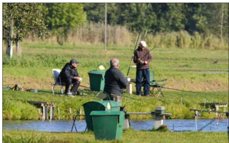
Wędkowanie stanowi urozmaicenie oferty agroturystycznej

skiej. W odpowiedzi na to powstają kwatery agroturystyczne mogące przyjmować turystów zagranicznych. Argumentem decydującym o chęci spędzenia urlopu przez turystów z innych krajów w Polsce jest nieskażona przyroda, możliwość obserwacji różnych gatunków w naturalnym środowisku czy chęć poznania kultury lub języka. Bardzo popularne w ostatnich latach stało się np. obserwowanie ptaków tzw. birdwatching (każdego roku do znanych szerzej obszarów, jak np. Bie-