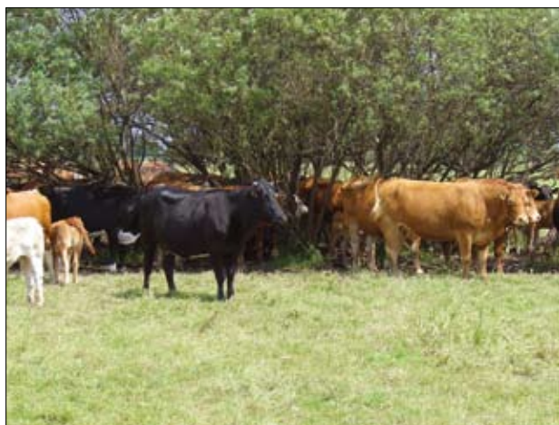
Bydło mięsne w parku narodowym „Ujście Warty”

Takie podejście do tworzenia marki obszaru cennego przyrodniczo godzi interesy ochrony przyrody z rozwojem terenów rolniczych. Pozwala ono na wykorzystanie atutów w postaci usytuowania gospodarstw na obszarze o wysokich walorach przyrodniczych i prowadzi do uzyskania przez osoby przedsiębiorcze wymiernych korzyści finansowych z codziennej działalności. Duża część działań prowadzonych w dolinie Baryczy jest realizowanych w ramach programu Leader.