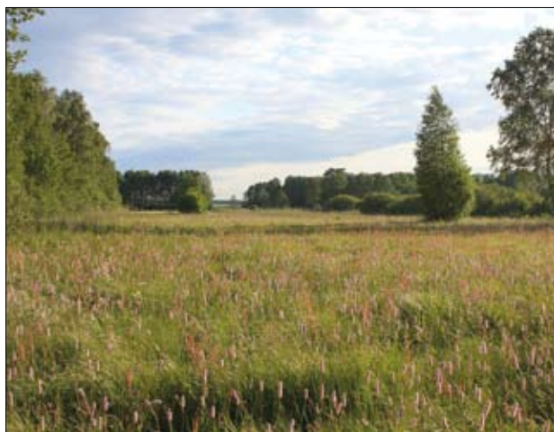
Łąka wilgotna w dolinie Liwca