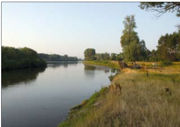
Dolina Rzeki Bug

brzański Park Narodowy, Park Narodowy Ujście Warty czy inne, zjeżdżają zorganizowane grupy turystów zagranicznych). Osoby takie chętnie korzystają z oferty agroturystycznej gmin czy powiatów, wyszukując kwatery agroturystyczne w sieci internetowej.