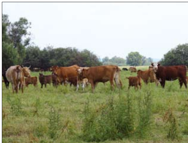
Bydło mięsne w parku narodowym „Ujście Warty”

warciańskich naturalnych pastwiskach położonych w Parku Narodowym „Ujście Warty”. Gospodarstwo posiada również stado 400 koni ciężkich ras, które także wypasane są przez cały rok na naturalnych użytkach zielonych w Parku.