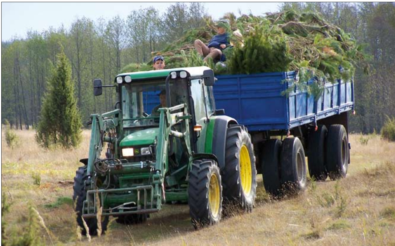
Usuwanie samosiewów sosny pomaga w zachowaniu otwartego krajobrazu