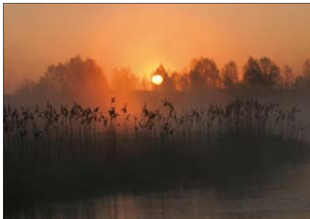
Świt w dolinie rzeki Omulwi

W związku z tym baza agroturystyczna będzie w najbliższych latach rozwijać się dynamicznie, z pewnością także na obszarach Natura 2000. Wiele gospodarstw agroturystycznych wykorzystuje już dziś atuty wynikające ze swojej lokalizacji. Coraz częściej w ich ofercie podkreśla się, że są położone na obszarach Natura 2000, a niejednokrotnie wymieniane są konkretne walory danego obszaru mające zachęcić turystów do przyjazdu. Oprócz noclegów gospodarstwa takie oferują często własne produkty, tj. jaja, sery, chleb, miody czy owoce z przydomowego sadu. Jeśli w okolicy są dodatkowo organizowane ciekawe wydarzenia jak Niedziela Palmowa, Miodobranie, wyścigi psich zaprzęgów, spływy kajakowe czy inne podobne imprezy to okoliczne gospodarstwa nie narzekają z reguły na brak chętnych.