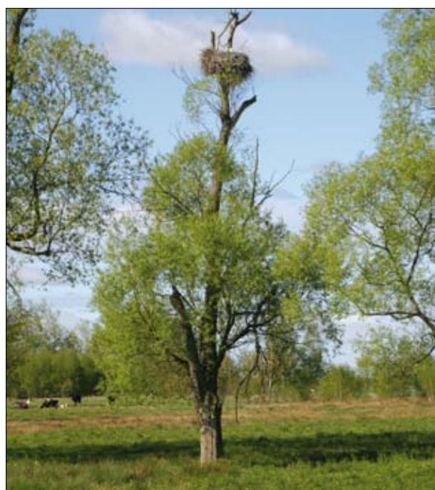
Krajobraz rolniczy z bocianim gniazdem

rolnośrodowiskowe wypłacane są do czerwca roku następującego po roku złożenia wniosku.