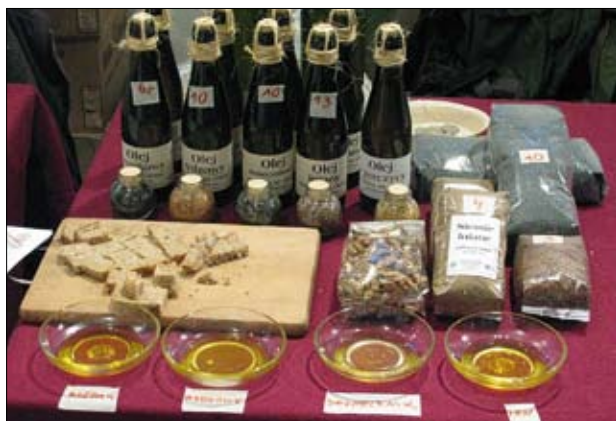
Produkty uzyskiwane w gospodarstwie