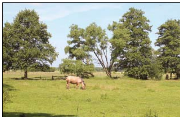
Z każdym rokiem zmniejsza się liczba wypasanych zwierząt

Kontrola zgodności polega m.in. na sprawdzeniu, czy grunt jest zajęty pod uprawę roślin lub jest ugorowany przez okres nie dłuższy niż 5 lat. W odniesieniu do gruntów ugorowanych jest wymagane przeprowadzenie koszenia lub zabiegów uprawowych zapobiegających występowaniu i rozprzestrzenianiu chwastów co najmniej raz w roku w terminie do 31 lipca , a na łąkach/pastwiskach zostało wykonane koszenie i usuwanie masy do 31 lipca lub wypasano na nich zwierzęta. Różnica w terminach koszenia odnosi się do łąk zadeklarowanych do płatności z tytułu przedsięwzięć rolnośrodowiskowych i poprawy dobrostanu zwierząt (program rolnośrodowiskowy 2004–2006). Na takich obszarach koszenie i usuwanie masy powinno być prowadzone także przynajmniej raz w roku, ale w terminie do 31 października . W przypadku realizacji programu rolnośrodowiskowego w ramach PROW 2007–2013 zasady gospodarowania na łąkach i pastwiskach tożsame są w terminie i zakresie z wytycznymi