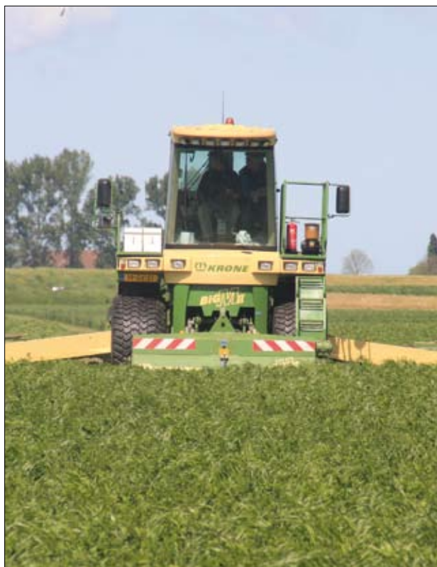
Intensywne rolnictwo – pośrednia przyczyna zmniejszenia liczebności wielu gatunków

Produkcja rolna opiera się na wykorzystaniu zasobów naturalnych szczególnie wrażliwych na nieko-