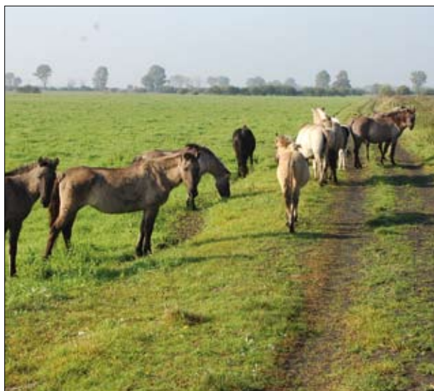
Koniki polskie w parku narodowym „Ujście Warty”

W ostatnich latach przedstawia się ona w sposób następujący: 2005 r. – 4, 2006 r. – 5, 2007 r. – 8, 2008 r. – 7 śpiewających samców. Użytkowanie kośne jest ściśle uzależnione od czasu trwania okresu lęgowego. Odbywa się zwykle nie wcześniej niż na początku sierpnia. Od roku 2005 na opisywanym terenie realizowany jest pakiet P01a02 Półnaturalne łąki jednokośne programu rolnośrodowiskowego 2004–2006. Równocześnie obszar ten został zgłoszony do jednostki certyfikującej jako gospodarstwo ekologiczne. Dla omawianego gospodarstwa program rolnośrodowiskowy w ramach PROW 2007–2013 daje możliwość sporządzenia nowego planu rolnośrodowiskowego w ramach wariantu 5.1 Ochrona siedlisk lęgowych ptaków w 2010 roku.