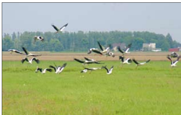
Bociany białe

skie muszą wyznaczyć sprawujących nadzór nad tymi obszarami oraz przygotować dla nich plany zarządzania wraz z działaniami ochronnymi, mają prowadzić monitoring oraz raportować do Komisji Europejskiej o stanie siedlisk oraz gatunków. W Polsce wyznaczeniem tych obszarów i nadzorowaniem nimi zajmują się Ministerstwo Środowiska (Główny Konserwator Przyrody) i Główny Dyrektor Ochrony Środowiska oraz Regionalni Konserwatorzy Przyrody i Regionalne Dyrekcje Ochrony Środowiska. Ponadto obowiązkiem każdego państwa jest podejmowanie działań dla zachowania lub odtworzenia stanu gatunków i siedlisk, zapobieganie pogorszeniu tego stanu oraz niedopuszczenie do realizacji planów i przedsięwzięć zagrażających integralności obszarów.