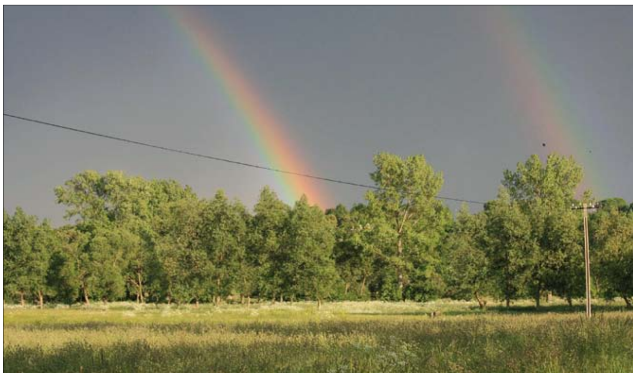
Obszar Natura 2000 „Dolina Dolnego Bugu” w okolicy Korczewa

wymierne korzyści finansowe, jak również potencjalną możliwość tworzenia marki Natura 2000, której celem może być promocja wszystkich produktów wytwarzanych na terenie obszaru. Wielu rolników gospodarujących na obszarach Natura 2000 dostrzegło już możliwość wykorzystania tego faktu do podniesienia wysokości swoich dochodów. Zrozumieli oni, że wzrost dochodów może odbywać się w zasadzie bez znaczących zmian w sposobie gospodarowania, trzeba tylko w umiejętny sposób zaprezentować swoje produkty. Narzędziem skutecznej promocji wyrobów nie musi być nawet kampania promocyjna, a wystarczy tylko pokazać je na różnego rodzaju okolicznościowych imprezach. Jeśli produkt ma identyfikowalne, poszukiwane przez coraz bardziej wymagających konsumentów walory będzie kupowany nawet w miejscu jego wytwarzania, co dodatkowo może podnosić opłacalność jego produkcji. Wytwarzanie produktów