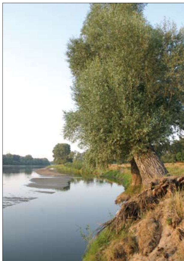
Dolina rzeki Bug w okolicach Kamieńczyka

System Natura 2000 oparty jest na dwóch kluczowych dyrektywach unijnych, które są podstawą do two-