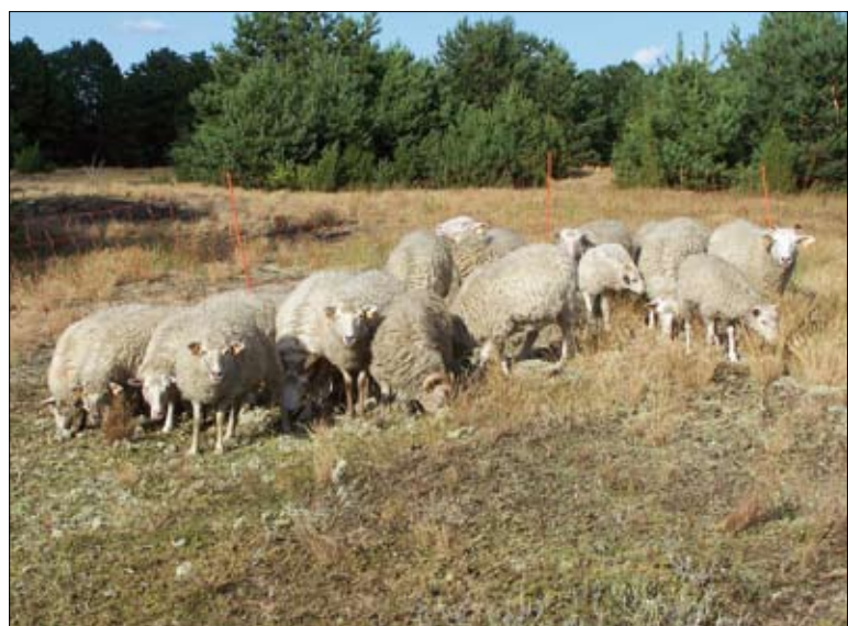
Stado owiec rasy świniarka