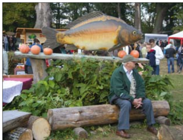
„Dni karpia” w dolinie Baryczy