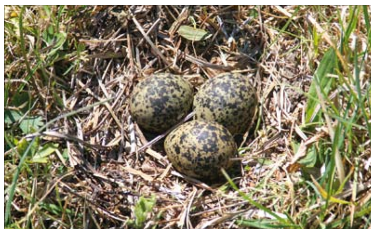
Gniazdo czajki