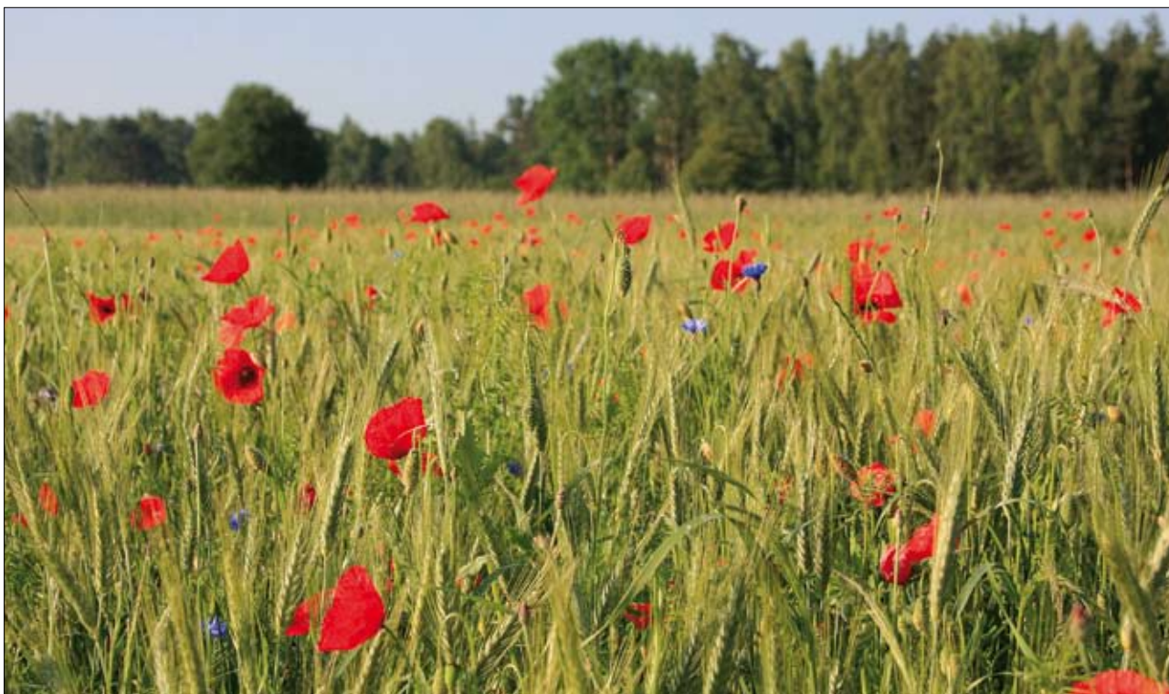
Uprawa zbóż z makami

Rolnictwo ekologiczne określa się jako system gospodarowania o zrównoważonej produkcji roślinnej i zwierzęcej. Produkcja ekologiczna powinna łączyć przyjazne środowisku praktyki gospodarowania, wspomagać wysoki stopień różnorodności biologicznej, wykorzystywać naturalne procesy oraz zapewniać właściwy dobrostan zwierząt. Rolnictwo ekologiczne jest więc systemem wpływającym pozytywnie na środowisko naturalne, co też przyczynia się do osiągnięcia szeroko rozumianych korzyści rolnośrodowiskowych. Rolnictwo ekologiczne jest także odpowiedzią na zmieniającą się strukturę popytu na rynku. Konsumenty skłaniają się ku produktom uzyskiwanym metodami ekologicznymi, chcą je kupować i zazwyczaj płacą za nie wyższą cenę niż za produkty, które nie zostały wytworzone takimi metodami. Sektor rolnictwa ekologicznego rozwija się dość szybko, co znajduje odzwierciedlenie we wzroście podaży wysoko jakości-