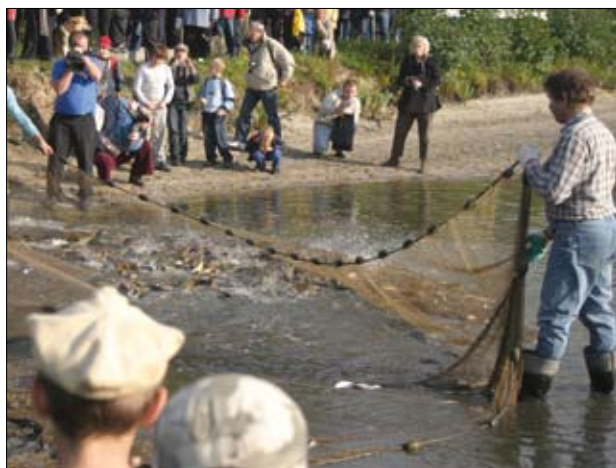
Stawy Milickie – pokazowe odłowy karpia