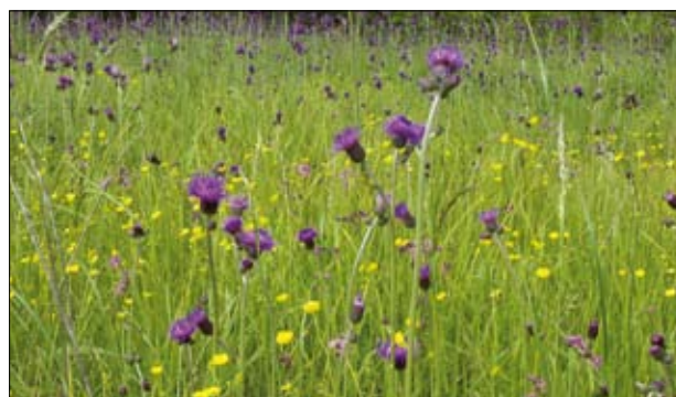
Łąka wilgotna z ostrożeniem – siedlisko kwalifikujące do udziału w programach rolnośrodowiskowych

Rolnicy chętni do przystąpienia do programu rolnośrodowiskowego powinni w pierwszej kolejności zgłosić się do doradcy rolnośrodowiskowego, który przedstawi warunki udziału w programie i dopomoże w dalszej procedurze. Przy pomocy doradcy rolnośrodowiskowego sporządzony zostanie plan działalności rolnośrodowiskowej, którego posiadanie jest jednym z warunków udziału w programie rolnośrodowiskowym. Na podstawie wywiadu z rolnikiem, a także wizji terenowej doradca wstępnie zakwalifikuje gospodarstwo do udziału w programie. W przypadku opinii pozytywnej nt. możliwości przystąpienia rolnika do pakietów przyrodniczych (pakiet 4 i 5) zaleci kontakt z ekspertem odpowiedniej profesji (botanikiem i/ lub