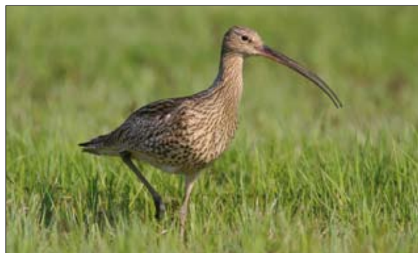
Kulik wielki

nia pogłowia zwierząt. Na skutek zachowania tradycyjnych form ekstensywnej gospodarki rolnej, do naszych czasów zachowały się miejscowe odmiany roślin uprawnych oraz lokalne rasy zwierząt gospodarskich. Regiony występowania starych odmian roślin znajdują się głównie w południowej części kraju (region górski). Polska posiada znaczące zasoby genetyczne zwierząt gospodarskich. W ich skład wchodzi 215 rodzimych ras zwierząt, z których część jest objęta programami ochrony zasobów genetycznych. Rasy rodzime są szczególnie przydatne do utrzymywania w systemie produkcji ekstensywnej połączonej z wypasem ekologicznym, co pozwala na efektywne zagospodarowanie terenów półnaturalnych, o ubogich zasobach paszowych.