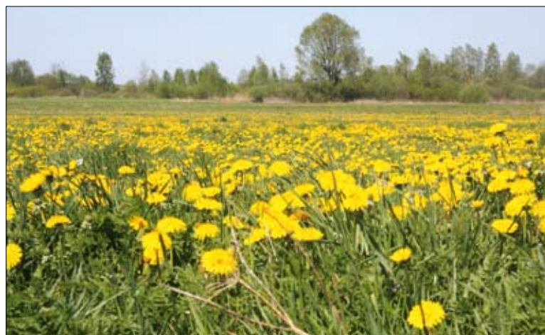
Typowe środowisko występowania czajki i rycyka

kiszonkowych wymagane jest zabezpieczenie ich przed wyciekami soków do gruntu.