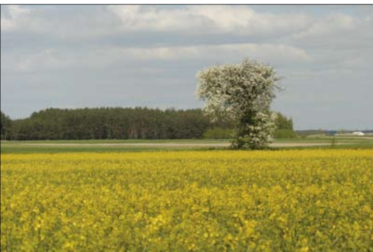
Typowy krajobraz rolniczy wschodniej Polski

W 2005 r. powierzchnia użytków rolnych, która była użytkowana przez gospodarstwa rolne, wynosiła 15 906,0 tys. ha (50,9% powierzchni kraju). Dominującą rolę wśród użytków rolnych odgrywały grunty orne, które stanowiły ponad 39% powierzchni kraju, oraz trwałe użytki zielone – 10,8% powierzchni kraju, zajmujące odpowiednio 12 222,0 tys. ha i 3 387,5 tys. ha (tabela 2).