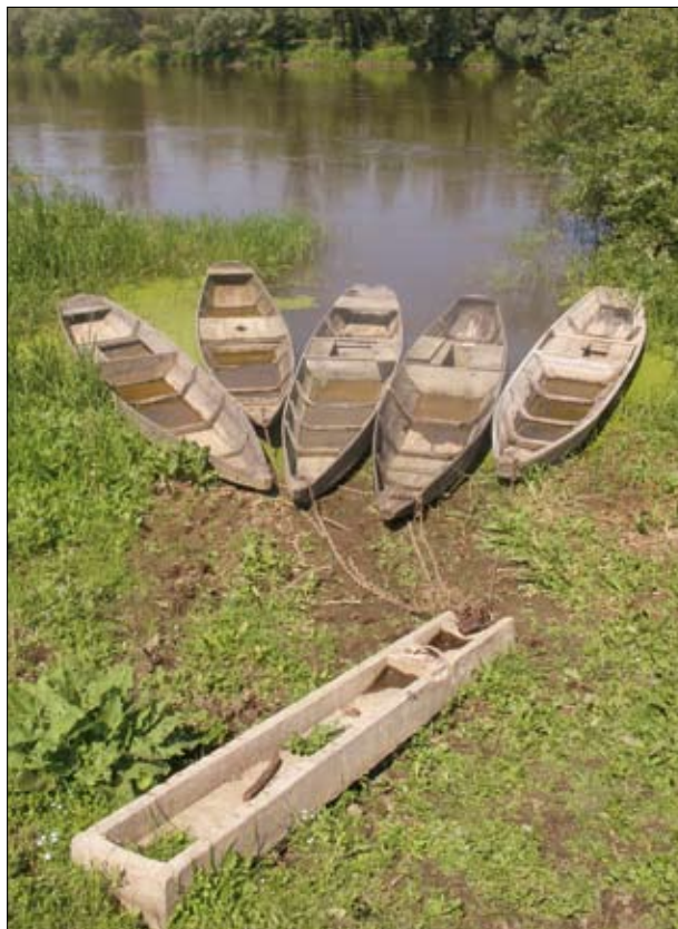
Dolina Bugu

ruje dochodów. Dopiero połączenie hodowli owiec z innymi pakietami może pozwolić na osiągnięcie określonych korzyści finansowych.