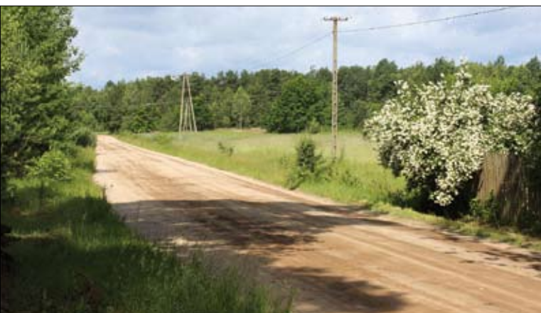
Krajobraz wiejski w okolicy Wyszkowa nad Bugiem

W styczniu 2007 roku rozpoczęła się nowa perspektywa budżetowa Unii Europejskiej, a zarazem nowy okres programowania. Utworzono dwa fundusze rolne. Pierwszy z nich – Europejski Fundusz Gwarancji Rolnych, który finansuje płatności bezpośrednie oraz organizację wspólnych rynków rolnych. Drugi z nich – Europejski Fundusz Rolny na rzecz Rozwoju Obszarów Wiejskich (EFRROW), jest głównym źródłem wspierania rozwoju obszarów wiejskich.