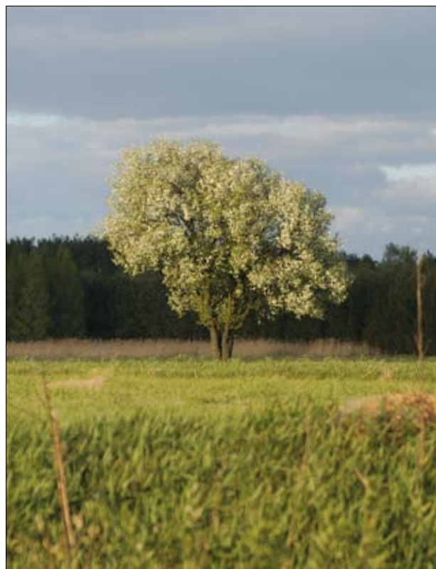
Śródpolna grusza – coraz rzadszy element krajobrazu rolniczego