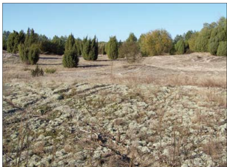
Murawy napiaskowe w rezerwacie „Kózki” nad Bugiem

zwierząt i roślin. Na opisywanym obszarze występują obecnie głównie niskotowarowe gospodarstwa rolne o średniej powierzchni 10 ha, niespecjalizujące się w określonym rodzaju produkcji. Gospodarstwa te są najczęściej zarządzane przez starszych wiekiem rol-