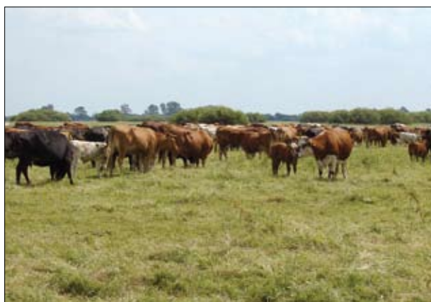
Bydło mięsne