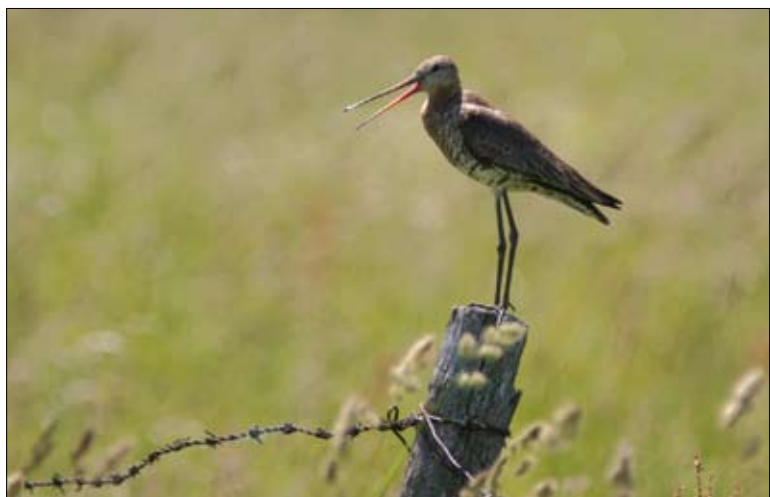
Rycyk – gatunek kwalifikujący