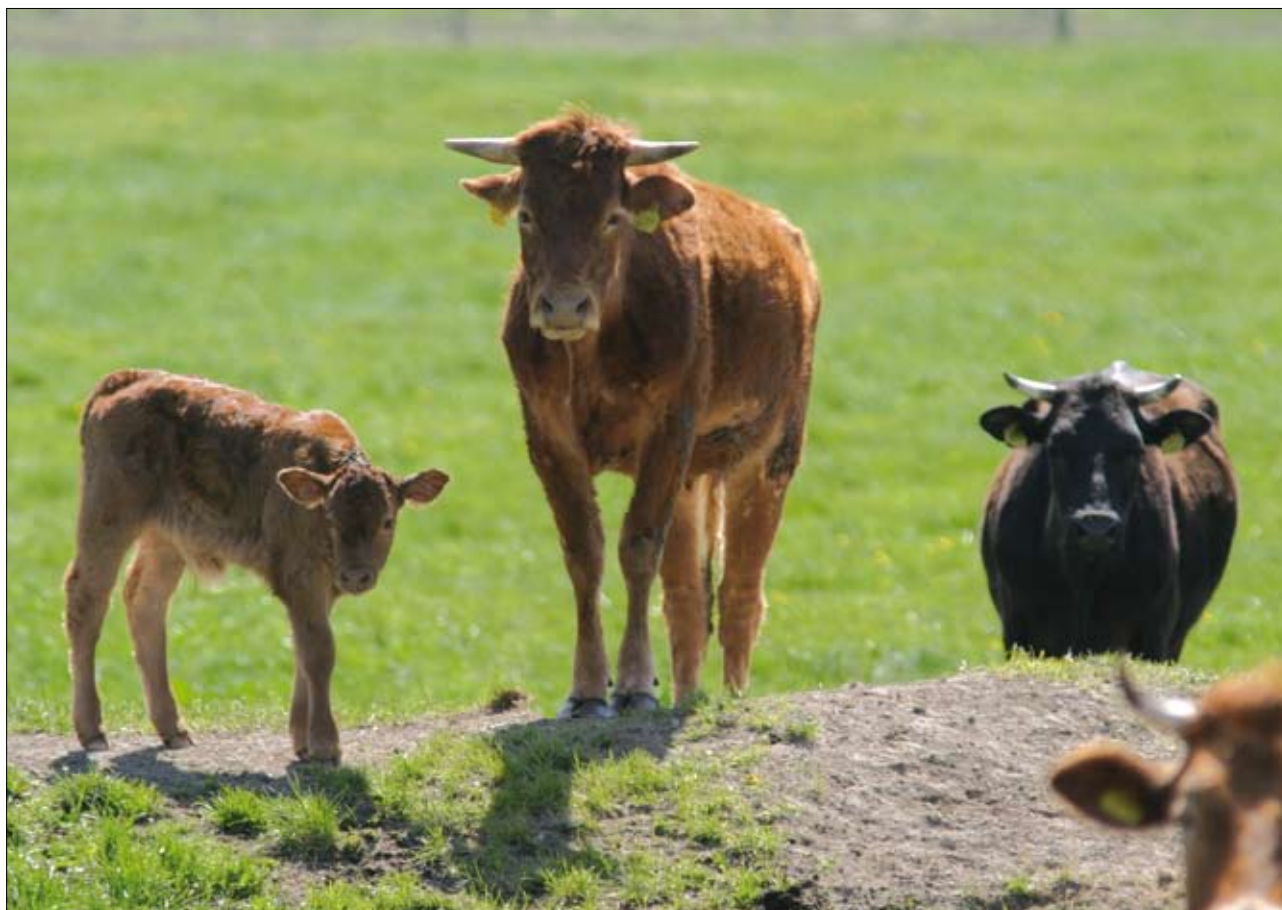
Wypas zwierząt jest jednym z czynników pomagających utrzymać bioróżnorodność

zane były z prowadzoną działalnością (np. grunty będące pod zabudowaniami, pod drogami, torfowiska, zwirownie). Średnia powierzchnia gruntów w jednym gospodarstwie rolnym w 2005 r. wynosiła 6,71 ha (dla gospodarstw indywidualnych 5,86 ha), w tym użytków rolnych – 5,82 ha (dla gospodarstw indywidualnych – 5,13 ha). Natomiast średnia powierzchnia gruntów w gospodarstwach o powierzchni powyżej 1 ha UR ogółem wynosiła 9,93 ha (dla gospodarstw indywidualnych – 8,63 ha), użytków rolnych – 8,69 ha (dla gospodarstw indywidualnych – 7,65 ha) (GUS, 2006). Biorąc pod uwagę gospodarstwa rolne, które prowadzą działalność rolniczą, średnia powierzchnia użytków rolnych w tych gospodarstwach w 2005 r. wynosiła 6,19