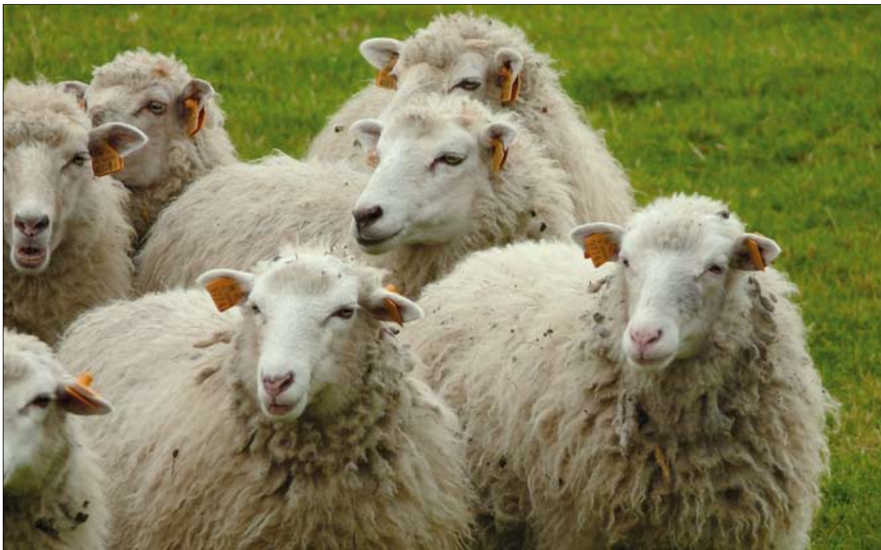
Owce świniarki – rasa objęta programem zachowania zasobów genetycznych

rzenia tych obszarów: tzw. Dyrektywie Ptasiej z 1979 r. (Dyrektywa o ochronie dziko żyjących ptaków – 79/409/EWG) oraz Dyrektywie Siedliskowej z roku 1992 (Dyrektywa o ochronie siedlisk przyrodniczych oraz dziko żyjącej fauny i flory – 92/43/EWG). W myśl obydwu aktów prawnych, na terenie krajów członkowskich dla ochrony zagrożonych wyginięciem w skali Europy gatunków ptaków oraz pozostałych gatunków zwierząt i siedlisk przyrodniczych wyznacza się ostoje, na których terenie występują znaczące ich populacje. Dyrektywy te określają m.in. listy gatunków roślin, zwierząt oraz siedlisk przyrodniczych, które podlegają ochronie w ramach sieci Natura 2000. Ponieważ wymienione są na nich gatunki cenne dla całej Wspólnoty, na listach poszczególnych krajów mogą znajdować się gatunki rzadkie oraz dość liczne w danym kraju. Takim gatunkiem występującym dość szeroko w Polsce jest np. bocian biały (w niektórych rejonach kraju jest nawet gatunkiem średnio liczny), czy coraz powszechniejszy w Polsce – bóbr. W ramach sieci Natura 2000 funkcjonują dwa rodzaje obszarów ochrony: specjalne obszary ochrony siedlisk (SOO) tzw. obszary siedliskowe oraz obszary specjalnej ochrony ptaków (OSO) tzw. obszary ptasie. W praktyce obydwie rodzaje obszarów dość często pokrywają się ze sobą terytorialnie.