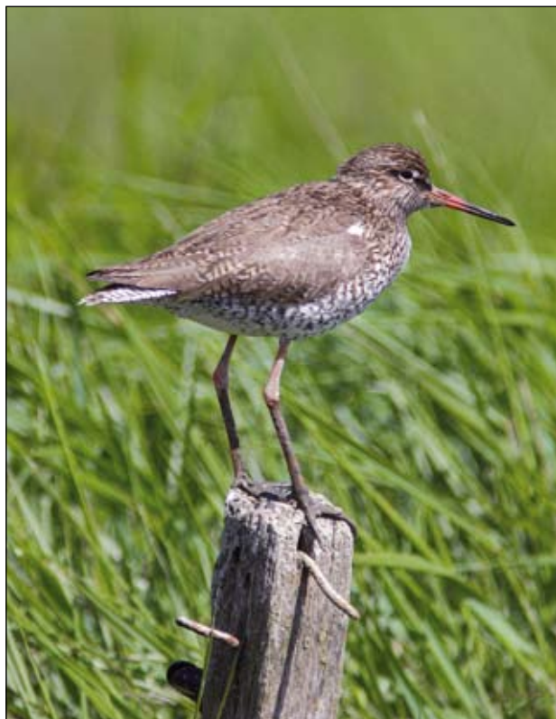
Krwawodziób – gatunek kwalifikujący do udziału w programach rolnośrodowiskowych

Ochrona środowiska. W związku z obowiązującymi wymaganiami związanymi z ochroną środowiska, w wytypowanych gospodarstwach przeprowadzane będą kontrole dotyczące ochrony wód