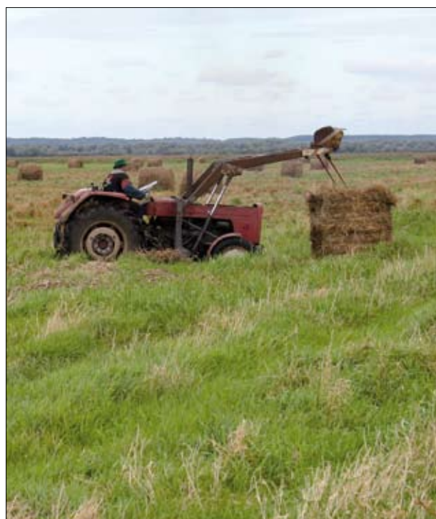
Zbiór siana