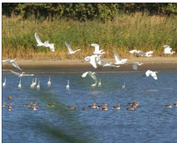
Czaple i gęsi na Stawach Milickich

Celem projektu jest ochrona i utrzymanie bioróżnorodności Doliny Baryczy. Aby zrealizować cel