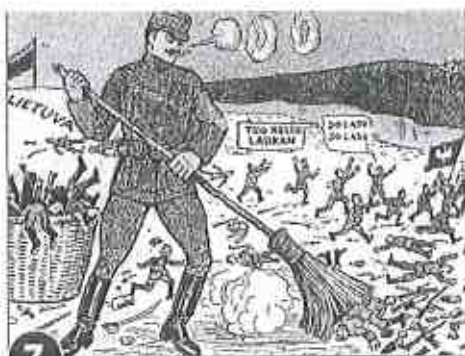
Karykatura Litwinów z USA (1921)