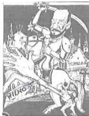
Polska karykatura z 1920 r.

I. Kapleris i inni, Laikas, Istorijos vadovėlis 10 klasei, V., 2007, część I, s. 48-52.