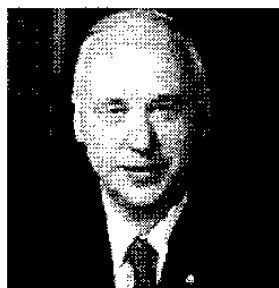
Aleksander Iwanowicz Bastrykin

Komitet Śledczy Federacji Rosyjskiej utworzono 15 stycznia 2011 r. na mocy Ustawy o Komitecie Śledczym Federacji Rosyjskiej 1 , w miejsce Komitetu Śledczego przy Prokuraturze Federacji Rosyjskiej, tworząc tym samym samodzielny organ o szerokich kompetencjach.