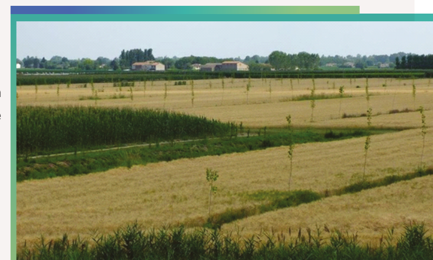
Nasadzenia topól w systemie rolno-leśnym. Północne Włochy.