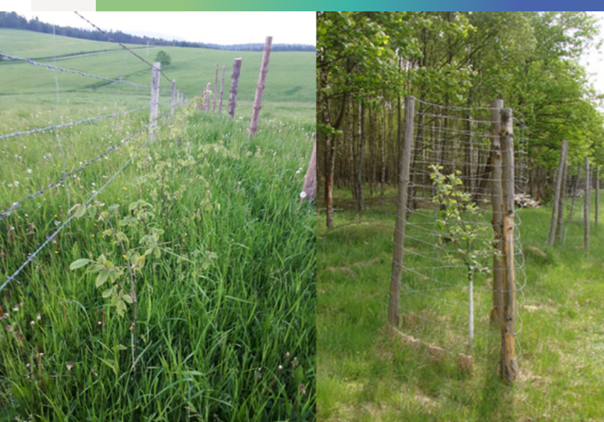
Przykłady zabezpieczania drzew przez zwierzętami hodowlanymi i dzikimi.

Zaleca się sposób ochrony drzewek, dostosowany do lokalnie występującego poziomu zagrożeń ze strony dzikiej zwierzyny, uwarunkowanej stanem populacji poszczególnych gatunków. Warto skonsultować się w tej sprawie z nadleśnictwem lub kołem łowieckim zarządzającym danym obszarem. W tabeli podano maksymalną wysokość uszkodzeń, powodowanych przez dzikie zwierzęta. Do zasięgu potencjalnych uszkodzeń należy dostosować formę i wysokość zabezpieczenia drzewka.