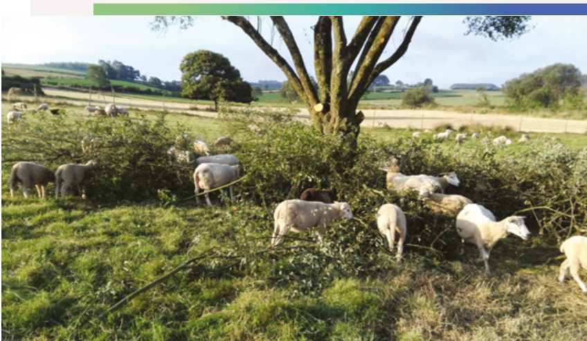
Pasza liściarka może być cennym uzupełnieniem diety zwierząt.