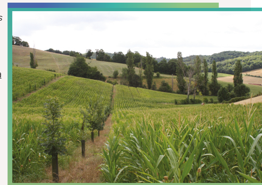
System rolno-leśny w południowej Francji.