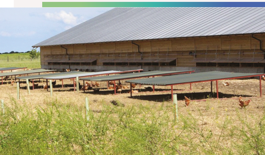
Woodland Eggs. Wielka Brytania.