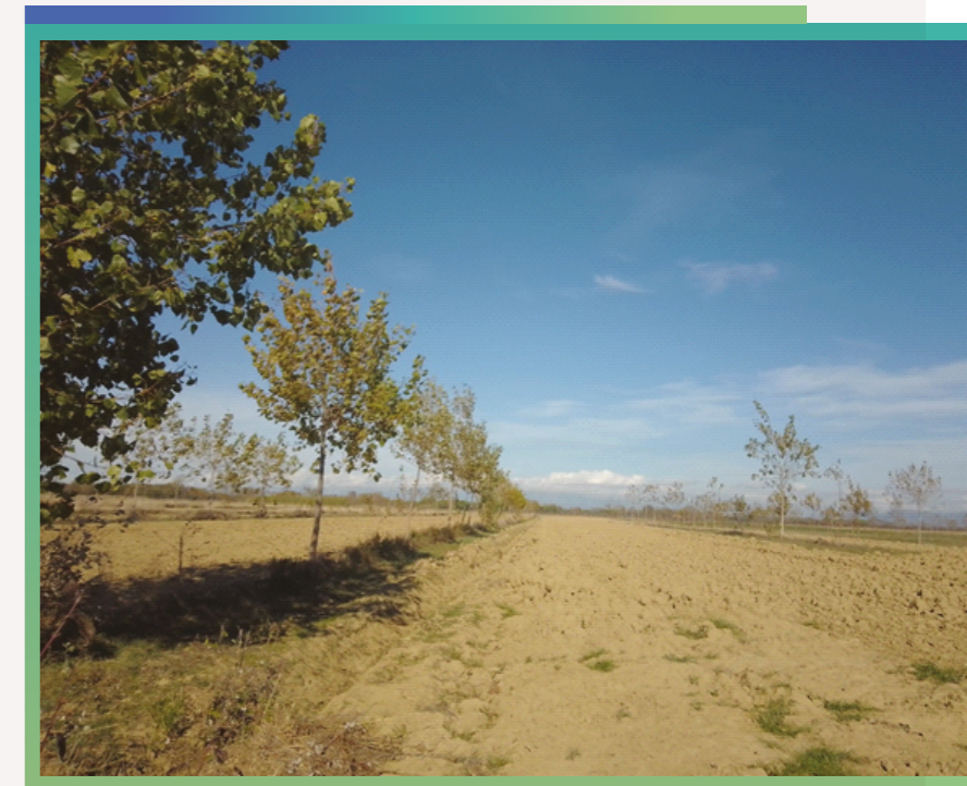
Agroleśnictwo z systemem rowów. Północne Włochy.