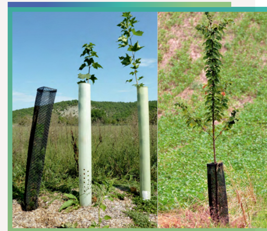
Osłonki sadzonek drzew w systemach alejowych.