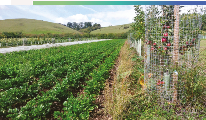
Drzewa owocowe w systemie rolno-leśnym gospodarstwa ekologicznego. Tolhurst Organics, Wielka Brytania.

Agroleśnictwo dostarcza pożytku i miejsc gniazdowania dla dzikich zapylaczy, co pociąga za sobą wzrost plonowania roślin owadopylnych. Jest to najlepiej widoczne w przypadku drzew owocowych, zwłaszcza wiśni (Kay i in. 2018). Należy zauważyć, że zadrzewienia i żywopłoty, znajdujące się na granicach pól mogą ochronić uprawy (szczególnie ekologiczne) przed pestycydami znoszonymi z sąsiednich terenów podczas zabiegów chemicznej ochrony roślin. Mogą również stanowić barierę dla szkodliwych owadów, transportowanych przez strumienie powietrza.