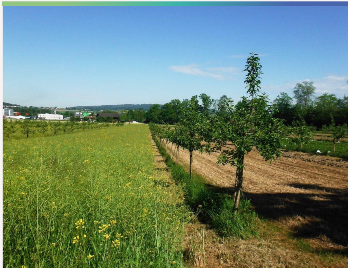
Uprawa drzew owocowych w systemie rolno-leśnym z uprawami polowymi.

Ściółka oraz korzenie drzew i krzewów są skutecznym filtrem zatrzymującym pochodzące z nawożenia składniki mineralne, które mogłyby zanieczyścić wody gruntowe. Badania wskazują, że wymycie związków azotu do wód jest w takich warunkach ograniczone o 40-70% (Nair 2011, Jose 2009). W ten sposób poprawia się efektywność wykorzystania makroelementów w agroekosystemach.