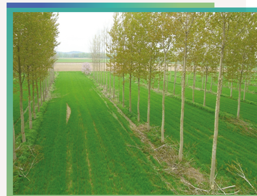
System rolno-leśny z topolami we Francji.