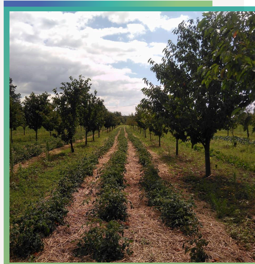
Uprawa współrzędna w sadzie.