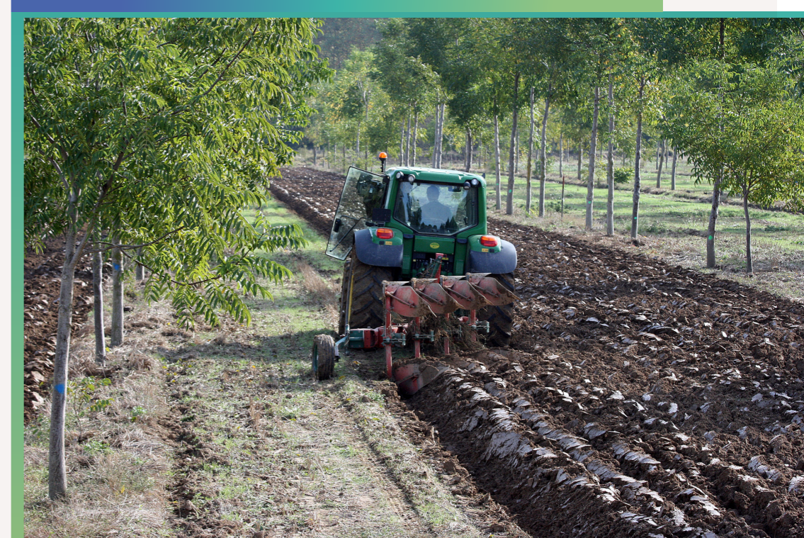
Opadające liście i gałązki z drzew w systemie rolno-leśnym mogą znacząco zwiększać zasobność gleby w składniki pokarmowe i ich dostępność dla korzeni roślin. Przycinanie korzeni drzew kształtuje odpowiednią ich strukturę, ograniczającą ich konkurencyjność dla roślin uprawnych.