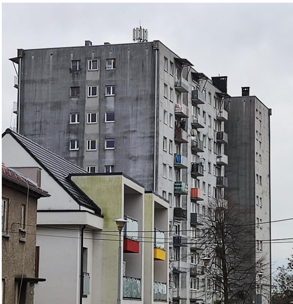
Fot. 1: Widoki anten stacji bazowej: ID: 2593, zlokalizowanej: ul. Zwycięstwa 2, Opole