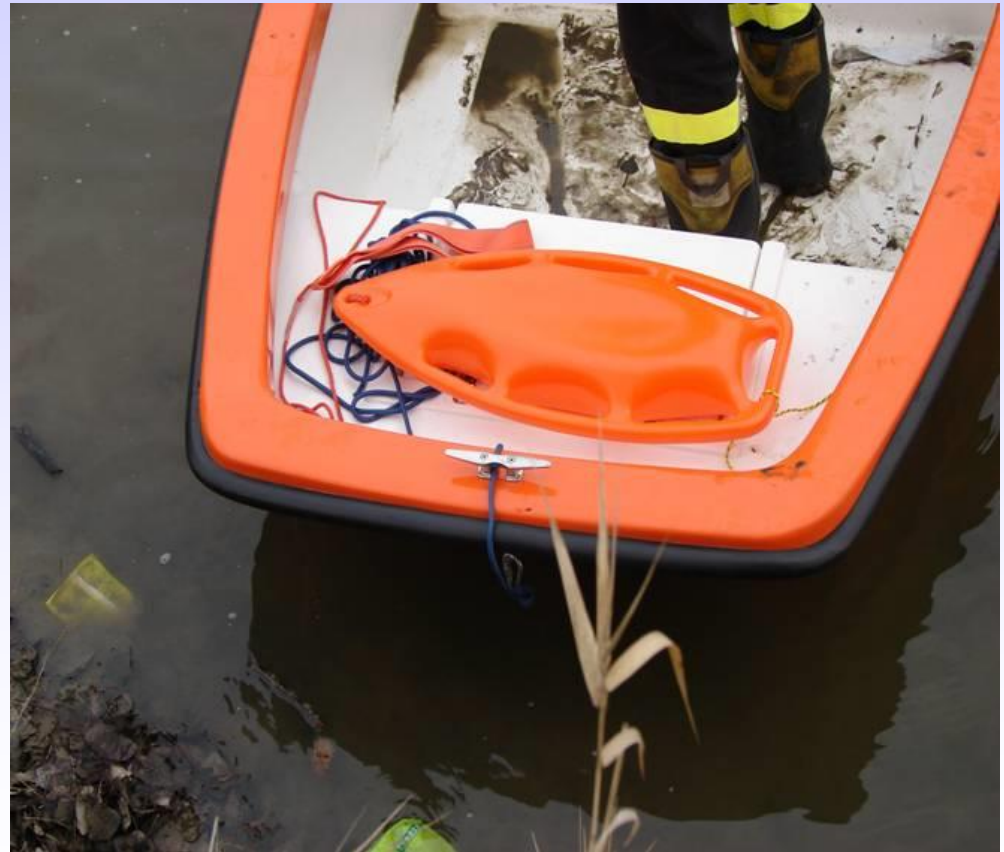
LINKA ASEKURACYJNA I BOJKA RATOWNICZA