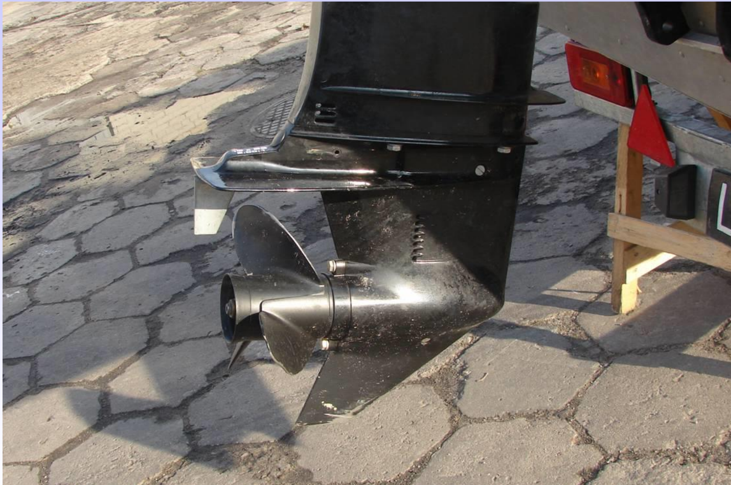
ŚRUBA NAPĘDOWA SILNIKA ZABURTOWEGO