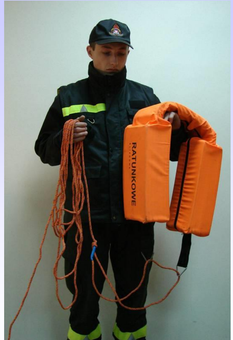
KOŁO RATUNKOWE KLASYCZNE I ŚLIZGOWE