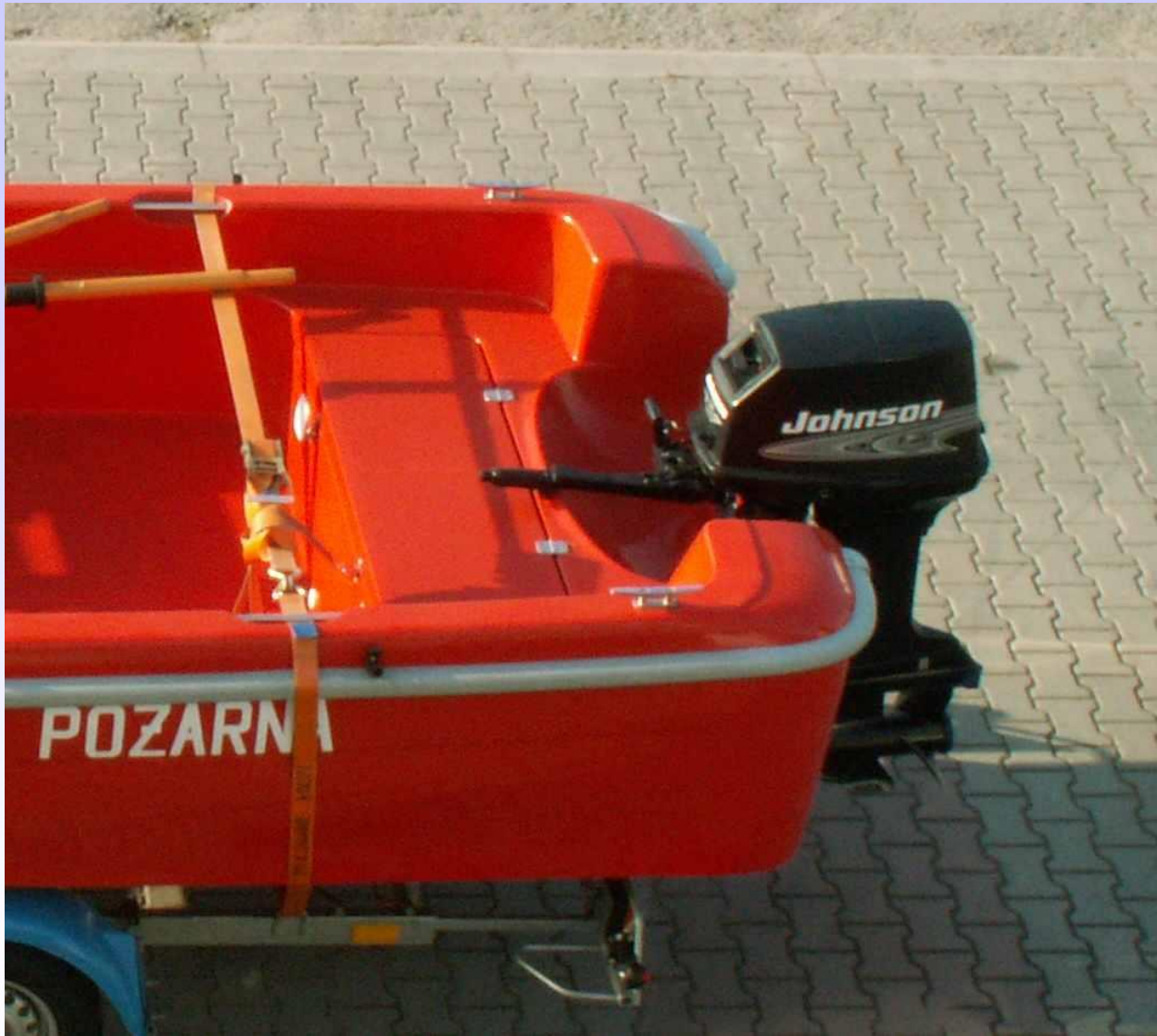
ŁÓDŹ RATOWNICZA KIEROWANA RUMPLEM