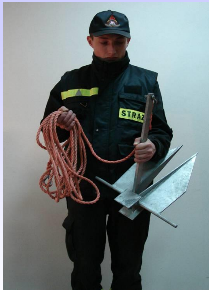
KOTWICA Z LINĄ