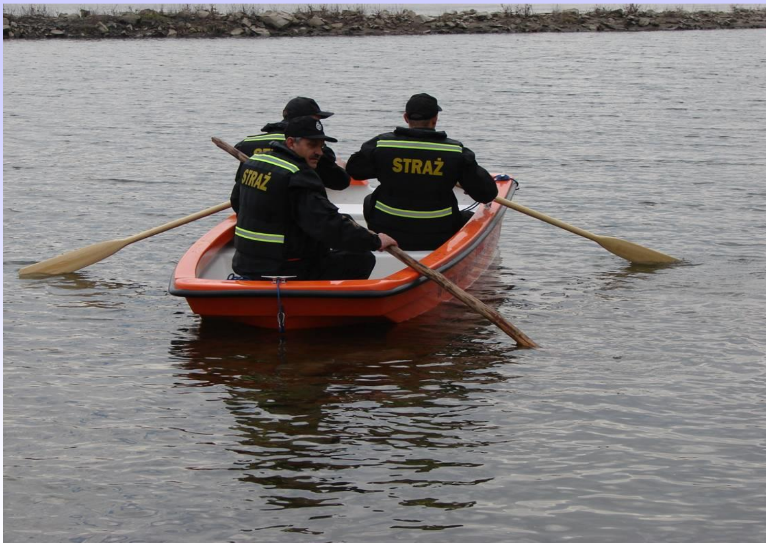
ŁÓDŹ RATOWNICZA Z NAPIĘDEM WIOSŁOWYM