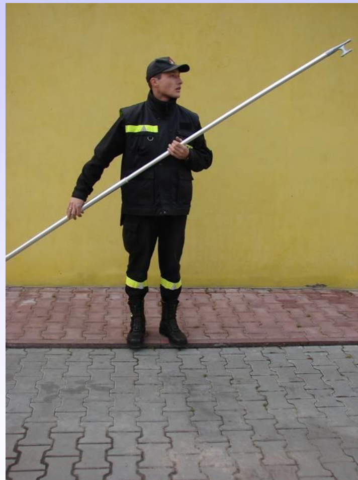
BOSAK ŁODZIOWY DREWNIANY I METALOWY