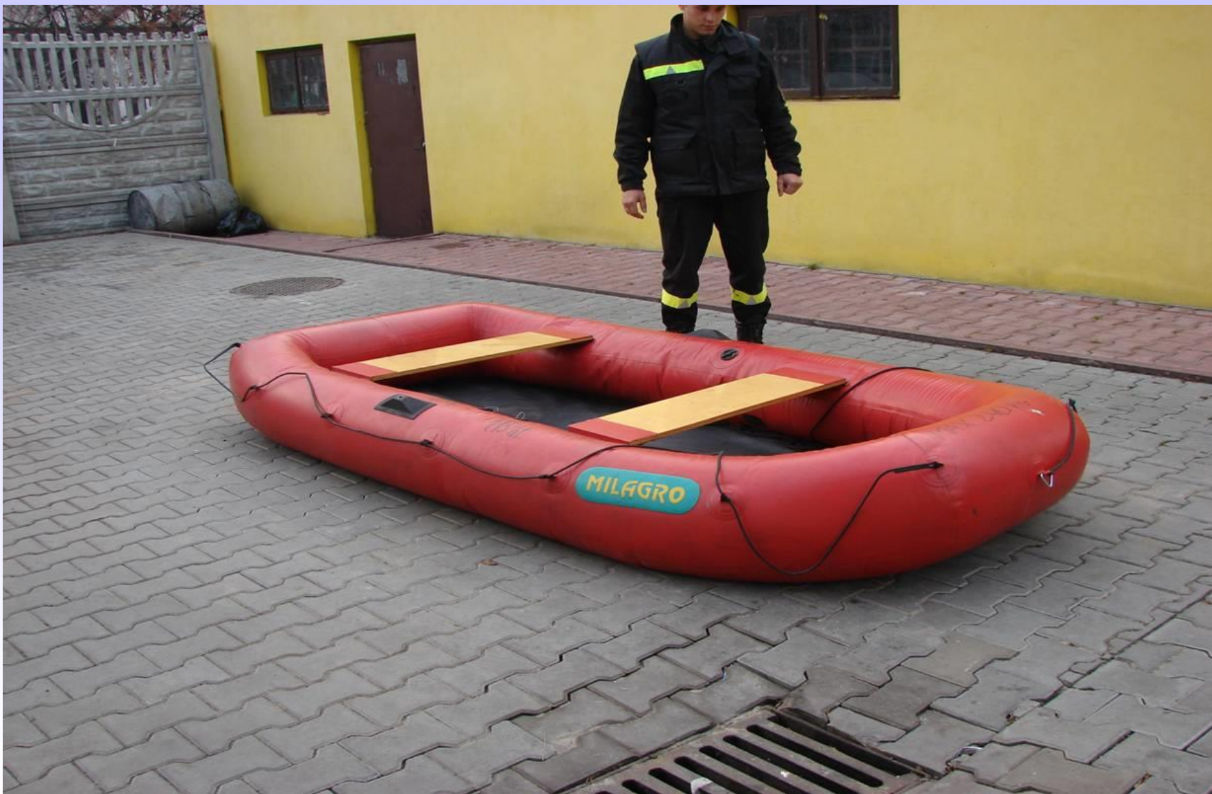
MAŁA PNEUMATYCZNA ŁÓDŹ RATOWNICZA