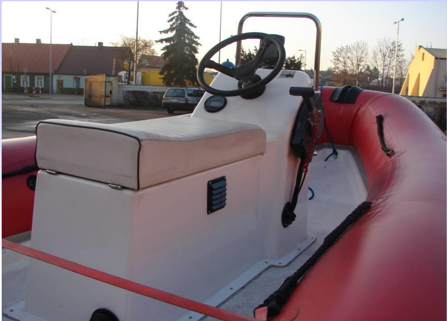
ŁÓDŹ KIEROWANA KOŁEM STEROWYM