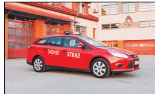
14. FORD FOCUS WAGON, SLOp, nr rej. RSA 15353, rok produkcji 2013