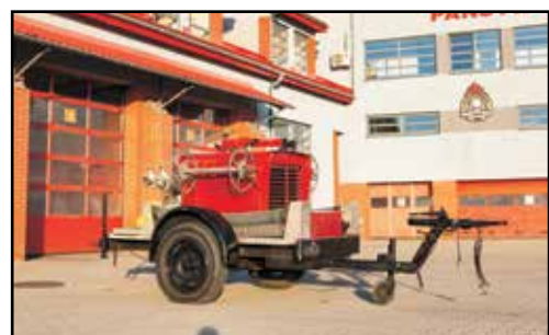
23. MOTOPOMPA ROSENBAUER 1/3,8, na przyczepie RH480, nr rej. KSX 6531