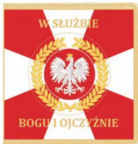
Wzór nowego sztandaru Komendy Powiatowej PSP w Sanoku planowanego do wręczenia w dniu 09.09.2022 r. podczas uroczystych obchodów 150 – lecia sanockiej straży pożarnej.

Niniejsza monografia powstała dzięki przychylności wielu osób jak i sponsorów.