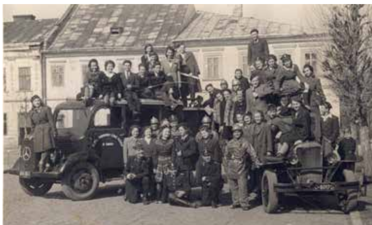
Strażacy i uczestniczki kursu przeciwpożarowego w Liceum Ekonomicznym w Sanoku około 1950 roku.