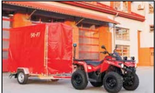
12. CAN-AM OUTLANDER BRP 450R, QUAD, nr rej. RSA TJ50, rok produkcji 2019 PRZYCZEPA TEMA, nr rej. RSA 1198P, rok produkcji 2021