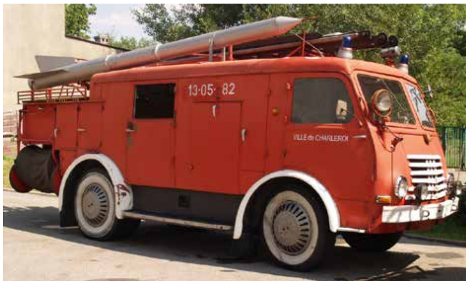
Samochód Star wyprodukowany w sanockiej fabryce, obecnie znajduje się w Centralnym Muzeum Pożarnictwa w Mysłowicach.