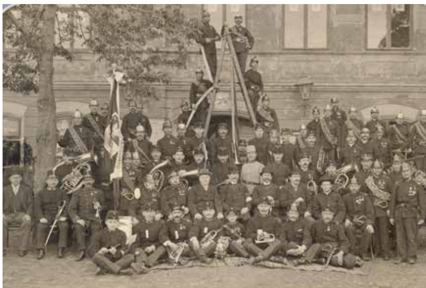
Sanoccy strażacy około 1910 roku.