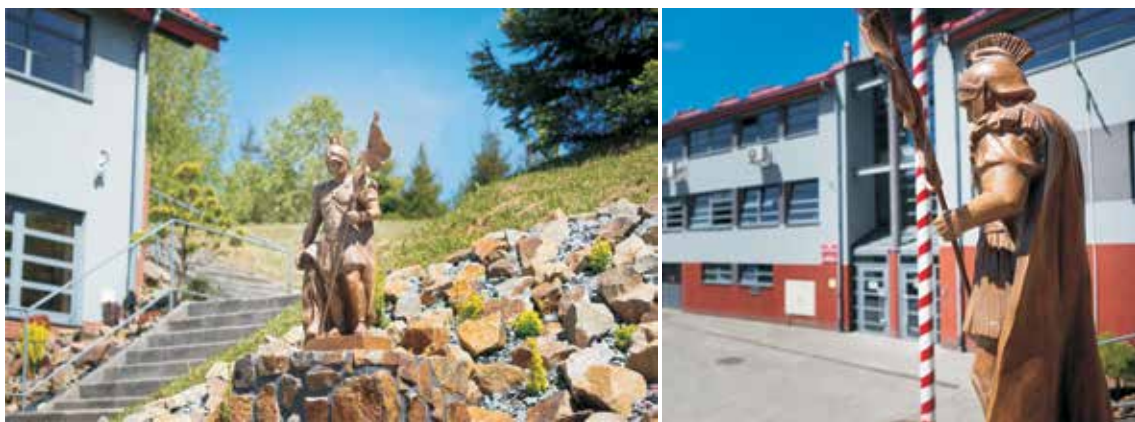
Figura św. Floriana przed wejściem głównym do budynku Komendy Powiatowej PSP w Sanoku.

Aktualny widok budynku Komendy Powiatowej PSP w Sanoku.