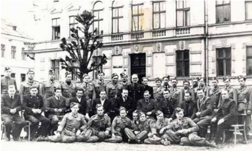
Strażacy i Junacy SP po szkoleniu przeciwpożarowym na Rynku w Sanoku w 1952 roku.