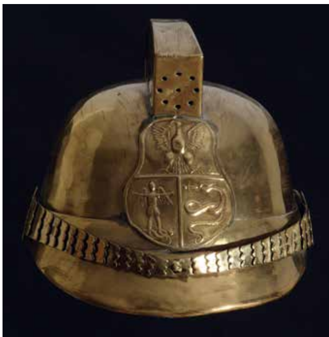
Hełm z herbem Sanoka z Pracowni Aleksandra Piecha ze zbiorów Muzeum Historycznego w Sanoku.

W 1979 roku Straż Pożarna nawiązała współpracę z Muzeum Budownictwa Ludowego w Sanoku. Wówczas wytypowano do przeniesienia na teren muzeum remizę z Lipinek. Strażacy włączyli się w prace, czyścili drewno i porządkowali budynek. Na urządzonej w remizie ekspozycji