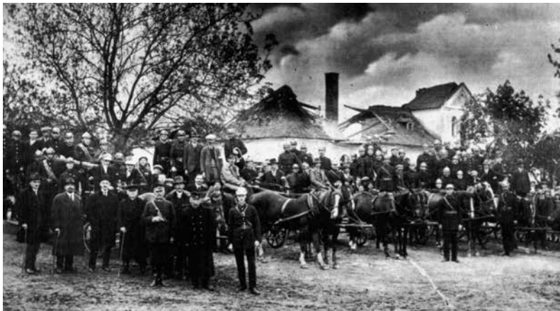
Jednostki Ochotniczych Straży Pożarnych z rejonu sanockiego po jednej z akcji około 1910 roku.

Po I wojnie światowej, kiedy naród odetchnął po latach niewoli, podjęto próby scale- nia ruchu strażackiego w Polsce. Pod koniec 1918 roku na ziemiach polskich istniało około 1600 Ochotniczych Straży Pożarnych. Różniły się między sobą stopniem wyszkolenia i wyposażenia oraz działały na podstawie różnego ustawodawstwa zaborczego. W dniach 8 – 9 września 1921 roku zorganizowano w Warszawie I Ogólnopolski Zjazd Delegatów Straży Pożarnych, na któ- rym utworzono Główny Związek Straży Pożarnych Rzeczypospolitej Polskiej. Wówczas Ochotnicza Straż Pożarna z Sanoka stała się częścią Związku Małopolskiego z siedzibą we Lwowie.