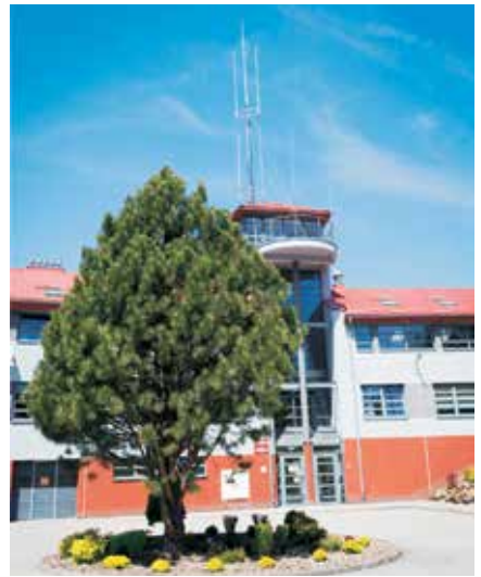
Widok na budynek Komendy Powiatowej PSP w Sanoku wraz z nowym masztem.