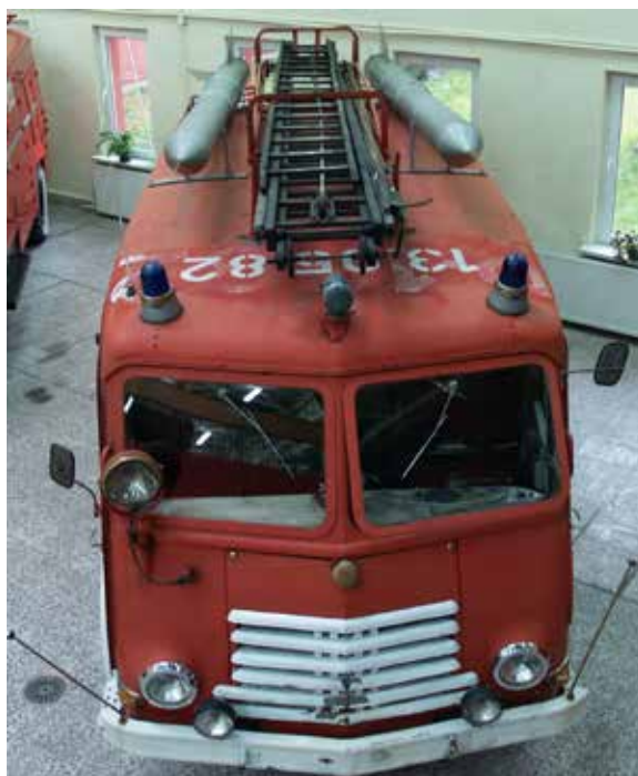
Samochód Star wyprodukowany w sanockiej fabryce, obecnie znajduje się w Centralnym Muzeum Pożarnictwa w Mysłowicach.

Lata 60. XX w. były trudne zarówno dla Autosanu jak i strażaków. W oddziale produkcji przyczep w Zastawiu pożar strawił magazyn opon samochodowych i halę produkcyjną przyczep samochodowych. Jakiś czas później częściowo zawalił się strop hali produkcyjnej autobusów w Sanoku. W 1968 roku Strażacy przez trzy dni walczyli z powodzią szalejącą na terenie miasta.