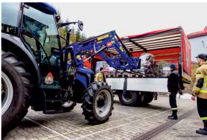
Ładunek sprzętu strażackiego na terenie KP PSP w Sanoku zebranego w pierwszych dniach konfliktu zbrojnego dla strażaków z Ukrainy.