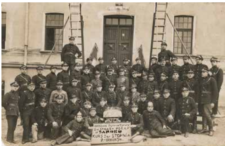
Kursanci kursu I stopnia zorganizowanego w 1934 roku przez Oddział Powiatowy Związku Straży Pożarnych w Sanoku.

W dniu 9 września 1939 roku Sanok został zajęty przez wojska niemieckie. Pogotowie Zawodowej Straży Pożarnej otrzymało rozkaz ewakuacji sprzętu na wschód. Strażacy udali się w kierunku Tarnopola, tam jednak sprzęt został zarekwirowany przez władze radzieckie, a uczestnicy ekspedycji powrócili do Sanoka. Okupacja nie przerwała działalności straży. Zarówno pogotowie zawodowe i Ochotnicza Straż Pożarna trwały na posterunku, chociaż z powodu mobilizacji w okrojonym składzie. Członkowie straży w każdy czwartek organizowali zbiorki oraz ćwiczenia sprawnościowe nad Sanem. Siedziba jednostki mieściła się w budynku magistratu. Strażacy dysponowali samochodem ciężarowym z platformą, na której przymocowano motopompę, węże łączniki i ławki dla strażaków. Ochotnicza Straż Pożarna w fabryce także kontynuowała pracę. Sanoccy strażacy zapisali swoją postawą piękną kartę w dziejach miasta i straży. Podjęli bowiem współpracę z ruchem oporu, strażę zapewniały schronienie przed wywózką na roboty do Niemiec. Strażacy z „Sanowagu” (Autosan) należący do obwodu „San” AK wykradali z remontowanych w fabryce czołgów niemieckich karabiny maszynowe, pistolety i amunicję. Działalność konspiracyjna wzbudziła podejrzenia u okupanta, co doprowadziło do aresztowań wielu działaczy strażackich. W 1941 roku komendant Ochotniczej Straży Pożarnej Miron Kuszczak został