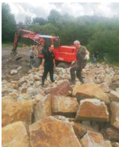
Wybór kamieni pod budowę.