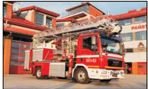
6. MAN TGL 12.240 4X2 BB, SHD-25, nr rej. RSA 20WS, rok produkcji 2009