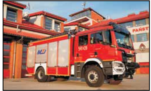
2. MAN TGM 18.320 4x4 BB, GCBA 5/42, nr rej. RSA 60998, rok produkcji 2022