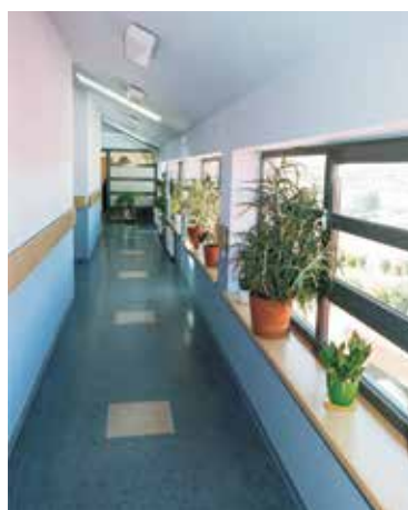
Widok wyremontowanego i pomalowanego korytarza na II piętrze.

W 2018 roku przeprowadzono remont pomieszczeń socjalnych w JRG PSP.