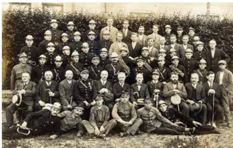
Ochotnicza Straż Pożarna z Sanoka i „Sanowagu” po wspólnych ćwiczeniach w 1928 roku.