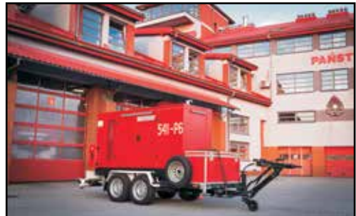
20. AGREGAT PRZEWOŻNY GPW 100DZ, PEX-POL PLUS, nr rej. 1848P, rok produkcji 2015