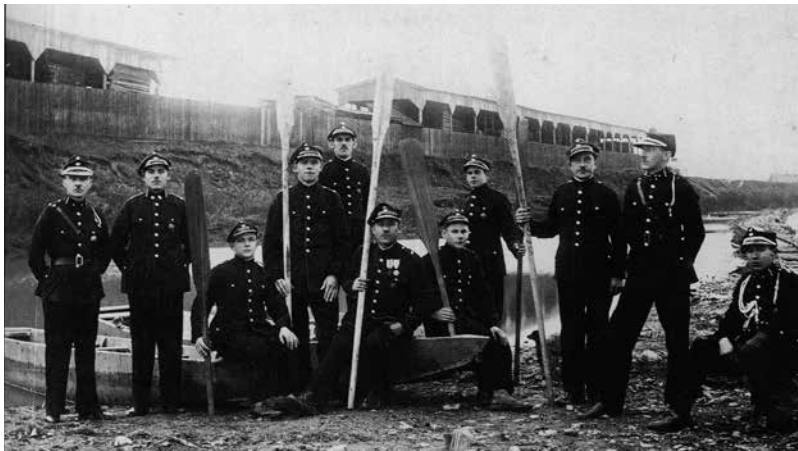
Sekcja wioślarska Ochotniczej Straży Pożarnej Fabryki Wagonów i Maszyn w Sanoku 1929 rok.