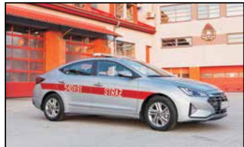
16. HYUNDAI ELANTRA, SLOp, nr rej. RSA 53998, rok produkcji 2020