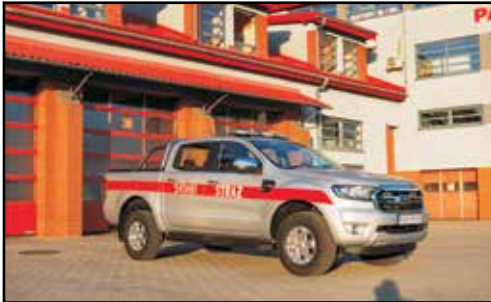
11. FORD RANGER, SLKw, nr rej. RSA 59998, rok produkcji 2021