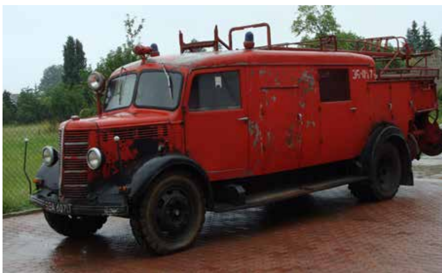
Samochód pożarniczy GM-8 Bedford wyprodukowany w Sanoku 1951 roku, obecnie w zbiorach Muzeum Pożarnictwa w Kotuniu.