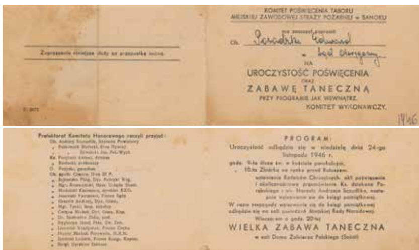
Zaproszenie na uroczysty jubileusz z 1946 r.

W dniu 24 listopada 1946 roku w Sanoku odbyła się uroczystość poświęcenia taboru Miejskiej Zawodowej Straży Pożarnej. Organizacją imprezy zajął się powołany na tę okoliczność komitet, nad którym patronat przyjęły osoby świeckie i duchowne, ludzie piastujący ważne urzędy w mieście. Pod koniec lat 40. XX w. sanocka Zawodowa Straż Pożarna dysponowała samochodami przystosowanymi do potrzeb strażaków: Mercedesem i Gazem AA.