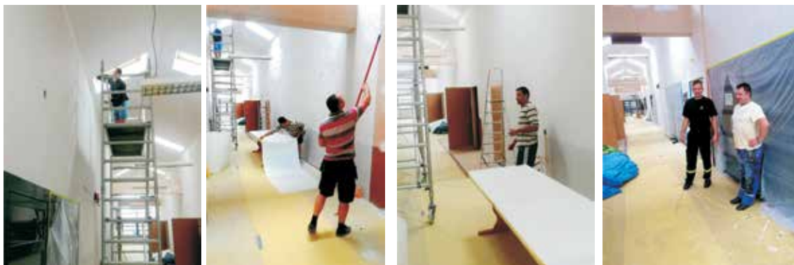
Remont korytarza JRG.

W 2020 roku przeprowadzono remont korytarza i klatki schodowej JRG PSP w Sanoku.