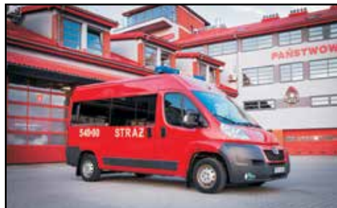
13. PEUGEOT BOXER 333 L2H2, SLBus, nr rej. RSA 10490, rok produkcji 2012