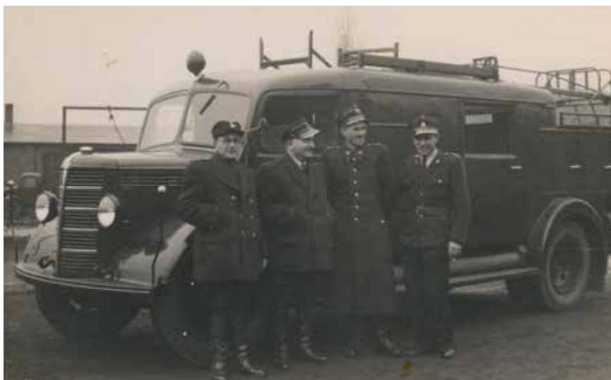
Samochód Bedford wyprodukowany w „Sanowagu” w 1951 roku.

wieloma nazwami) z bogatymi tradycjami pożarniczymi. Na początku XX wieku fabryka sanocka produkowała sikawki ogniowe, a po II wojnie światowej powrócono do tradycji. Pierwsze polskie powojenne samochody pożarnicze N 70 na podwoziu Bedford zjechały z taśmy ówczesnego Sanowagu. W 1951 wyprodukowano w Sanoku 152 samochody N 70. W kolejnym roku rozpoczęto produkcję samochodów N 71 na podwoziach Star A20 (GM-8). Równocześnie w latach 1952-1955 produkowano auta N72 (GA-16), autocysterny pożarnicze N75 (SBA), a także wózki P81 do przewożenia pomp. W okresie 1952-1958 wytwórnia sanocka wykonała 2014 samochodów pożarniczych i 2928 wózków P81.