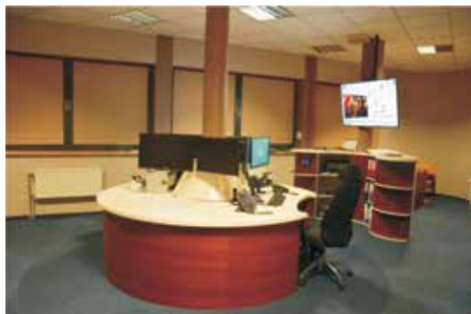
Stanowisko Kierowania po modernizacji.

W ramach remontów bieżących zostały odnowione i pomalowane pomieszczenia poszczególnych wydziałów Komendy i korytarze, dokonano zakupu rolet na okna i wymianę zużytych wykładzin dywanowych.