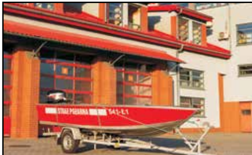
19. ŁÓDŹ MARINE 16V, płaskodenna, z silnikiem MERKURY 40 KM, na przyczepie podłodziowej ZEPPIA S.CYMERMAN, nr rej. 0998P, rok produkcji 2006