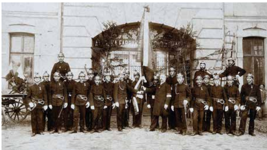
Ochotnicza Straż Pożarna Fabryki Wagonów i Maszyn w Sanoku 1905 rok.

Nie tylko pożary zakłócały życie miasta, również niespokojne wody Sanu dawały się we znaki mieszkańcom. Przeważnie były to podtopienia nie stwarzające wielkiego zagrożenia i dużych szkód. Zdarzało się jednak, że żywioł nie oszczędzał ludzkich siedlisk i dobytku, atakując szczególnie Posadę Olchowską. Strażacy zawsze ruszali na pomoc, często z narażeniem własnego życia. W związku z tym w ramach zakładowej straży pożarnej późniejszego Autosanu utworzono prężnie działającą sekcję wioślarską. Jedną z większych i gwałtownych powodzi odnotowano w 1908 rok, kiedy to pod wodą znalazły się całe Błonia i Posada Olchowska. Strażacy stanęli wówczas na wysokości zadania, ratowali ludzi i dobytek przy użyciu łodzi i zbijanych przez siebie tratw.