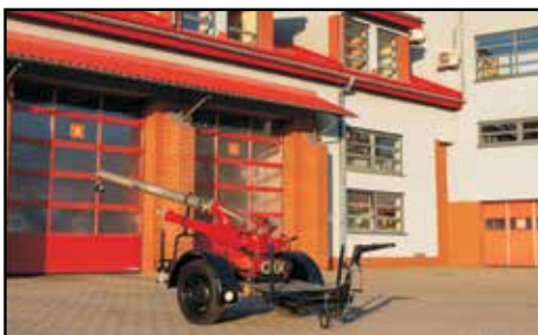
22. DZIAŁKO WODNO-PIANOWE DWP-2400, na przyczepie MW/A, nr rej. KSX 7036