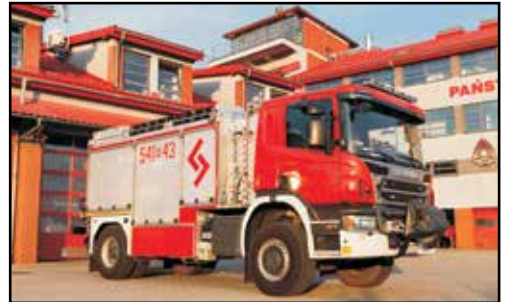
4. SCANIA P370 4X4, SRT, nr rej. RZ 3024U, rok produkcji 2018