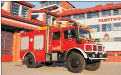
5. MERCEDES UNIMOG U500, GBA 2,5/25, nr rej. 49905, rok produkcji 2010