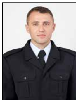
st. str. Bartłomiej Daniło