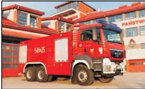
3. MAN TGS 26.440 6x6 BB, GCBA 9,5/65, nr rej. RSA 01830, rok produkcji 2010