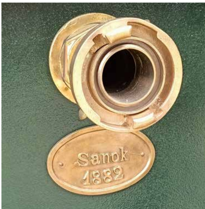
Emblemat na skrzyni wodnej sanockiej sikawki.

Mroki historii kryją w sobie wiele tajemnic, czekających jeszcze na wyjaśnienie. Trzeba mieć nadzieję, że czas, chociaż z każdym dniem oddala nas od przeszłości, okaże się jednak łaskawy i pozwoli odkryć, przynajmniej niektóre karty strażackich losów w Grodzie Grzegorza.