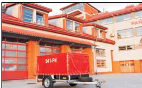
21. PRZYCZEPA STIM S11, nr rej. RSA PP81, rok produkcji 2014