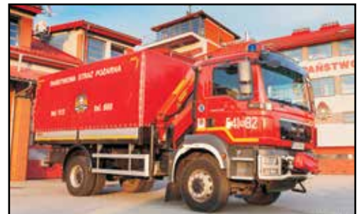
8. MAN TGM 18.290 4X4 BB, SCKw, nr rej. RSA 05420, rok produkcji 2011