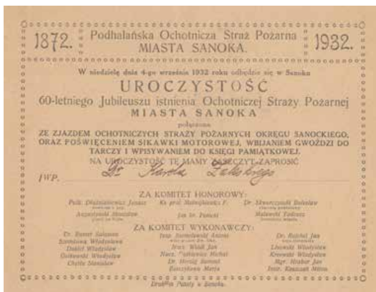
Zaproszenie na uroczysty jubileusz z 1932 r.