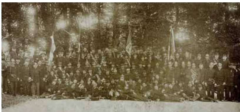
XI Zjazd Krajowego Związku Ochotniczych Straży Pożarnych w Sanoku 1904 roku.