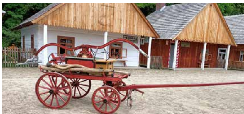
Sikawka z Posady Jaćmierskiej wykonana przez Sanocką Fabrykę Wagonów i Maszyn.