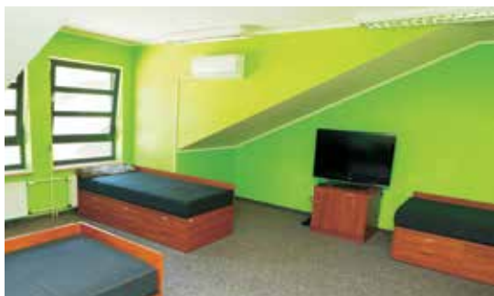
Widok wyremontowanego pomieszczenia socjalnego.

W 2018 roku przeprowadzono remont pomieszczeń socjalnych w JRG PSP.