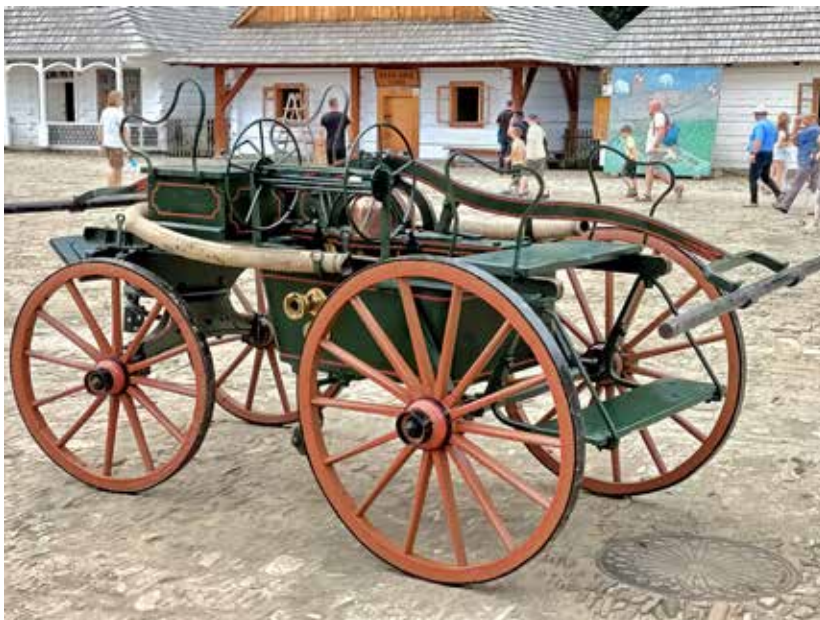
Sikawka konna wyprodukowana w Lipsku ze zbiorów Muzeum Budownictwa Ludowego w Sanoku.