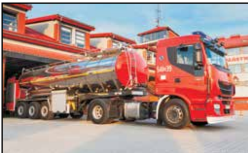
7. CIĄGNIK SIODŁOWY IVECO STRALIS 460, GCBM 25/16, nr rej. RSA 56662 /