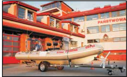
18. ŁÓDŹ LOMAC CLUB 580, RIB, z silnikiem YAMAHA 100 KM, na przyczepie podłodziowej BRENDERUP A05, nr rej. 1575P, rok produkcji 2020