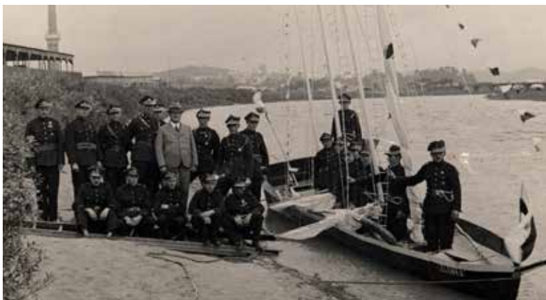
Strażacy z Ochotniczej Straży Pożarnej Fabryki Wagonów i Maszyn w Sanoku przy „Elemce” w 1930 rok.