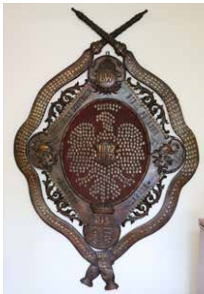
Pamiątkowa płaskorzeźba z 1932 r.

m. in znalazła miejsce wspomniana już tarcza pamiątkowa z jubileuszu 60 - lecia Podhalańskiej Straży Pożarnej oraz sztandar z drzewcem. Obecnie sztandar znajduje się w Centralnym Muzeum Pożarnictwa w Mysłowicach. Płaskorzeźba natomiast zdobi czołową ścianę gabinetu komendanta powiatowego PSP w Sanoku świadcząc dumnie o długiej i pięknej historii sanockiej straży. Nazwiska, nazwy jednostek i organizacji wygrawerowane na pamiątkowych gwoździach nie pozwolą zapomnieć o ludziach oddanych pożarnictwu, ziemi sanockiej i jej mieszkańcom.