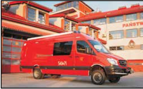
9. MERCEDES BENZ SPRINTER4X4, SLRw, nr rej. RSA 56661, rok produkcji 2015