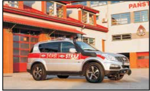
10. SSANGYONG REXTON, SLRr, nr rej. RSA 54323, rok produkcji 2015