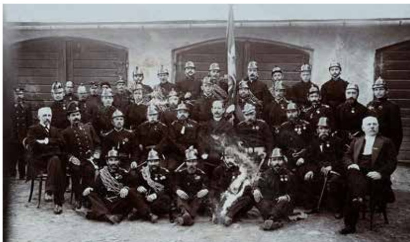
Jedno z pierwszych zdjęć sanockiej straży ochotniczej wykonane w 1907 roku przy okazji uroczystości „Świętego Floriana”.

Strażacka służba to nie tylko walka z żywiołem, szkolenia i ćwiczenia, zdarzają się też okazje do świętowania. Tygodnik Ziemi Sanockiej nr 20 z dnia 11.09.1910 roku donosił: „Straż ochot. Pożarna w Sanoku obchodziła w przeszłą niedzielę uroczystość poświęcenia nowego sztandaru.” Z powodu ulewnego deszczu po mszy św. uroczystość odbyła się w Sali „Sokoła”. „Kumami” zostało kilkanaście znamienitych osób. Były odznaczenia i wbijanie gwoździ do drzewca oraz przemówienia i podziękowania, a także poczęstunek. Uroczystość zakończył głos strażackiej trąbki, który stał się sygnałem do wymarszu dla strażackiej braci.