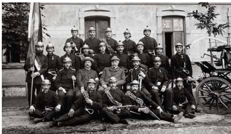
Ochotnicza Straż Pożarna Fabryki Wagonów i Maszyn w Sanoku 1907 rok.