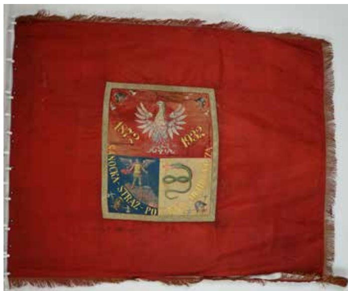
Sztandar Podhalańskiej Ochotniczej Straży Pożarnej z Sanoka z 1932 roku. Obecnie w zbiorach Centralnego Muzeum Pożarnictwa w Mysłowicach.

W zbiorach Muzeum Budownictwa Ludowego w Sanoku znajduje się odrestaurowana w 2021 roku sikawka konna firmy „G.A. Jauck” z Lipska. Nie wiadomo, kiedy i w jaki sposób trafiła do muzeum. Lata, które przestała w magazynie trzeba liczyć w dekadach. Stan wozu pozostawiał wiele do życzenia, jedno z kół zachowało się w formie szczątkowej, skrzynia wodna, jak i pozostałe elementy, pokryte były rdzą. Uszkodzenia pozwalały przypuszczać, że sikawka uległa wypadkowi. Dziś nikt nie jest w stanie odpowiedzieć na pytanie, czy destrukcja to następstwo nieostrożnego użytkowania, gdy sikawka nie wyjeżdżała już do akcji, czy przeciwnie? Niewykluczone, że uległa wypadkowi pędząc na pomoc, wzywana głosem strażackiej trąbki. Pewne jest jednak to, że wóz należał do sanockiej straży. Emblemat umieszczony na skrzyni wodnej niezbitcie dowodzi, że sikawka była pojazdem sanockim. Widnieje na nim napis „Sanok 1882”. Po przeciwległej stronie skrzyni umieszczono napis „G.A.Jauck Leipzig Patent N° 4764”. Chciałoby się wierzyć, że wóz zakupiono z okazji 10. rocznicy istnienia zawodowej straży w Sanoku, ale to tylko spekulacje.