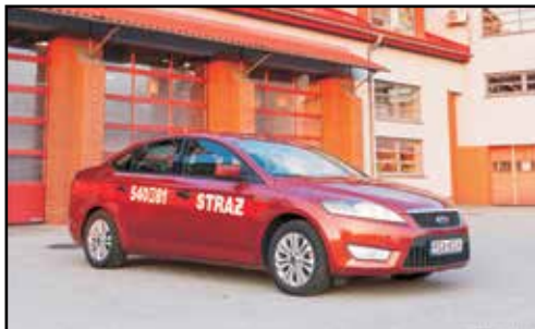
15. FORD MONDEO, SLOp, nr rej. RSA 80UK, rok produkcji 2008