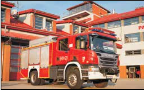
1. SCANIA P360 4x4, GBA 2,5/30, nr rej. RSA 54324, rok produkcji 2015