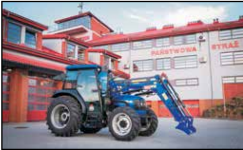
17. SOLIS 60C, SAMOBIĘŻNY CIĄGNIK, nr rej. RSA TC88, rok produkcji 2017