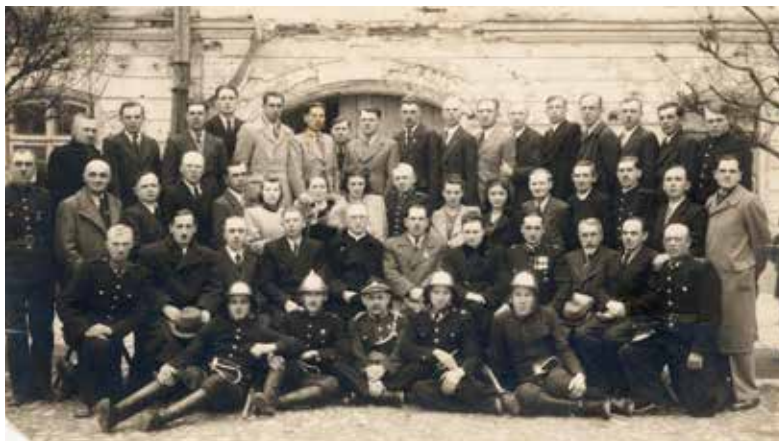
Sanocky strażacy w 1948 roku.

Przemysłowa Straż Pożarna Fabryki Wagonów w Sanoku w 1948 roku otrzymała na wyposażenie motopompę „zerówkę” oraz samochód pożarniczy Bedford. W tym samym roku zorganizowano w fabryce kurs podstawowy I stopnia dla szeregowców. Później szkolenia kontynuowano w Wojewódzkiej Szkole Pożarniczej w Jarosławiu, w Wojewódzkim Ośrodku Wyszczolenia Pożarniczego w Krakowie i w Nysie.