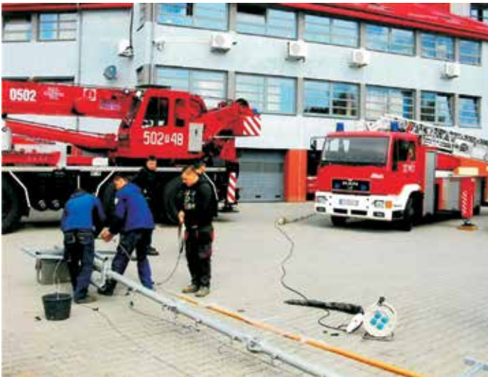
Prace podczas wymiany masztu i anten radiowych.

W kwietniu 2014 roku została przeprowadzona modernizacja masztu antenowego systemu łączności radiowej na dachu budynku Komendy Powiatowej PSP w Sanoku.