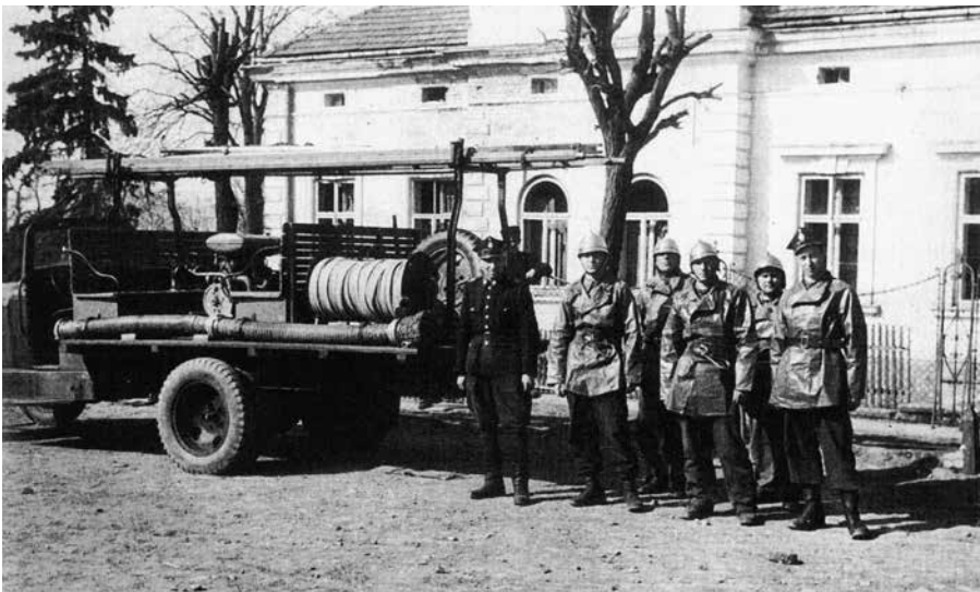
I zmiana Pogotowia Zawodowego sanockiej Straży Pożarnej po ćwiczeniach w Gimnazjum Żeńskim lata 50. XX wieku.