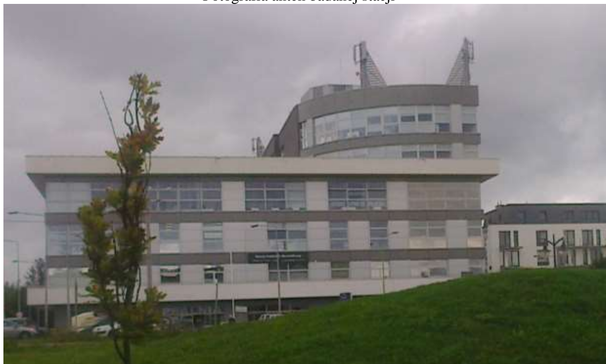
Fot. 1: Widoki anten stacji bazowej ID: BT41480, zlokalizowanej: ul. Jabłoniowa 20, 80-175 Gdańsk