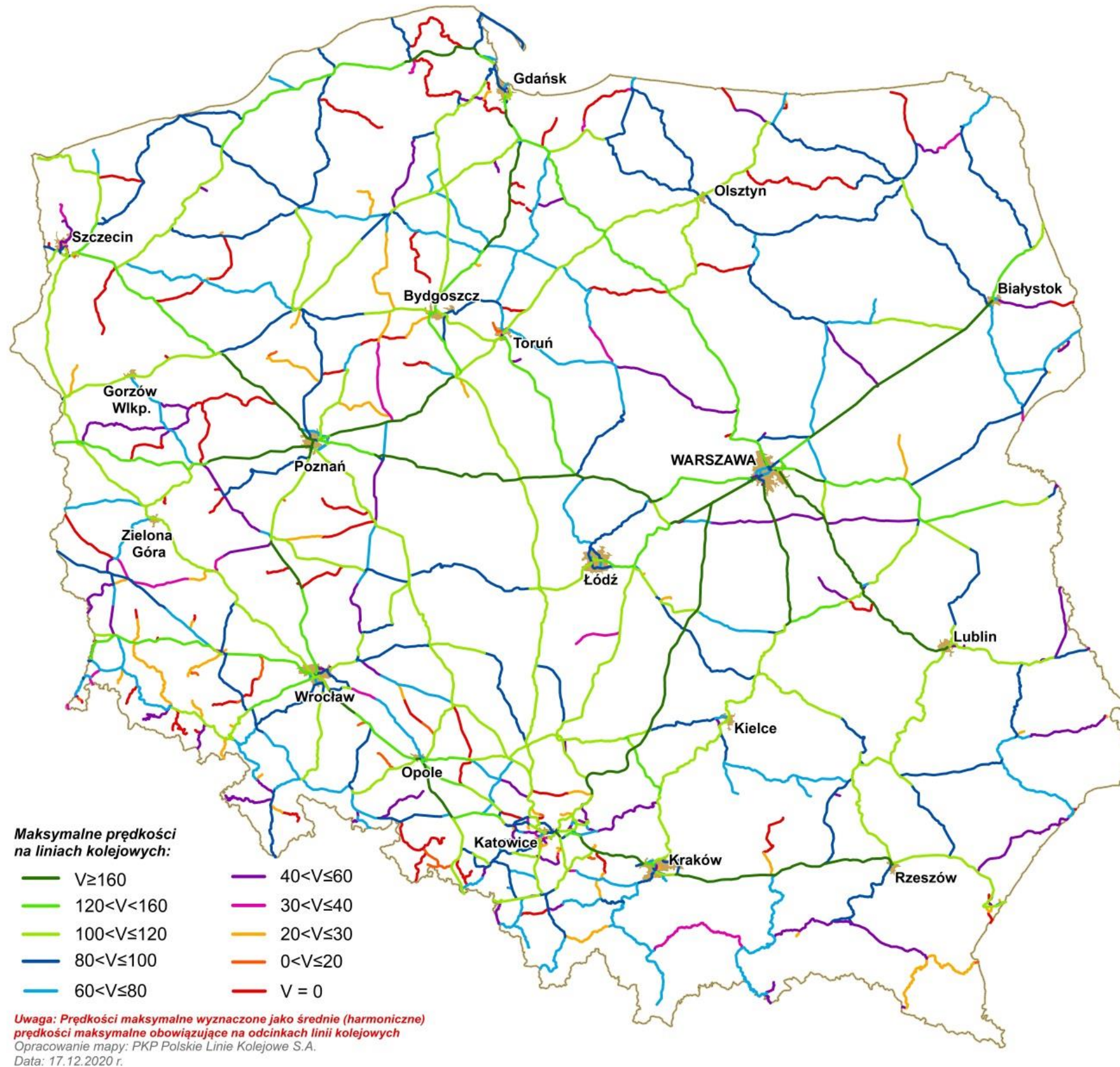
Mapa 2 – Prędkości maksymalne na liniach/odcinkach sieci kolejowej zarządzanej przez PKP PLK S.A. – prognoza na 31.12.2023 r.