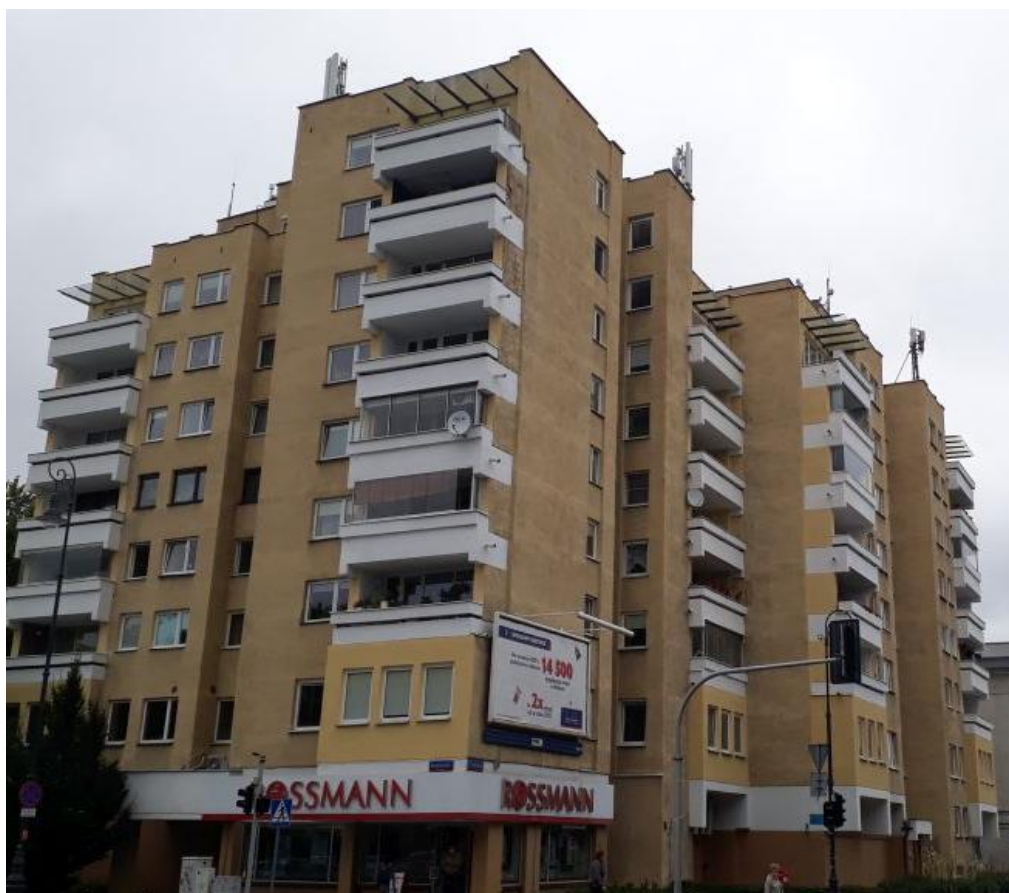
Fot. 1a: Widok anten stacji bazowych: ID: 20250 (81412N!), ID: WAR1277A, zlokalizowanych pod adresem: ul. Świętojerska 16, 00-202 Warszawa.