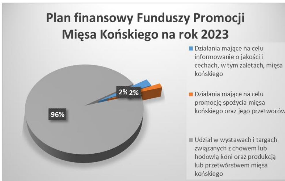
Wykres nr 3. Struktura Planu finansowego FPMK na 2023 rok

W Planie Finansowym Funduszu Promocji Mięsa Końskiego na rok 2023 na zadania zgodne z celami Funduszu Promocji Mięsa Końskiego przeznaczono kwotę 155 467,50 PLN . Komisja Zarządzająca Funduszu Promocji Mięsa Końskiego uchwaliła Plan finansowy Funduszu Promocji Mięsa Końskiego na rok 2023 uchwałą nr 4/2022 z dnia 14.11.2022 r., a następnie zmieniała Plan finansowy Funduszu Promocji Mięsa Końskiego na rok 2023 uchwałą nr 1/2023 z dnia 27.04.2023 r., uchwałą nr 2/2023 z dnia 15.06.2023 r. oraz uchwałą nr 4/2023 z dnia 20.10.2023 r.