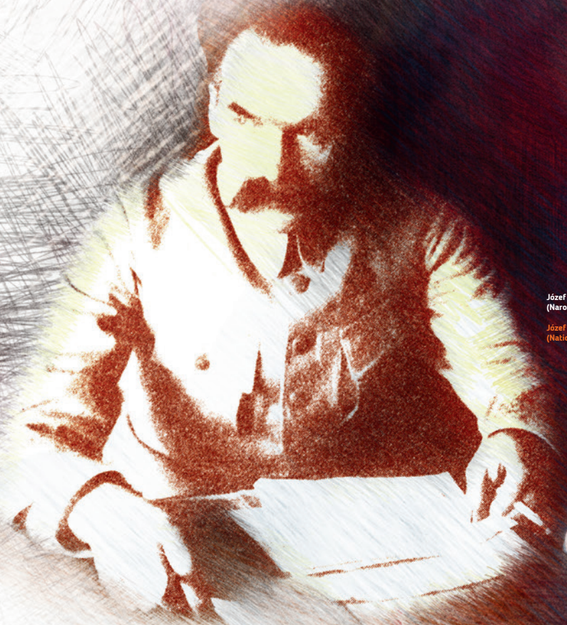
Józef Piłsudski w Belwederze, ok. 1920 r. Józef Piłsudski at the Belweder, circa. 1920.