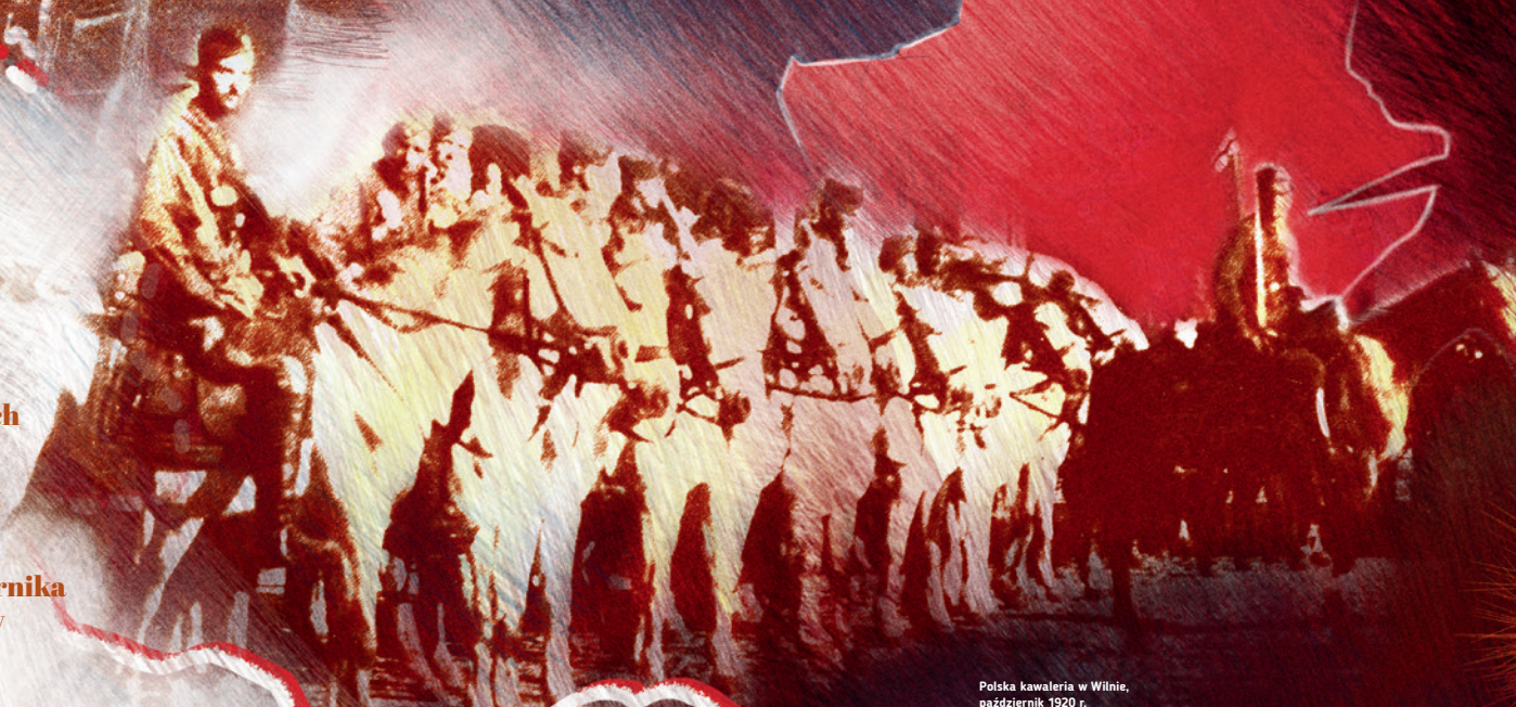
Polska kawaleria w Wilnie, październik 1920 r.

The victory in the battle of Warsaw granted new energy for the Poles. In the last days of August, they managed to stop the advance of Budyonny's 1st Cavalry Army, followed by a decisive victory over it in a great cavalry clash near Komarowo. 20 September saw the start of the battle on the Niemen River, as a result of which Poles once again defeated Tukhachevsky's forces. These successes led to the occupation of Volhynia and Belarus, and on 8 October, troops led by General Lucjan Żeligowski managed to capture Vilnius from the Lithuanians under the guise of a rebellion.