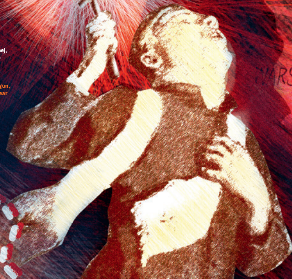
Śmierć księdza Ignacego Skorupki, reprodukcja obrazu Romana Bratkowskiego (Centralna Biblioteka Wojskowa)