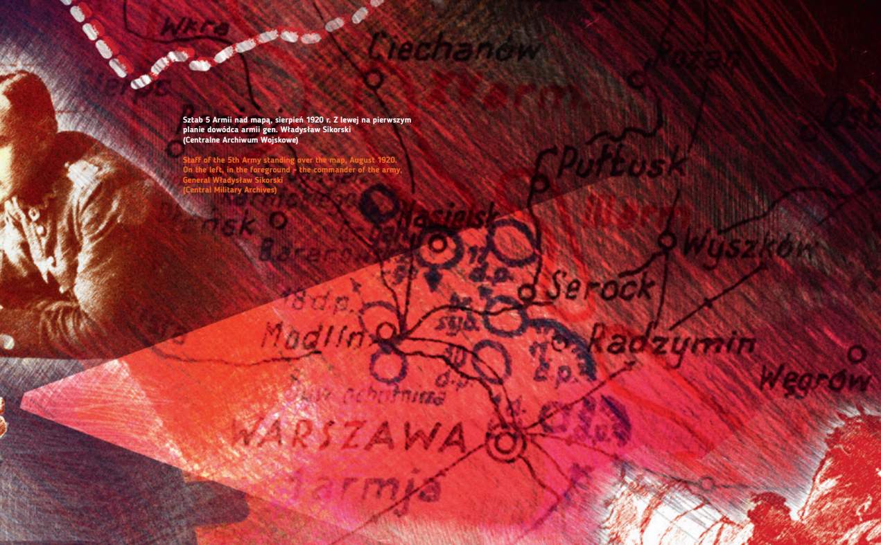
Staff of the 5th Army standing over the map, August 1920. On the left, in the foreground - the commander of the army, General Władysław Sikorski