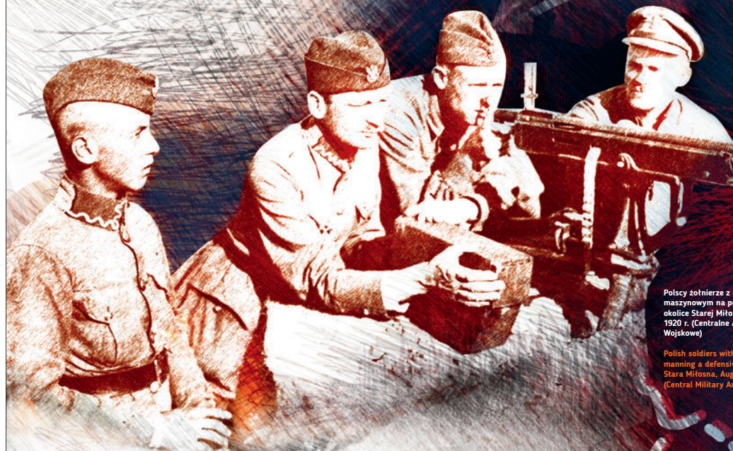
Polscy żołnierze z karabinem maszynowym na pozycji obronnej, okolice Starej Miłoszy, sierpień 1920 r.