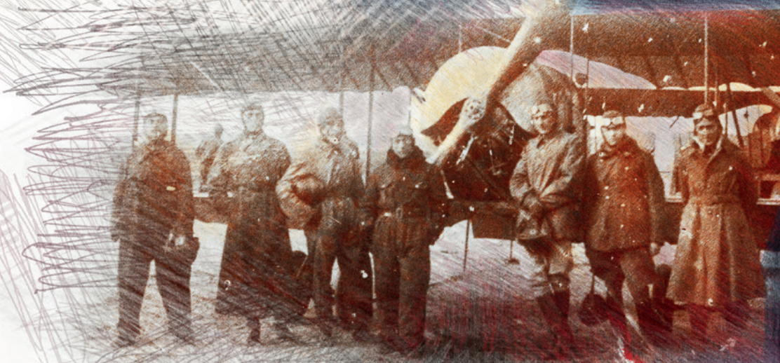
Grupa polskich pilotów w pobliżu francuskiego samolotu Caudron G.III, 1920 r. (Centralne Archiwum Wojskowe) Group of Polish pilots near the French Caudron G.III plane, 1920. (Central Military Archives)