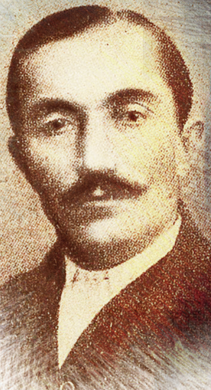
Wincenty Witos, działacz ruchu ludowego, premier Rządu Obrony Narodowej, ok. 1920 r.