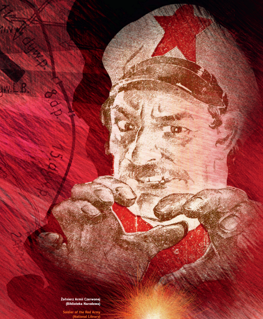
Żołnierz Armii Czerwonej (Biblioteka Narodowa) Soldier of the Red Army (National Library)