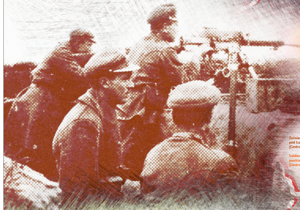
Żołnierze 35 Pułku Piechoty na pozycji pod Lunińcem na Polesiu, lipiec 1919 r.