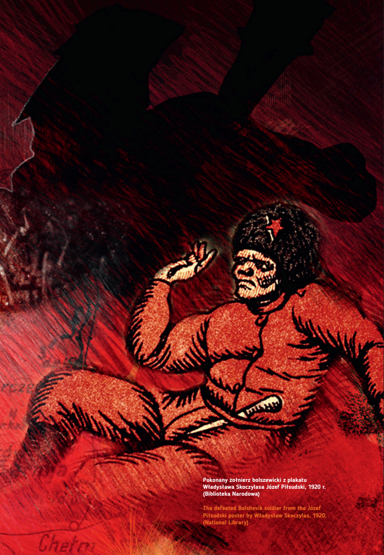
Poranny żołnierz bolszewicki z plakatu Władysława Skoczylasa Józef Piłsudski, 1920 r. The defeated Bolshevik soldier from the Józef Piłsudski poster by Władysław Skoczylas, 1920.