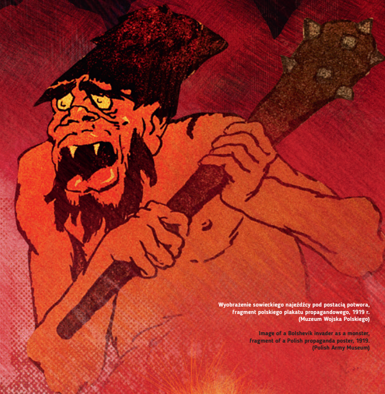
Wyobrażenie sowieckiego najeźdźcy pod postacią potwora, fragment polskiego plakatu propagandowego, 1919 r. (Muzeum Wojska Polskiego)