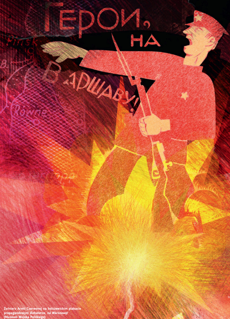
Żołnierz Armii Czerwonej na bolszewickim plakacie propagandowym Bohaterze, na Warszawę! (Muzeum Wojska Polskiego) Soldier of the Red Army on the Hero, to Warsaw! Bolshevik propaganda poster. (Polish Army Museum)