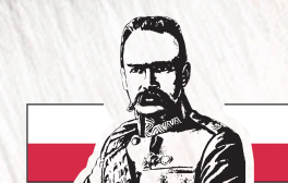
Semyon Budyonny, commander of the Bolshevik 1st Cavalry Army