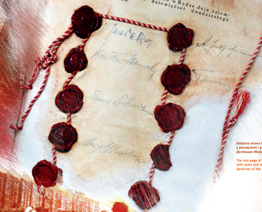
Ostatnia strona traktatu ryskiego z pieczęciami i podpisami stron (Archiwum Ministerstwa Spraw Zagranicznych)

Wymiana dokumentów ratyfikacyjnych nastąpiła w Mińsku w terminie czterdziestu pięciu dni od dnia podpisania Traktatu niniejszego. Wszędzie, gdzie w Traktacie niniejszym lub w jego załącznikach wymienią się jako termin chwilę ratyfikacji Traktatu Pokojowego, rozumie się przez to chwilę wymiany dokumentów ratyfikacyjnych. Na dowód czego pełnomocnicy obu układających się stron własnoręcznie podpisali Traktat niniejszy i opatrzili go swymi pieczęciami. Sporządzono i podpisano w Rydze dnia osiemnastego marca tysiąc dziewięćset dwudziestego pierwszego roku.