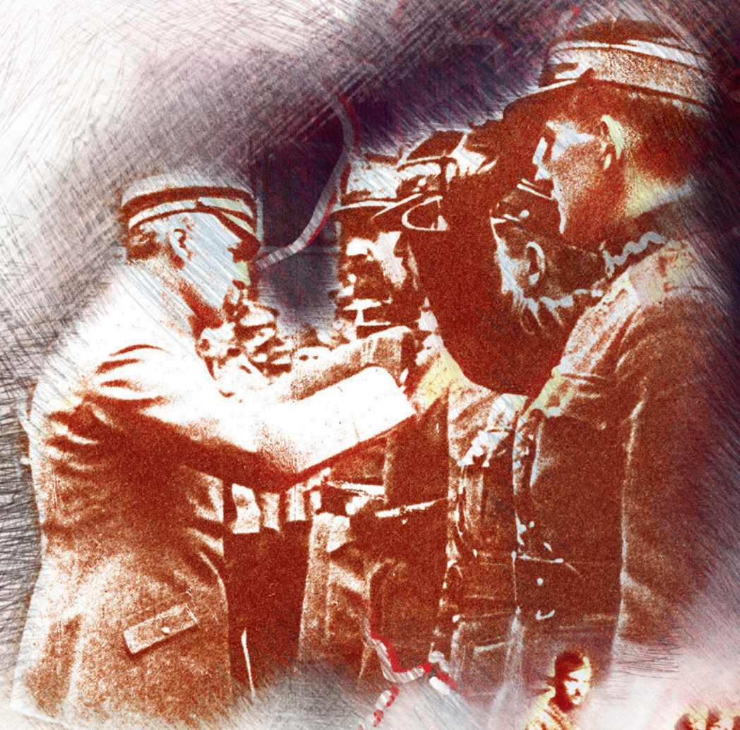
Marszałek Józef Piłsudski odznacza oficerów (m.in. generała Tadeusza Rozwadowskiego) Orderem Wojskowym Virtuti Militari V klasy, Warszawa, 14 września 1920 r.