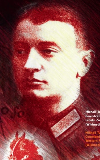
Mikhail Tukhachevsky, dowódca bolszewickiego Frontu Zachodniego