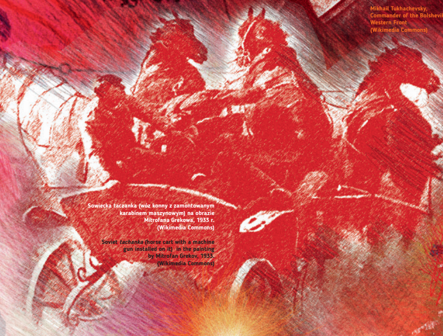
Sowiecka łazanka (wóz konny z zamontowanym karabinem maszynowym) na obrazie Mitrofana Grekowa, 1933 r. (Wikimedia Commons)