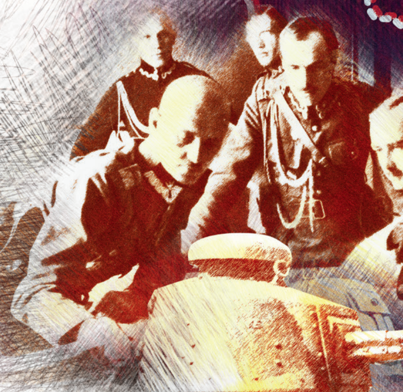
Sztab 5 Armii nad mapą, sierpień 1920 r. Z lewej na pierwszym planie dowódca armii gen. Władysław Sikorski