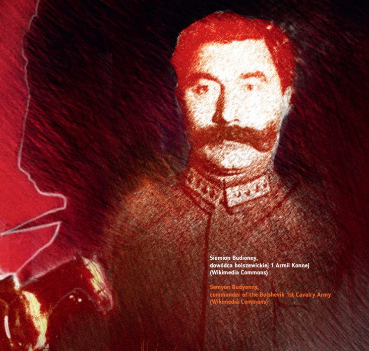
Siemion Budyonny, dowódca bolszewickiej 1 Armii Konnej