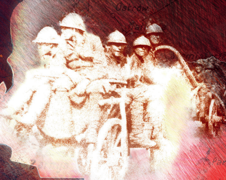
Żołnierze 1 Pułku Piechoty Legionów podczas ofensywy na Białystok, sierpień 1920 r. Soldiers of the 1st Legions Infantry Regiment during the Białystok offensive, August 1920.