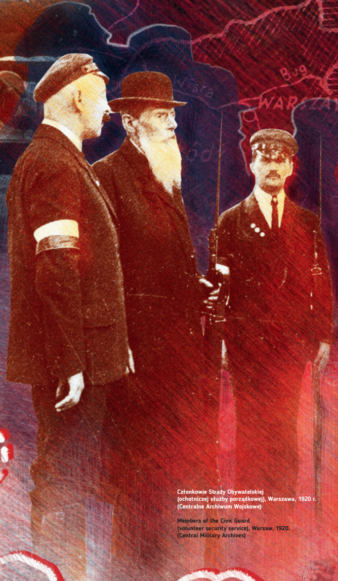
Członkowie Straży Obywatelskiej (ochotniczej służby porządkowej), Warszawa, 1920 r. Members of the Civic Guard (volunteer security service), Warsaw, 1920.