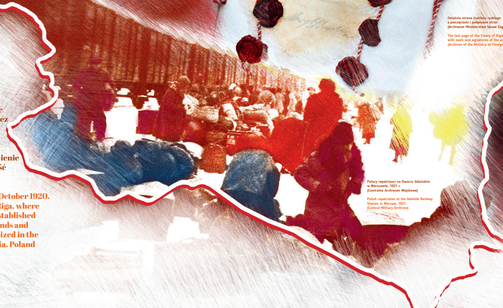
Polscy repatrianci na Dworcu Gdańskim w Warszawie, 1921 r. (Centralne Archiwum Wojskowe)

The ceasefire on the Polish-Bolshevik front came into force on 18 October 1920. Diplomatic negotiations took place over the following months in Riga, where a peace treaty was concluded on 18 March 1921. The new treaty established the border of the Second Polish Republic in the Eastern Borderlands and ordered the Bolsheviks to return the works of art and archives seized in the past by Russia, as well as to allow repatriation of Poles from Russia. Poland emerged victorious from the War for Independence.