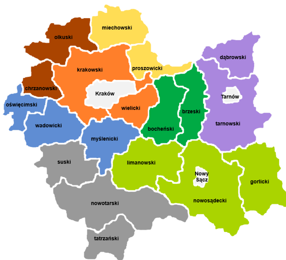
Fig. 1. Grupy powiatów w województwie małopolskim uwzględniające podobieństwa uwarunkowań geograficznych i ekonomiczno-społecznych prowadzenia działalności rolniczej oraz problemów związanych z korzystaniem z wód podziemnych i powierzchniowych (opracowanie własne)

Małopolski Ośrodek Doradztwa Rolniczego zorganizował cykl telekonferencji dla potencjalnych partnerów LPW, podczas których poza przedstawieniem wyników z prac pilotażowych LPW w 2020 r. i planem działań na 2021 r., scharakteryzowano wody powierzchniowe i podziemne w pozostałych powiatach województwa małopolskiego oraz przeprowadzono wykłady dostosowane tematycznie do poszczególnych grup powiatów (fig. 2) W wydarzeniach tych uczestniczyło łącznie 170 osób.