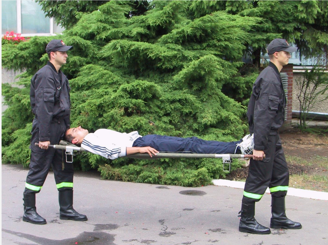
Transport za pomocą noszy