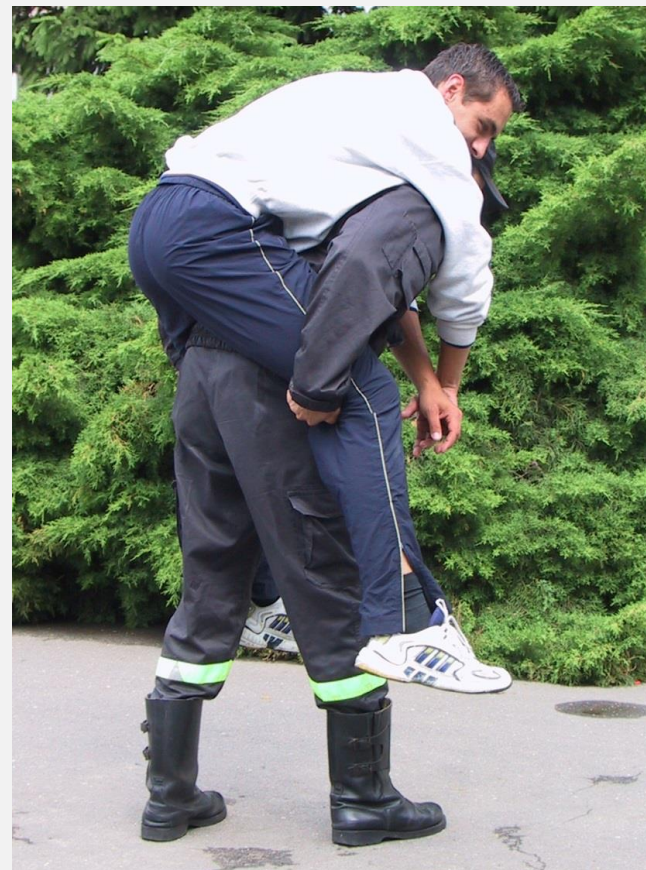
Chwył „na barana”