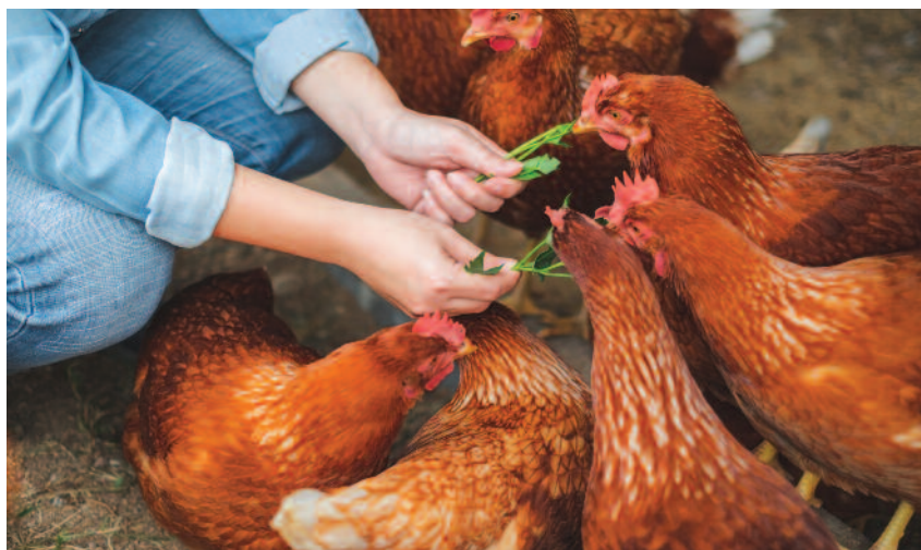
Osoby utrzymujące drób wyłącznie na własne potrzeby nie mają obowiązku rejestrować go w Krajowej Bazie Danych ARiMR