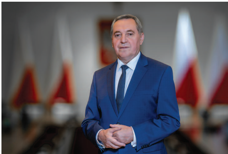
HENRYK KOWALCZYK, wiceprezes Rady Ministrów, minister rolnictwa i rozwoju wsi