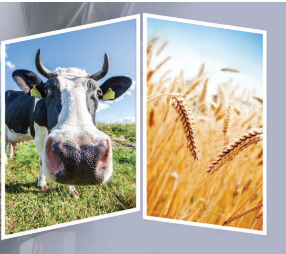
5 ekoschematów powierzchniowych oraz ekoschemat dobrostan zwierząt

Celem jest promowanie retencjonowania wody, które poprawia gospodarkę wodną, a także ogranicza emisję dwutlenku węgla do atmosfery (poprzez ograniczenie rozkładu materii organicznej). Warunkiem uzyskania płatności jest wystąpienie na TUZ zalania lub podtopienia między 1 maja a 30 września przez co najmniej 12 następujących po sobie dni. Płatność dotyczy TUZ objętych równolegle wsparciem: ekologicznym lub w ramach jednej z praktyk Rolnictwa węglowego i zarządzania składnikami odżywczymi, lub rolno-środowiskowo-klimatycznym