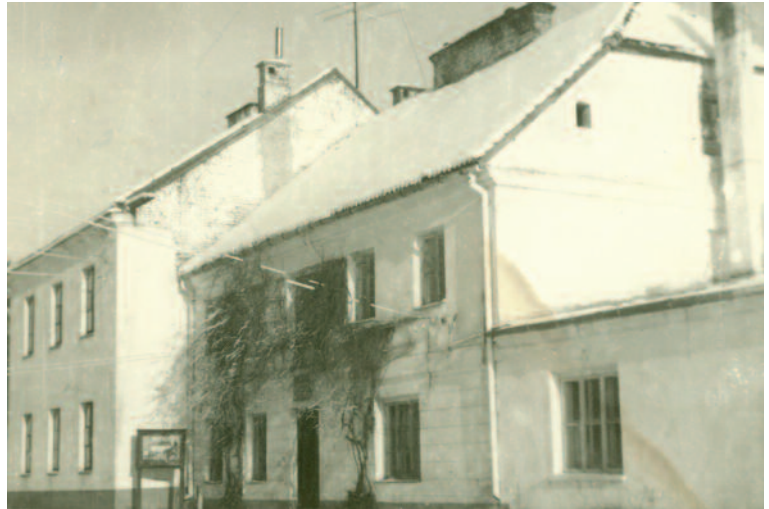
Podlaski Ośrodek Doradztwa Rolniczego od 75 lat pomaga rolnikom i mieszkańcom obszarów wiejskich północno-wschodniej Polski. Na zdjęciu: budynek zakładowy w Szepietowie w latach 60.

baza dydaktyczno-produkcyjna jest odpowiedzią na rosnące zainteresowanie przetwórstwem surowców rolnych na poziomie gospodarstwa. Umożliwia zainteresowanemu zapoznanie się z technologią przetworu danego produktu, aspektami ekonomicznymi podejmowanego przedsięwzięcia oraz wymogami sanitarnymi. Oferuje prezentację linii technologicznych dla odbiorców grupowych i indywidualnych, szkolenia, pokazy, zajęcia praktyczne.