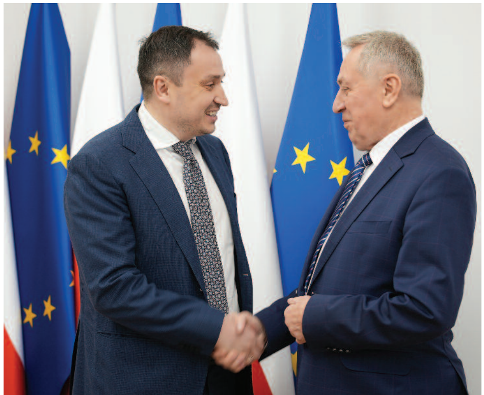
Spotkanie ministra Henryka Kowalczyka z ministrem Mykołą Solskim było poświęcone kwestii uszczelnienia i usprawnienia tranzytu zbóż z Ukrainy przez terytorium Polski

będą obligatoryjnie nakładane zamknięcia urzędowe (plomby celne), które będą zdejmowane w miejscu przeznaczenia towaru.