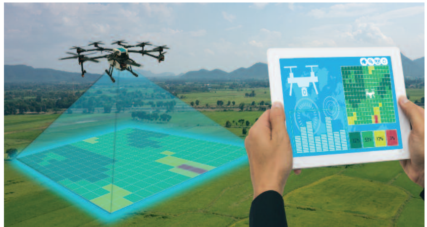
Wykorzystanie dronów w pracach Inspekcji usprawnia weryfikację lokalizacji i identyfikację kontrolowanych upraw

na szybkie wykonanie analizy stanu upraw, tworzenie map 3D plantacji nasiennych oraz precyzyjne zlokalizowanie miejsc rozwoju choroby czy występowania szkodników. Tym samym zastosowanie bezzałogowych statków powietrznych wraz ze zwiększeniem powszechności technologii obrazowania multispektralnego usprawnia analizowanie stanu zdrowia roślin.