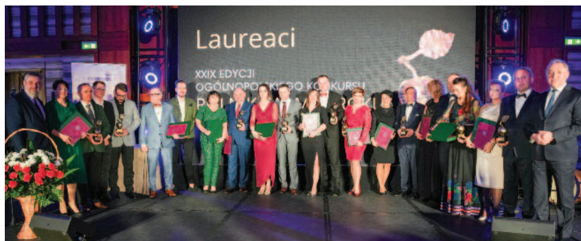
Laureaci XXIX edycji Ogólnopolskiego Konkursu Rolnik Farmer Roku

Szef resortu rolnictwa gratulował Laureatom życząc jednocześnie większej stabilności i spokoju w bieżącym roku. Zwrócił także uwagę, że niezwykle istotne jest docenienie pracy rolnika, jego poświęcenia i zaangażowania.