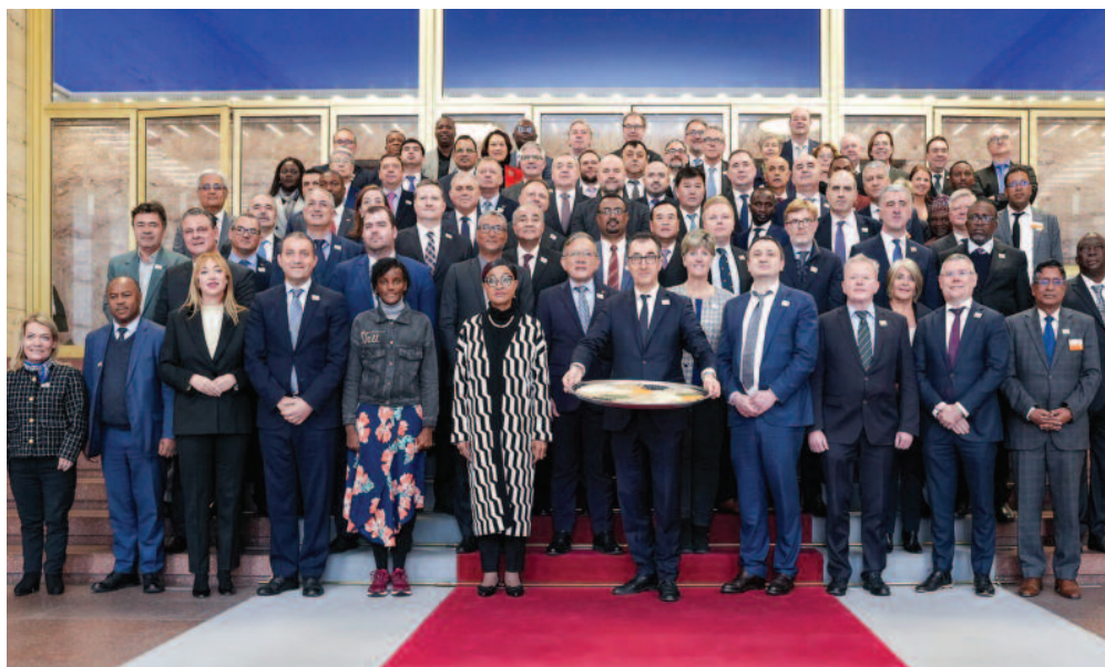
W Światowym Szczycie Ministrów Rolnictwa uczestniczyli przedstawiciele ponad 70 państw i organizacji międzynarodowych z całego świata

Szef polskiego resortu rolnictwa podkreślił, że niezbędna jest po-