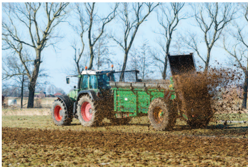
Aktualizacja programu azotanowego wprowadza możliwość wcześniejszego stosowania nawozów

W związku z postępowaniem w rolnictwie wprowadzono zmiany w wartościach dotyczących średniej rocznej wielkości produkcji nawozów naturalnych i koncentracji zawartego w nich azotu (znajdujących się w załączniku nr 6 do programu azotanowego). W zaktualizowanym programie azotanowym