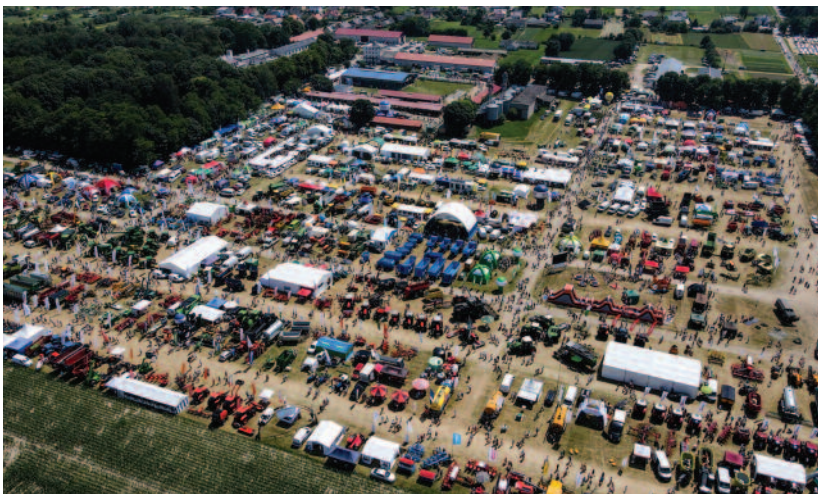
Od 29 lat w PODR Szepietowo są organizowane Regionalne Wystawy Zwierząt Hodowlanych i targi rolnicze

bydła mlecznego, mięsnego, koni, owiec, królików rasowych i drobiu. Wystawie towarzyszą Dni z Doradztwem Rolniczym, które są okazją do skorzystania z kompleksowego doradztwa oraz targi rolnicze, w których uczestniczą wystawcy z całego kraju.