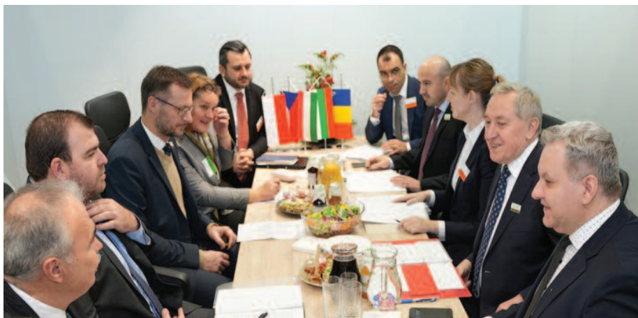
Rozmowy ministrów ds. rolnictwa o perspektywach współpracy

Minister gospodarki Armenii Vahan Kerobyan zadeklarował pełną gotowość i chęć współpracy z Polską w obszarze wymiany handlowej towarami rolno-spożywczymi oraz w eliminowaniu barier w dostępie do rynku. Zadeklarował, że w celu