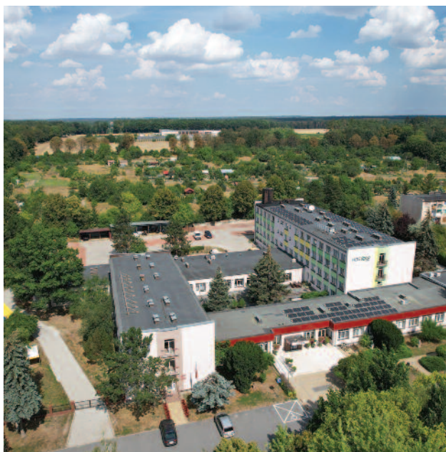
Siedziba Lubuskiego Ośrodka Doradztwa Rolniczego w Kalsku

Tym, co wyróżnia LODR, jest przede wszystkim odradzające się na terenach południowo-zachodniej Polski winiarstwo. Obecnie w regionie istnieje około 54 winnic. Słowo „około” nie jest przypadkowe, gdyż być może właśnie teraz powstają i rejestrują się kolejne winnice.