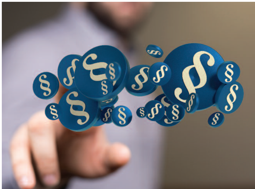
Ubezpieczeni w KRUS skorzystają na kolejnych zmianach przepisów prawa

Zmiana oznacza nowe, korzystne zasady waloryzacji świadczeń emerytalno-rentowych rolniczych: wyższe emerytury rolnicze (nie