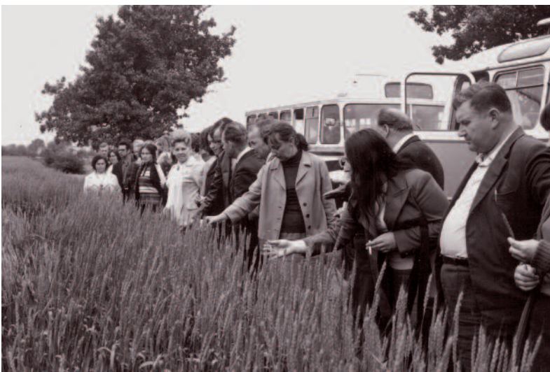
Dolnośląscy rolnicy już od 63 lat korzystają z pomocy państwowych służb doradczych

W sobotę i niedzielę 10 i 11 czerwca 2023 r. zapraszamy do Wrocławia na święto dolnośląskich hodowców, podczas którego spotykają się najlepsi w branży. Swoje osiągnięcia zaprezentują najwięksi regionalni hodowcy bydła, czyli Ośrodki Hodowli Zarodowej w Ka-