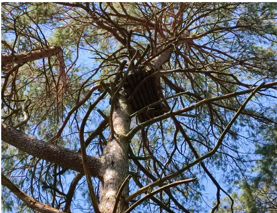
Ryc. 1. Platforma dla puchacza w leśnictwie Lichwin oddz. [REDACTED], stan na 24.06.2022 r.