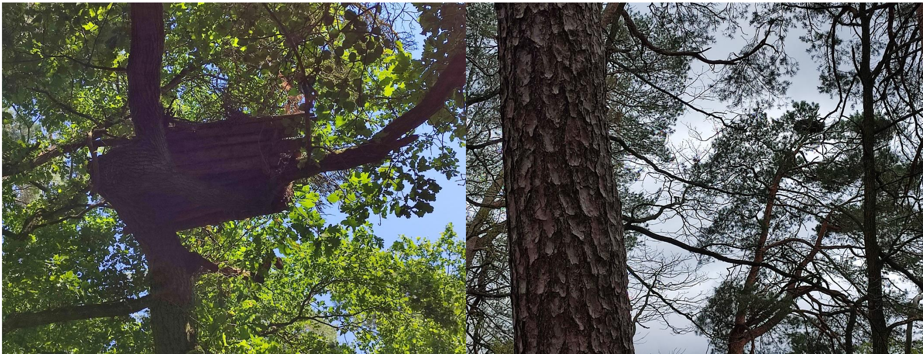
Ryc. 3. Platforma dla puchacza w leśnictwie Prusim oddz. [REDACTED], stan na 27.06.2022 r.