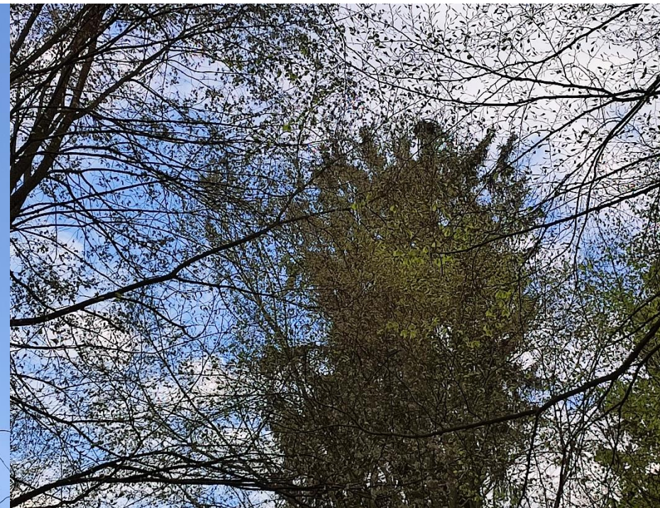
Ryc. 6. Platforma dla rybołowa w leśnictwie Ławica oddz. [REDACTED], stan na 28.04.2022 r.