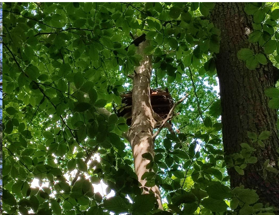
Ryc. 2. Platforma dla puchacza w leśnictwie Stary Młyn oddz. [REDACTED], stan na 22.06.2022 r.