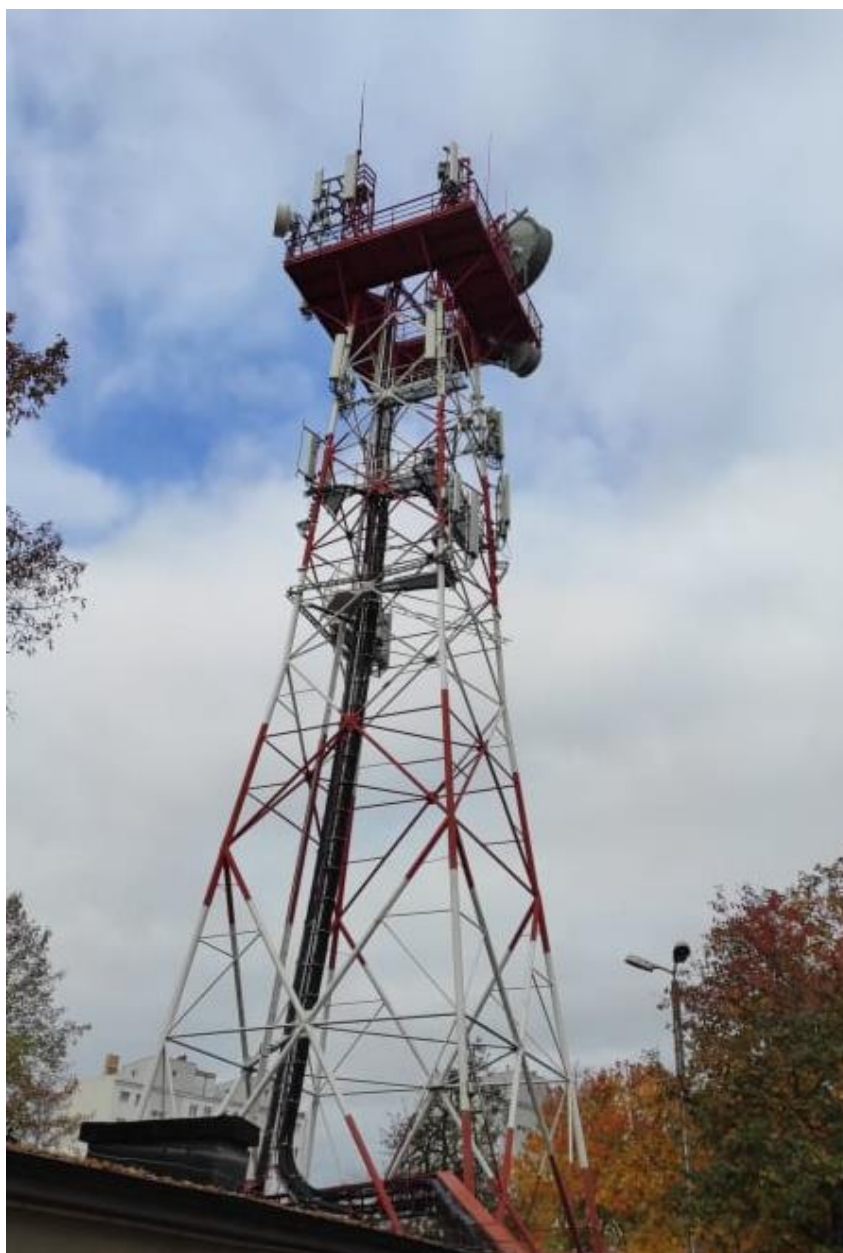
Fot. 1: Widoki anten stacji bazowych: ID: BT30172, ID: ZGO1037 oraz ID: 2216, zlokalizowanych: ul. Wroclawska 63a, Zielona Góra