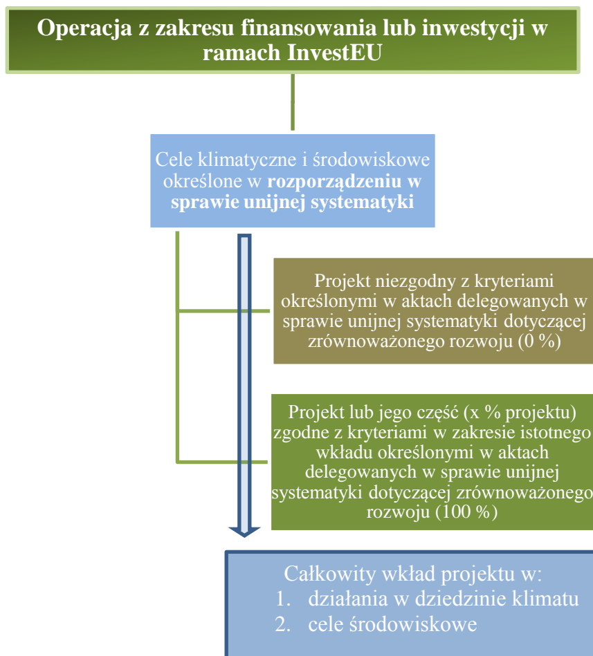
Rysunek 2 Monitorowanie inwestycji na rzecz klimatu i środowiska przy użyciu kryteriów określonych w unijnej systematyce dotyczącej zrównoważonego rozwoju 34