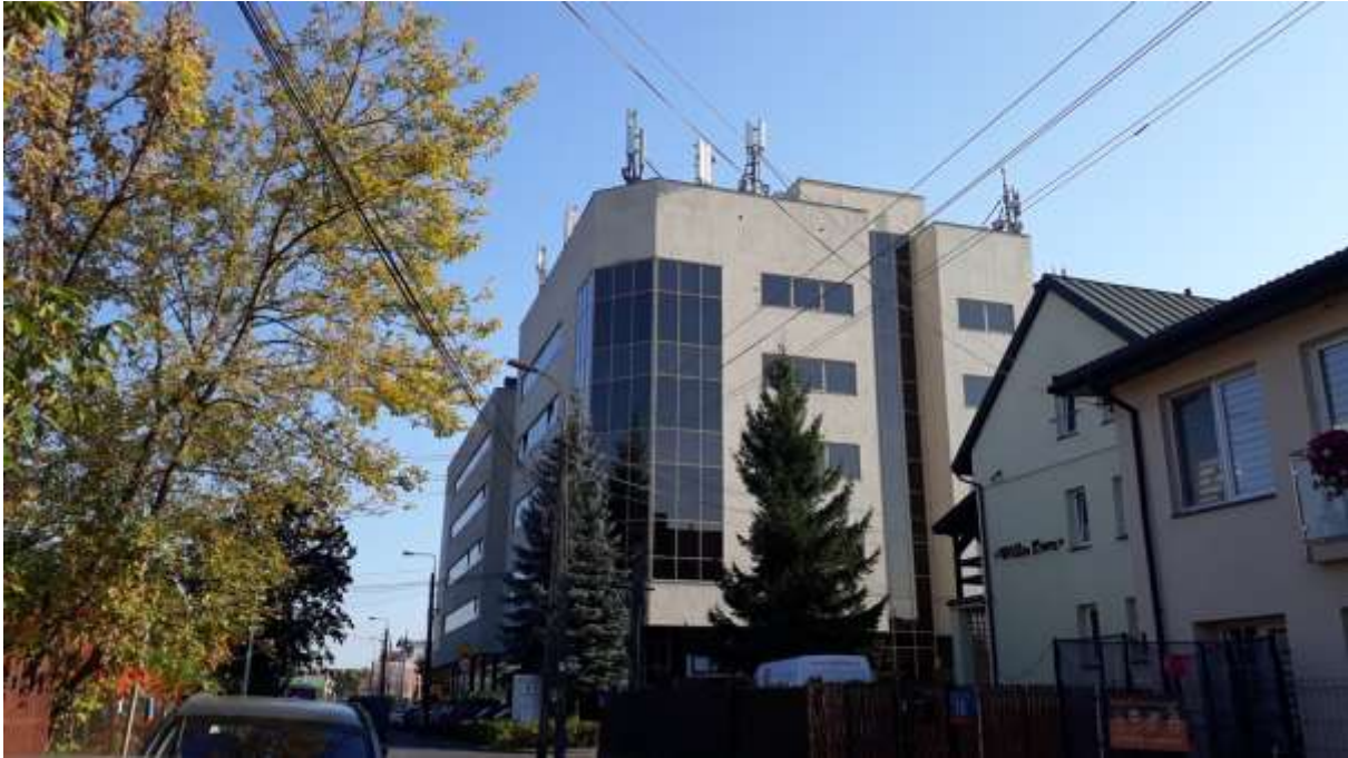
Fot. 1: Widoki anten stacji bazowych ID: WAR2304, zlokalizowanej: ul. Murmańska 25, 04-203 Warszawa oraz ID: 20186 (81385N!), ID: BT16302, zlokalizowanych: ul. Jordanowska 12, 04-203 Warszawa