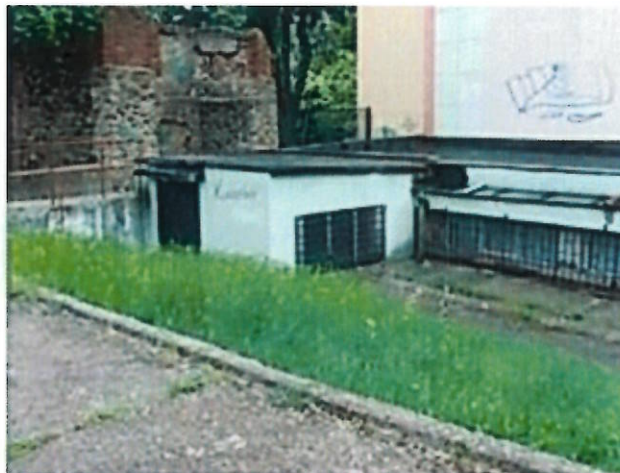
Lubin ul. Grodzka 11, działka nr 49/1 obręb nr 0005 miasta Lubina