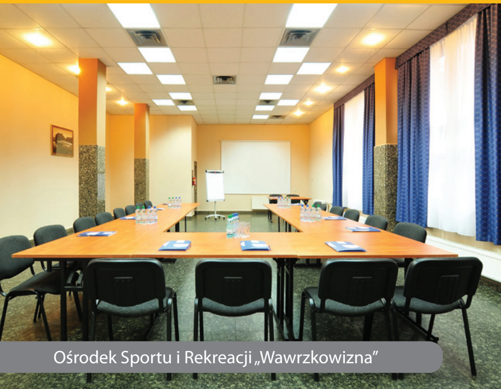
Ośrodek Sportu i Rekreacji „Wawrzkowizna”

Ośrodek dysponuje trzema zróżnicowanymi pod względem wielkości salami konferencyjnymi (15 m 2 , 57 m 2 , 85 m 2 ) pozwalającymi na organizację spotkań dla grup do 70 osób.