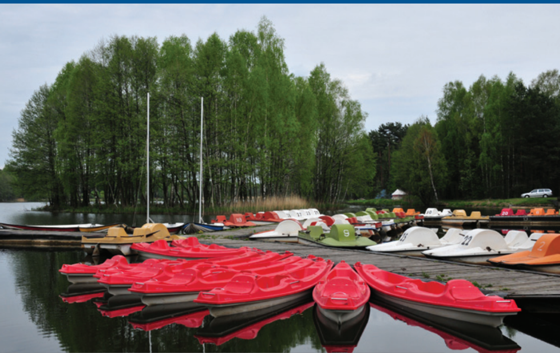
Ośrodek Sportu i Rekreacji „Wawrzkowizna”