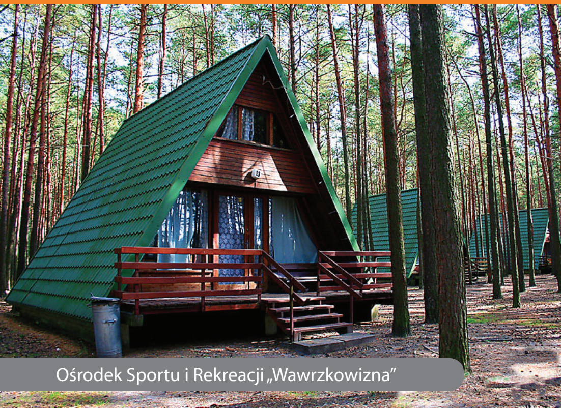
Ośrodek Sportu i Rekreacji „Wawrzkowizna”

32 domków 6-cio osobowych o dwóch kondygnacjach z salonem, częścią sypialnianą, aneksem kuchennym, pełnym węzłem sanitarnym. Wyposażone w telewizor, lodówkę, kuchnię z podstawowym wyposażeniem. Domki sezonowe, w tym 3 całoroczne.