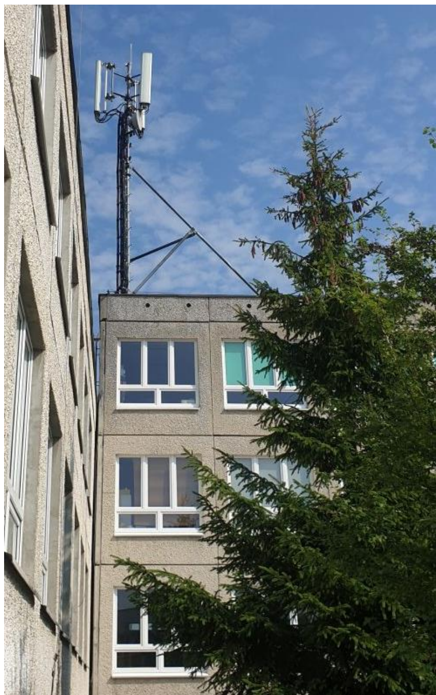
Fot. 1: Widok anten stacji bazowej: ID: OLS1032_C, zlokalizowanej pod adresem: ul. Żytnia 71, 10-822 Olsztyn