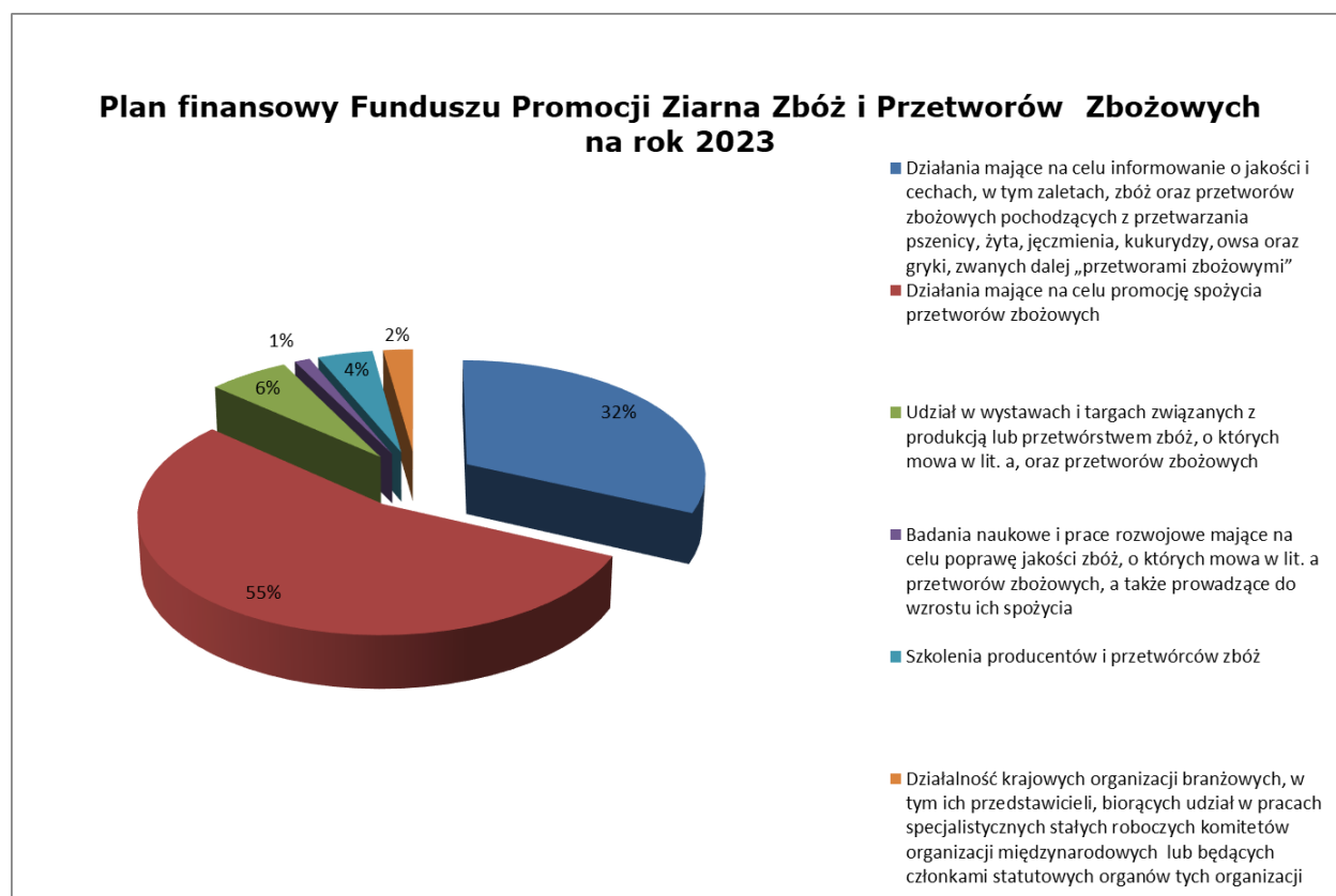
Wykres nr 3. Struktura Planu finansowego FPZZiPZ na rok 2023.

Planie finansowym FPZZiPZ na rok 2023 na zadania zgodne z celami Funduszu Promocji Ziarna Zbóż i Przetworów Zbożowych przeznaczono kwotę 12 423 405,95 PLN.