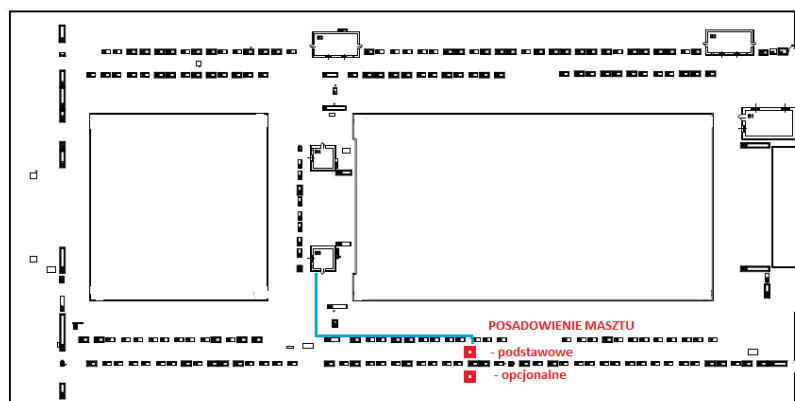
— PROWADZENIE INSTALACJI ELEKTRYCZNEJ ZASILAJĄCEJ OŚWIETLENIE

Miejsca ustawienia masztu na dachu wskazano na zdjęciach :