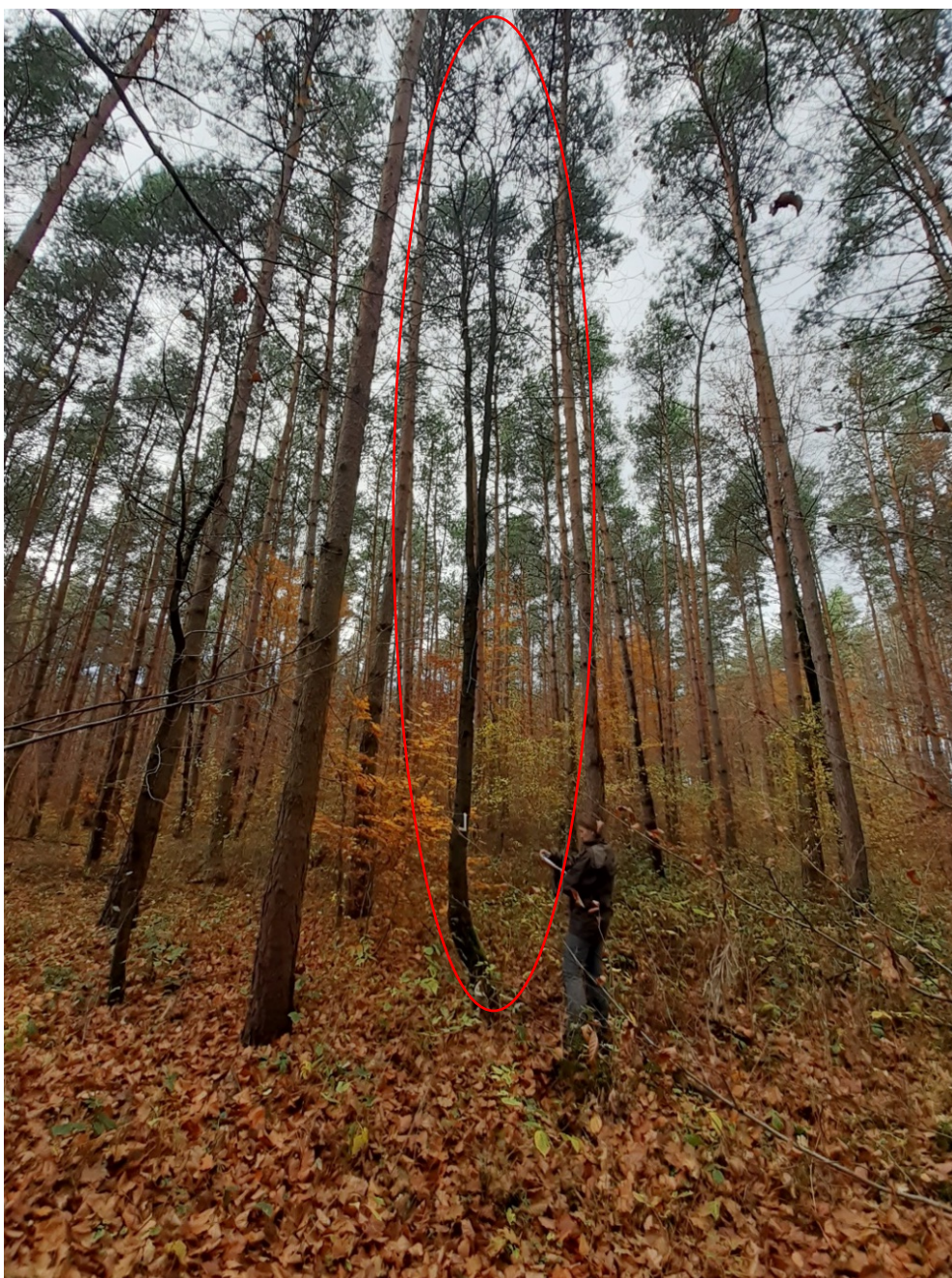
Przykładowe zdjęcie drzewa kategorii „średnie”