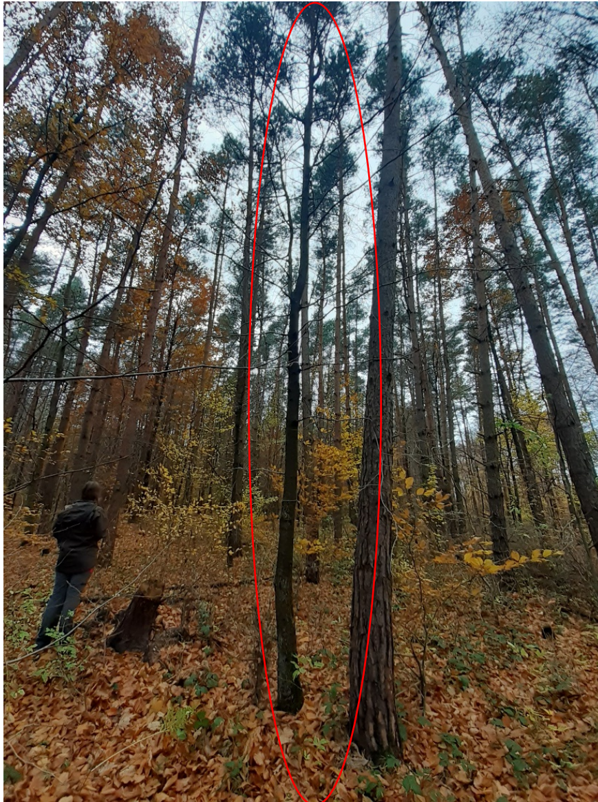
Przykładowe zdjęcie drzewa kategorii „łatwe”