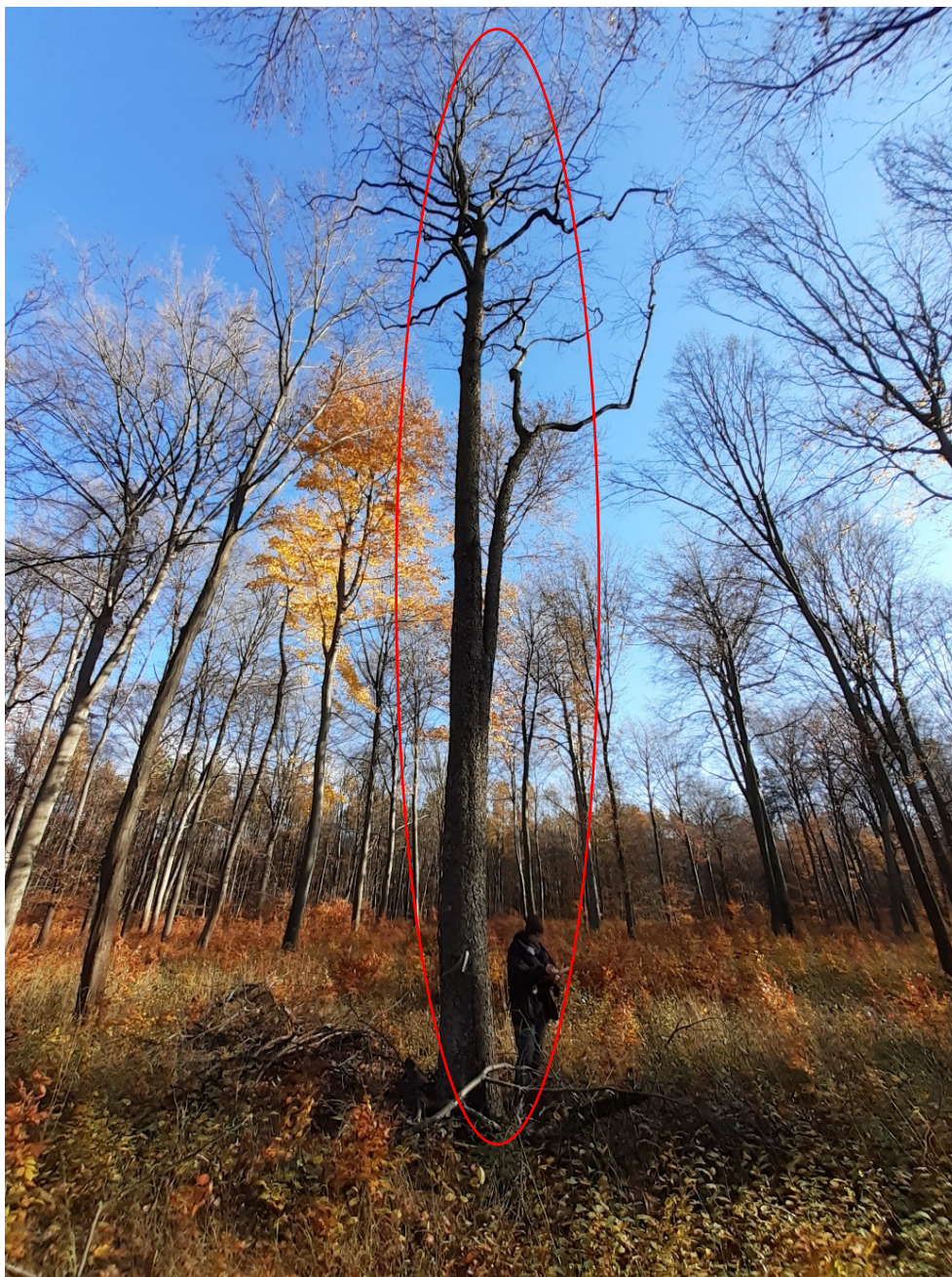
Przykładowe drzewo kategorii „trudne”