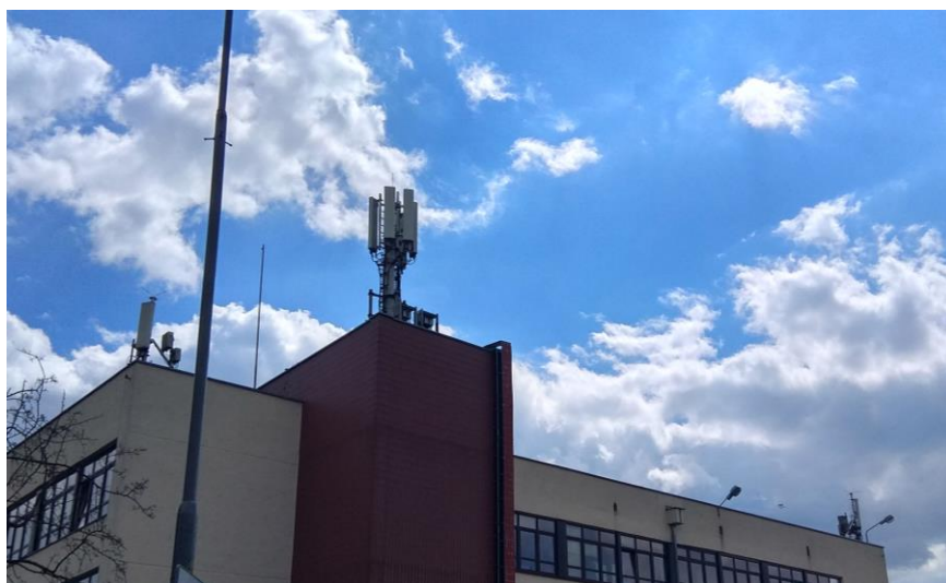
Fot. 1: Widok anten stacji bazowych: ID: POZ0134, ID: 40377 (70377N!), zlokalizowanych pod adresem: ul. Wojska Polskiego 31/33, 60-649 Poznań