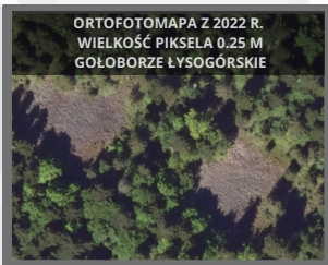
ORTOFOTOMAPA Z 2022 R. WIELKOŚĆ PIKSELA 0.25 M GOŁOBORZE ŁYSOGÓRSKIE