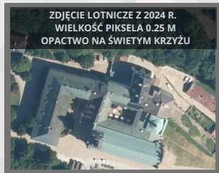
ZDJĘCIE LOTNICZE Z 2024 R. WIELKOŚĆ PIKSELA 0.25 M OPACTWO NA ŚWIĘTYM KRZYŻU

W serwisie geoportal.gov.pl prezentowanych jest wiele danych i usług, które umożliwiają analizę tego terenu.