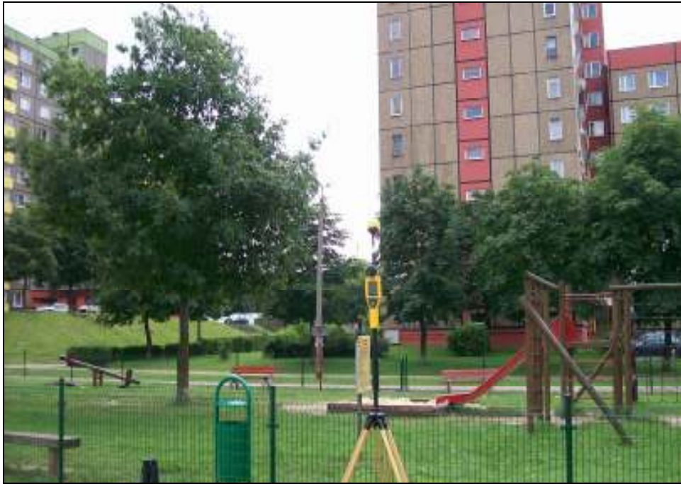
Fot. 1. Rejon badań, widok w kierunku południowo-wschodnim