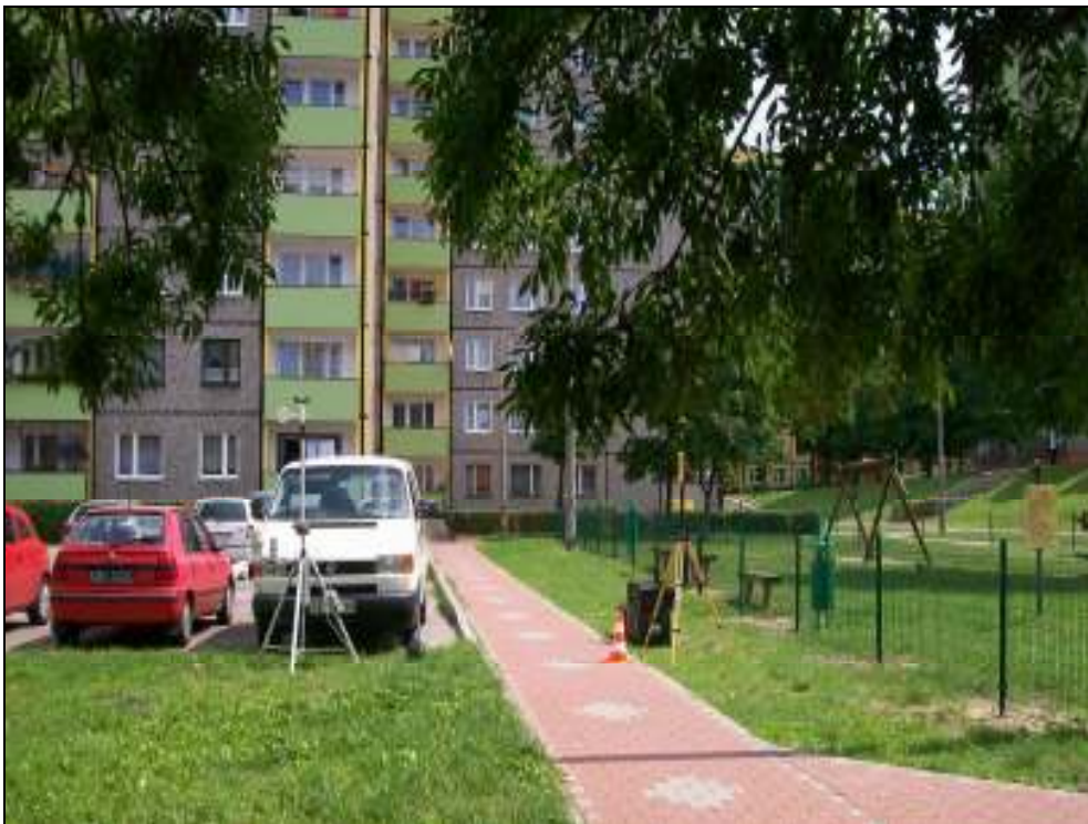
Fot. 2. Rejon badań, widok w kierunku wschodnim