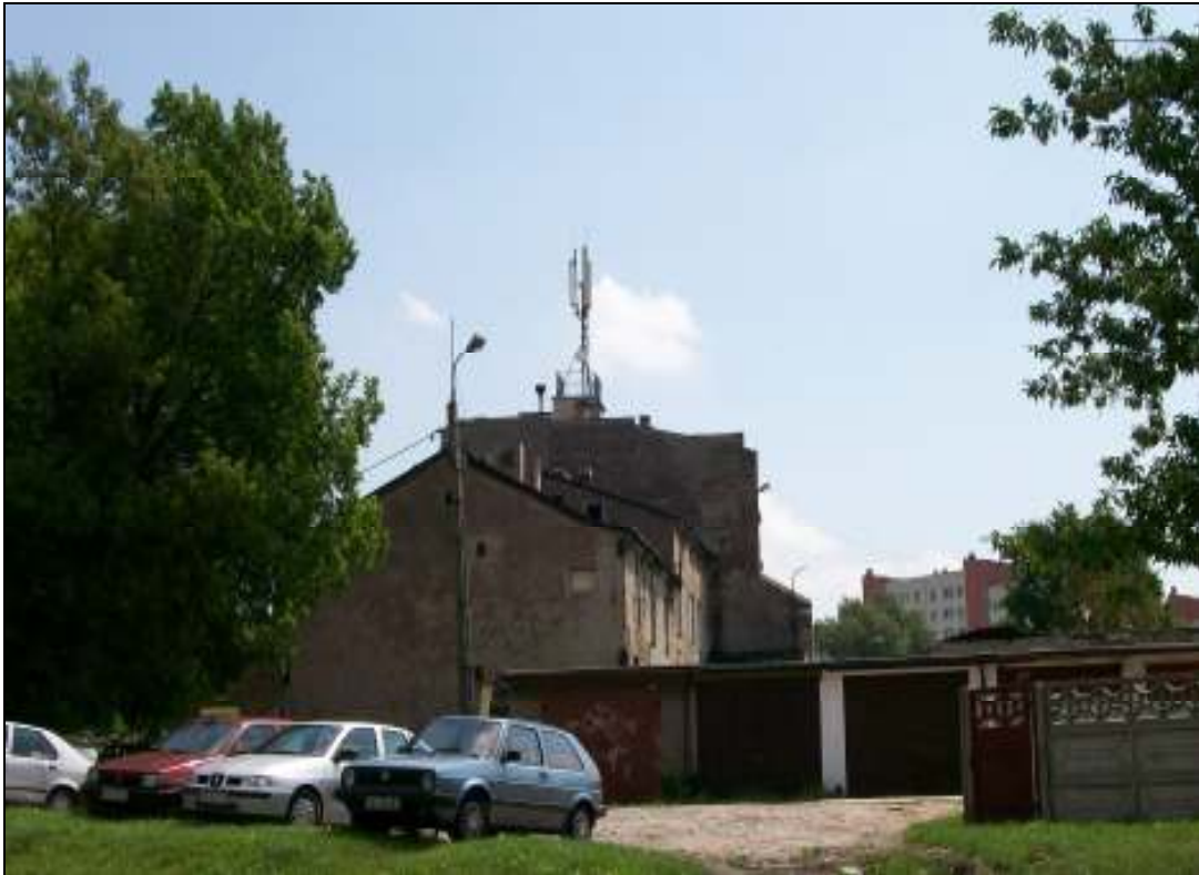
Fot. 3. Fragment instalacji radiokomunikacyjnej na budynku przy ul. Szpitalnej