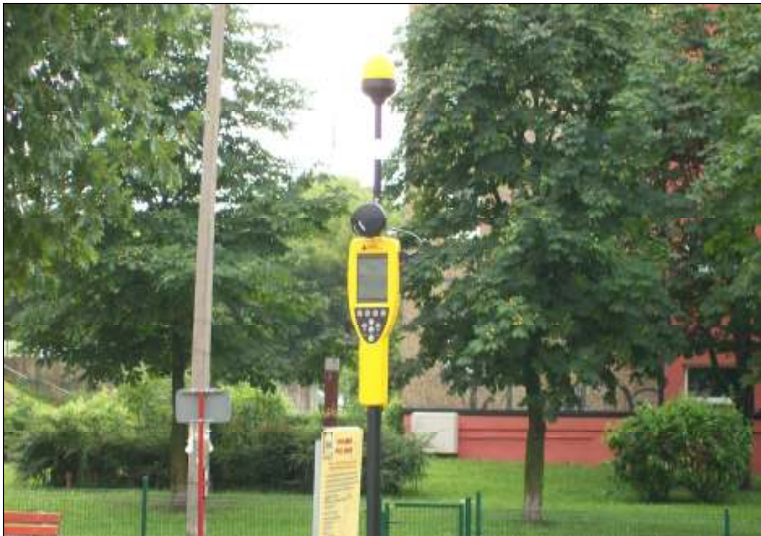
Fot. 4. Przyrząd pomiarowy w trakcie wykonywanego badania