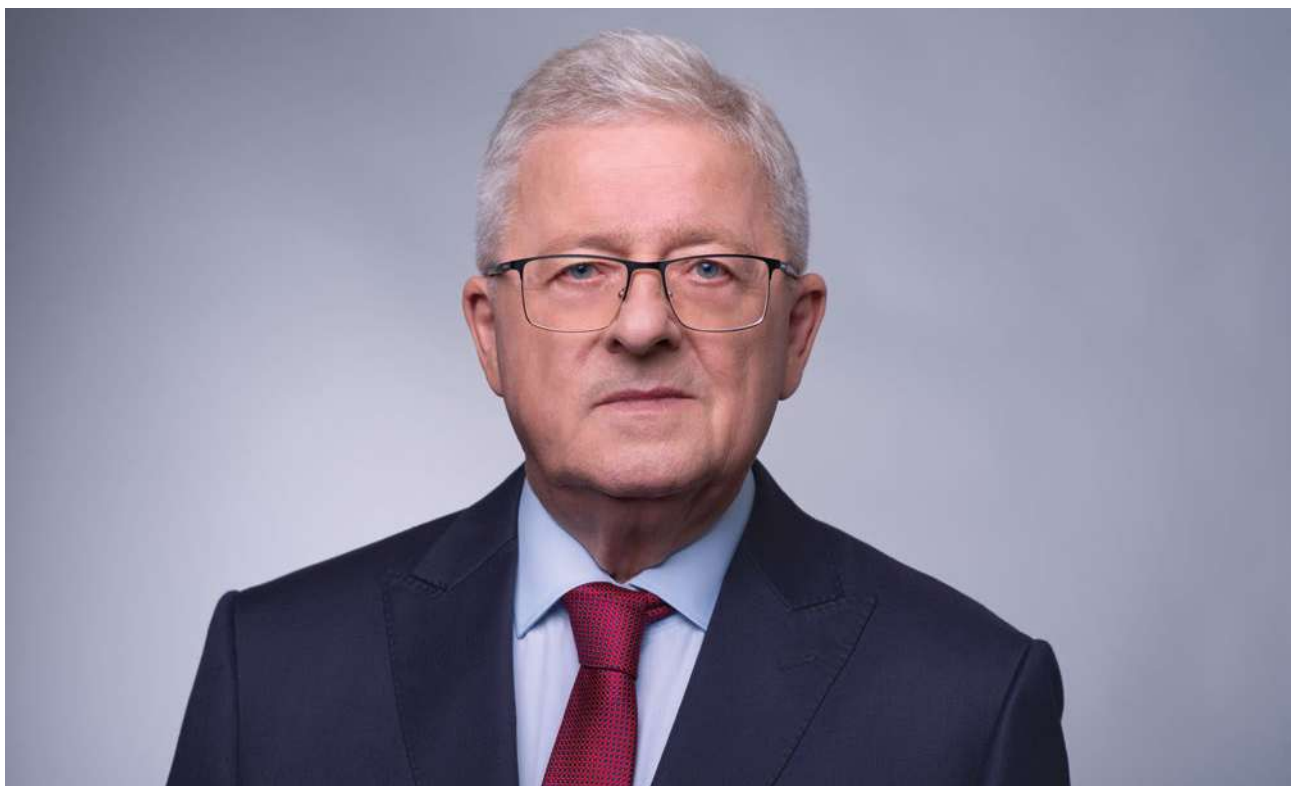
CZESŁAW SIEKIERSKI, minister rolnictwa i rozwoju wsi