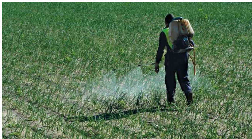
Profesjonalny użytkownik środków ochrony roślin jest zobowiązany zapewnić prawidłową i precyzyjną aplikację pestycydów

Inspekcja zachęca do skorzystania z wyszukiwarki środków ochrony roślin zamieszczonej na stronie MRiRW ( https://www.gov.pl/web/rolnictwo/wyszukiwarka-srodkow-ochrony-roslin ) przed zaplanowaniem ochrony roślin oraz zakupem środków ochrony roślin oraz do zapoznania się z udostępnionymi tam etykietami środków ochrony roślin ( https://www.gov.pl/web/rolnictwo/etykiety-srodkow-ochrony-roslin ).