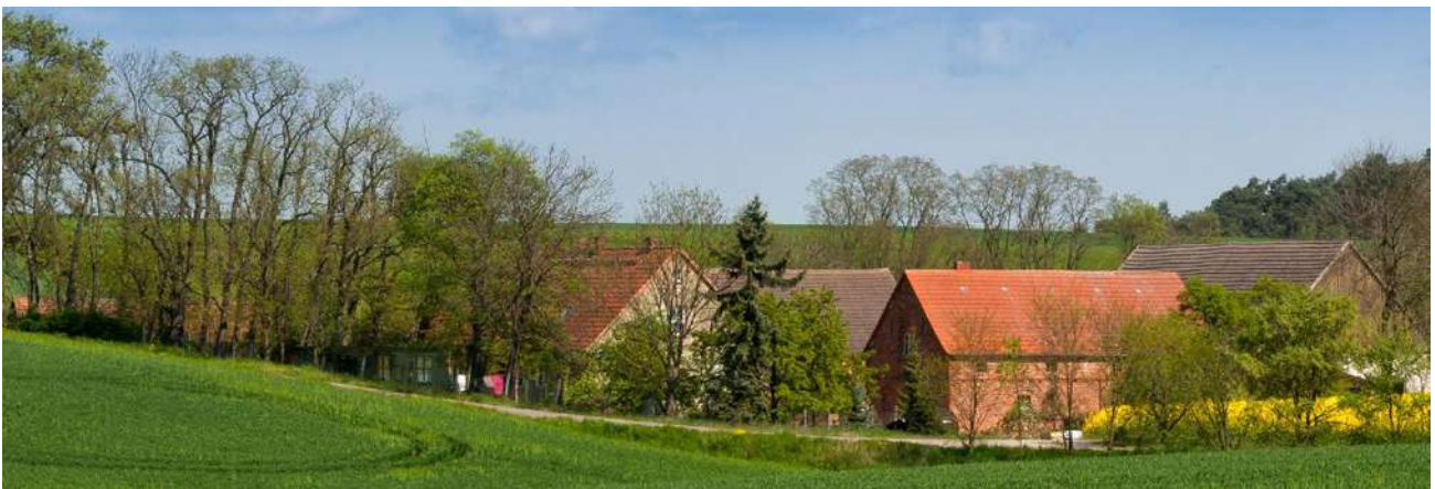
Płatność dla małych gospodarstw zostanie wdrożona na lata 2024–2027