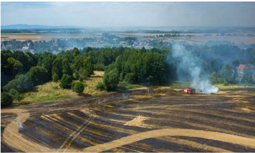
Wypalanie traw stwarza bezpośrednie zagrożenie dla ludzi oraz zwierząt i niszczy środowisko naturalne

Mimo że od wielu lat Agencja Restrukturyzacji i Modernizacji Rolnictwa (ARiMR), Państwowa Straż Pożarna, Ochotnicza Straż Pożarna oraz inne instytucje przestrzegają przed wypalaniem traw i tak co roku znajdują się osoby, które lekceważą te apele. W ten sposób stwarzają bezpośrednie zagrożenie dla ludzi oraz zwierząt i niszczą środowisko naturalne. W 2023 r. strażacy interweniowali przy pożarach traw i nieużytków rolnych blisko 21 tys. razy i z obawą myślą o tegorocznej wiosnie.