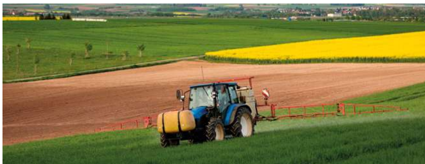
Projekt rozporządzenia UE dot. przepisów zakładających radykalne ograniczenie stosowania środków ochrony roślin został wycofany

Działania polskiego rządu istotnie przyczyniły się do zatrzymania prac na poziomie Unii Europejskiej nad projektem przepisów wdrażających nieracjonalne i krytykowane przez środowiska rolnicze cele Europejskiego Zielonego Ładu w zakresie ograniczenia stosowania środków ochrony roślin. Przewodnicząca Komisji Europejskiej Ursula von der Leyen 6 lutego 2024 r. zapowiedziała wycofanie przez KE projektu rozporządzenia Parlamentu Europejskiego i Rady w sprawie zrównoważonego stosowania środków ochrony roślin i w sprawie zmiany rozporządzenia (UE) 2021/2115.