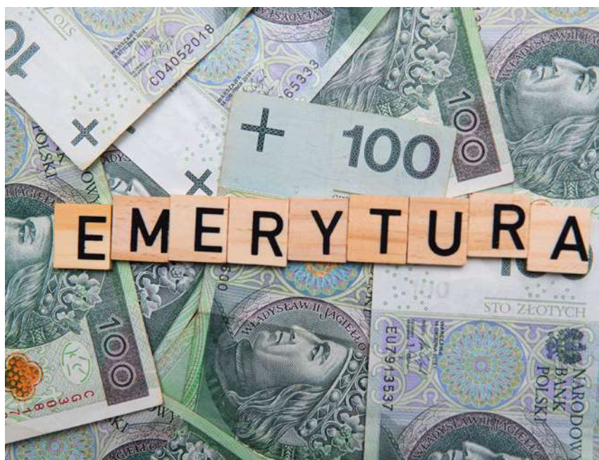
Emerytury i renty z ubezpieczenia społecznego rolników podlegają corocznie waloryzacji

Przeciętne wynagrodzenie miesięczne w IV kwartale 2023 r. wyniosło 7540,36 zł. W związku z tym od 1 marca 2024 r. zmienia się dopuszczalne kwoty dodatkowych przychodów osiąganych przez emerytów i rencistów i będą wynosić: