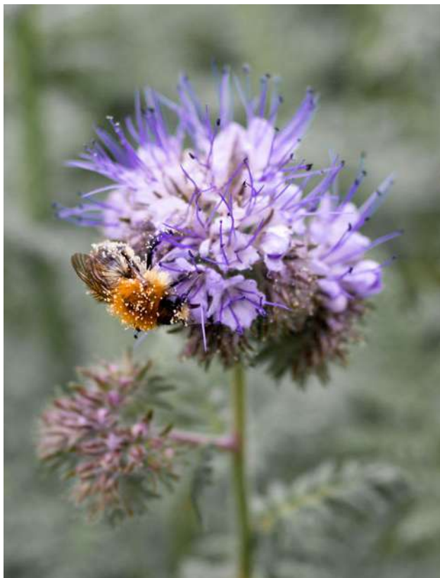
Stawka płatności za realizację ekoschematu „Obszary z roślinami miododajnymi” wynosi 1256,77 zł/ha