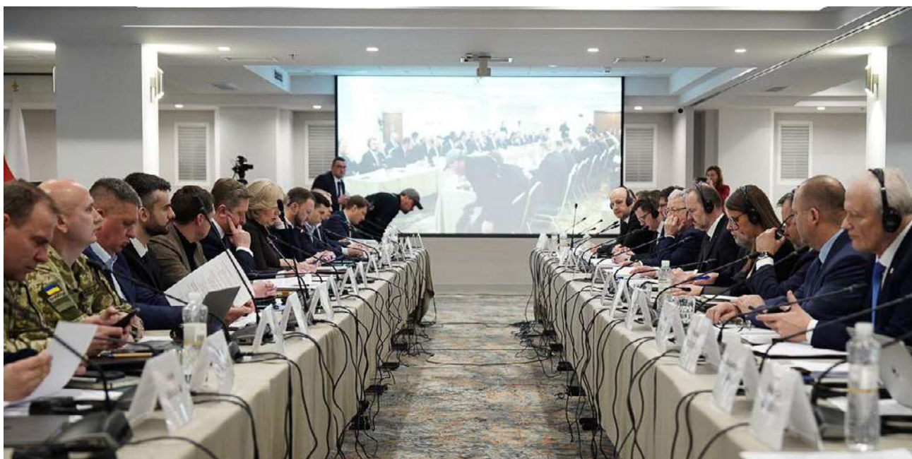
Uczestnicy IX posiedzenia Polsko-Ukraińskiej Komisji Międzyrządowej ds. współpracy gospodarczej we Lwowie

Przed posiedzeniem plenarnym Polsko-Ukraińskiej Komisji Międzyrządowej ds. współpracy