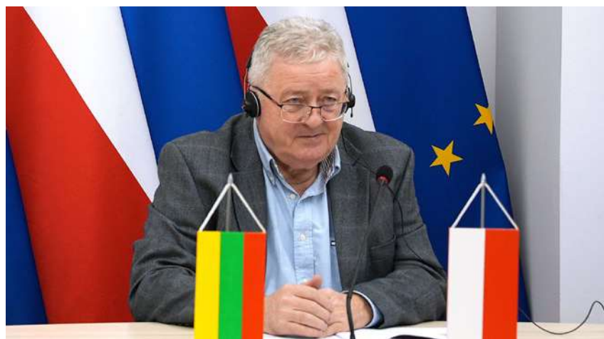
Minister rolnictwa i rozwoju wsi Czesław Siekierski 1 marca 2024 r. rozmawiał w formule online o sytuacji w sektorze rolnym z ministrem rolnictwa Republiki Litewskiej Kęstutisem Navickasem

• Minister Rolnictwa Litwy podkreślił, że prowadzone na granicy z Litwą kontrole nie potwierdzają, aby ukraińskie zboże trafiało na polski rynek po odprawie celnej na Litwie.