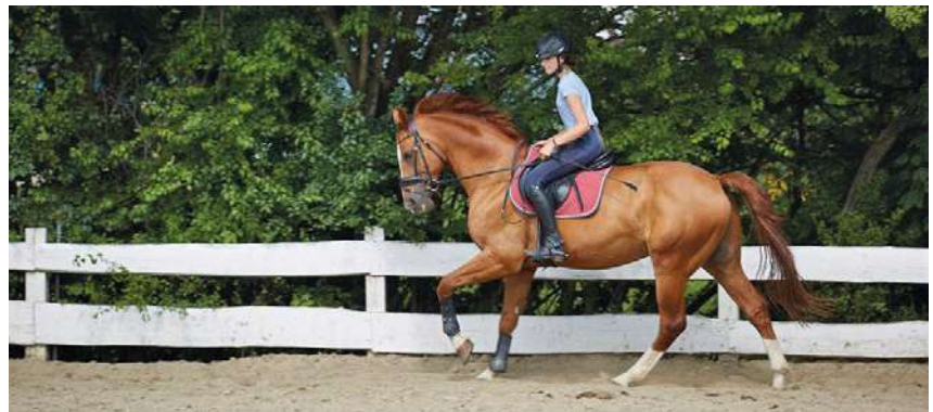
Stajnia Karlikowo rozwija się dzięki wsparciu otrzymanemu z Północnokaszubskiej Lokalnej Grupy Rybackiej

W urokliwym sąsiedztwie Nadmorskiego Parku Krajobrazowego w gminie Krokowa działa Stajnia Karlikowo. Dzięki wybudowaniu krytej ujeżdżalni ośrodek może działać przez cały rok.