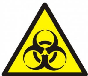
Ostrzeżenie przed skażeniem biologicznym