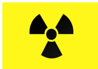
Ostrzeżenie przed substancjami radioaktywnymi i promieniowaniem jonizującym