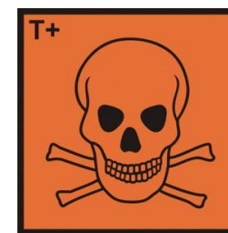
Ostrzeżenie przed niebezpieczeństwem zatrucia substancjami toksycznymi