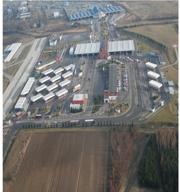
Infrastruktura Drogowego Przejścia Granicznego w Korczowej

Pod nadzorem Państwowego Granicznego Inspektora Sanitarnego w Przemysłu znajduje się 5 izolatoriów dla chorych i podejrzanych o zachorowanie na szczególnie niebezpieczne choroby zakaźne. Są to pomieszczenia medyczne zlokalizowane na Lotniczym Przejściu Granicznym w Jasionce oraz Drogowych Przejściach Granicznych w Korczowej, Medyce, Krościenku i Budomierzu. W ciągu roku przeprowadzono 11 kontroli. Izolatoria składają się z pokoju badań lekarskich, pokoju lekarza i izolatki z węzłem sanitarnym z bezpośrednim wyjściem na zewnątrz terminala. Od ciągu komunikacyjnego izolatoria oddzielone są służą fartuchowo-umywalkową. Pomieszczenia izolatoriów posiadają punkty poboru ciepłej, bieżącej wody. Podstawowym źródłem zaopatrzenia izolatoriów w wodę są odpowiednio wodociąg sieciowy Torki, wodociąg sieciowy Chotyńiec, wodociąg sieciowy