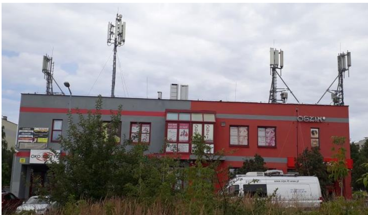
Fot. 1: Widok anten stacji bazowych: ID: KIE1046A, zlokalizowanej pod adresem: ul. Kredowa 2, 25-640 Kielce ID: 27343, zlokalizowanej pod adresem: ul. Massalskiego 9, 25-640 Kielce