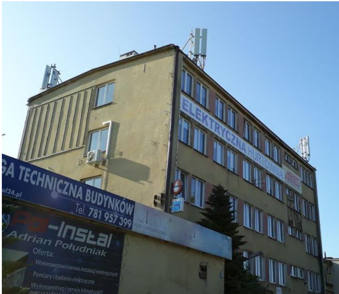
Fot. 1: Widok anten stacji bazowej: ID: RZE1026C, zlokalizowanej pod adresem: ul. Boya-Żeleńskiego 23, 35-105 Rzeszów