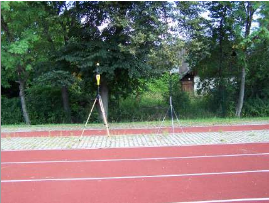
Fot. 3. Rejon badań, widok w kierunku północnym