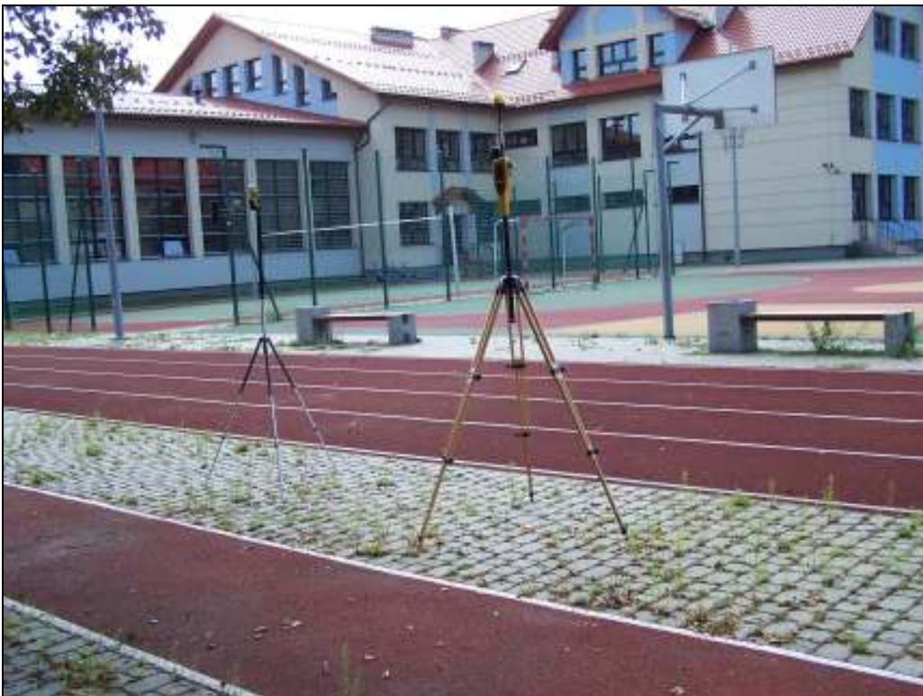
Fot. 2. Rejon badań, widok w kierunku południowo-wschodnim