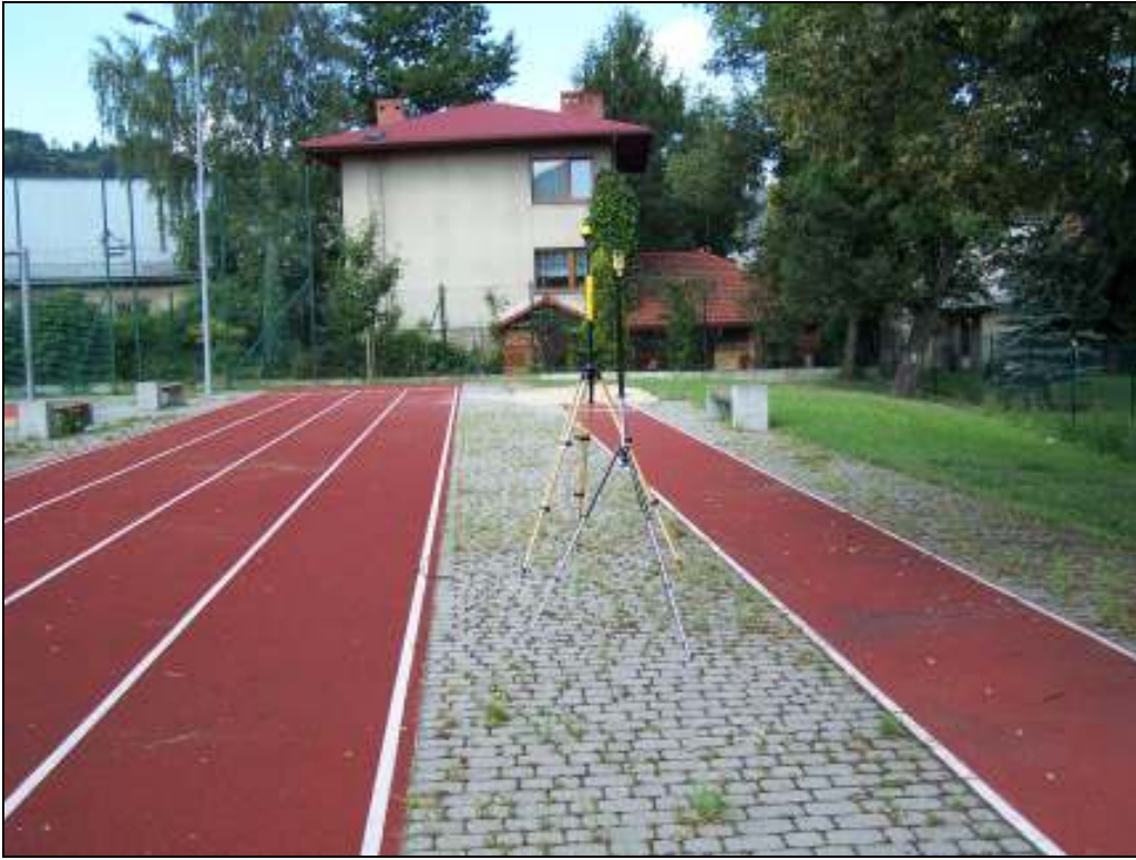
Fot. 1. Rejon badań, widok w kierunku zachodnim