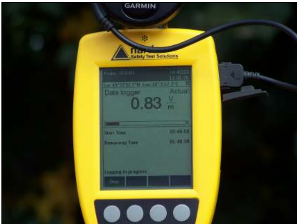
Fot. 4. Urządzenie pomiarowe w trakcie prowadzonego badania