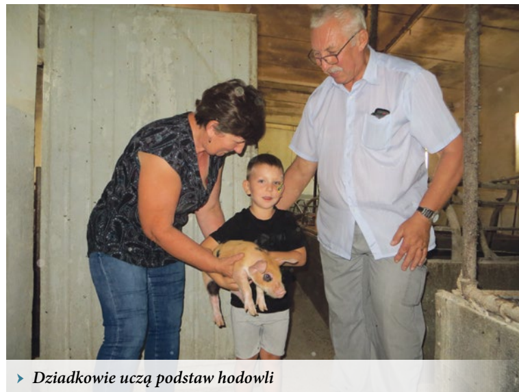
▶ Dziadkowie uczą podstaw hodowli