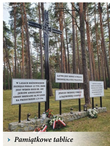
► Pamiątkowe tablice

– To miejsce ważne dla naszej historii. Zasluguje ono na pamięć potomnych. Choć od tamtych wydarzeń minęło już ponad osiemdziesiąt lat, my musimy pamiętać