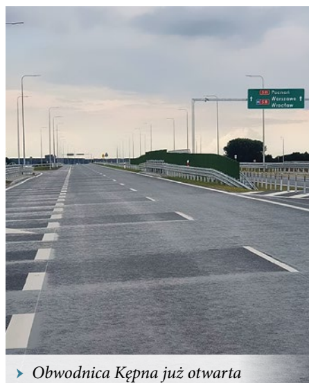
► Obwodnica Kępna już otwarta

Droga ekspresowa S11, biegnąc przez Wielkopolskę, połączy Pomorze Środkowe z aglomeracją śląską. Docelowo będzie miała ponad 600 km długości, z czego obecnie kierowcy mają do dyspozycji blisko 126 (w tym wspólny przebieg S6 i S11 od Kołobrzegu do Koszalina – ok. 35 km). Kolejne blisko 80 km jest w reali-