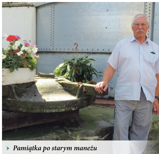
▶ Pamiątka po starym maneżu

kich dziedzinach. Uważa, że domowe przetwory biją na głowę te ze sklepu, ale młodzież woli własnie takie. Otwierają tekturowy kartonik i po sprawie. Szybciej i wygodniej. Ale nie ma to jak sok pomidorowy czy dżem wiśniowy z własnej spiżarni.