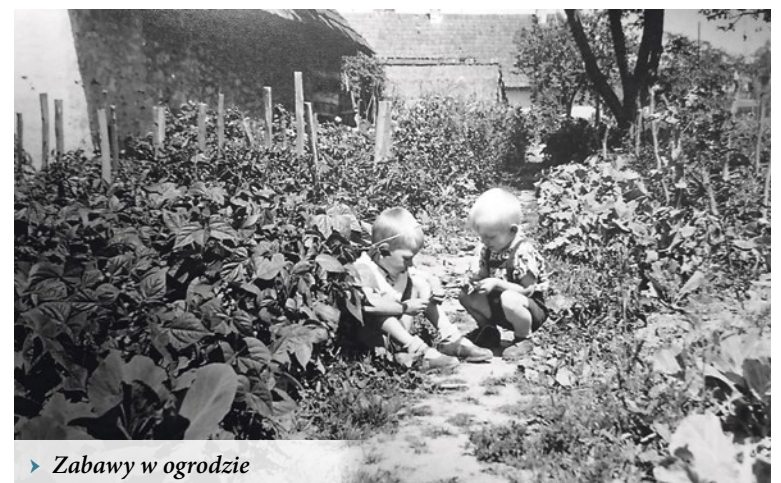
► Zabawy w ogrodzie