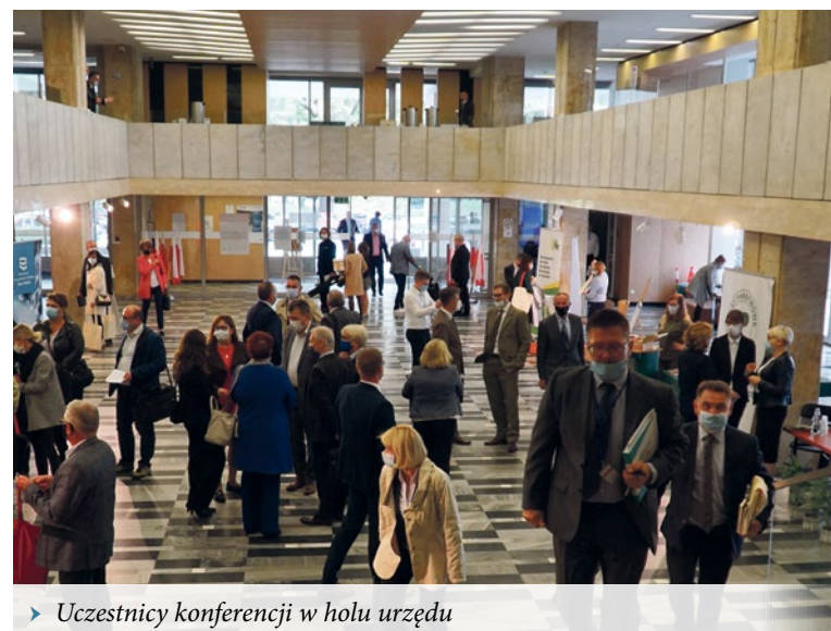
► Uczestnicy konferencji w holu urzędu

które pozytywnie i z entuzjazmem odpowiedziały na zaproszenie – mówił wojewoda wielkopolski Michał Zieliński.