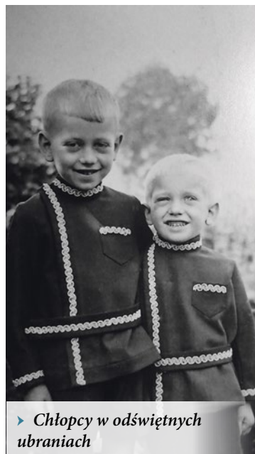
► Chłopcy w odświętanych ubraniach