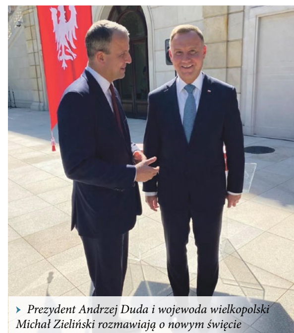
► Prezydent Andrzej Duda i wojewoda wielkopolski Michał Zieliński rozmawiają o nowym święcie