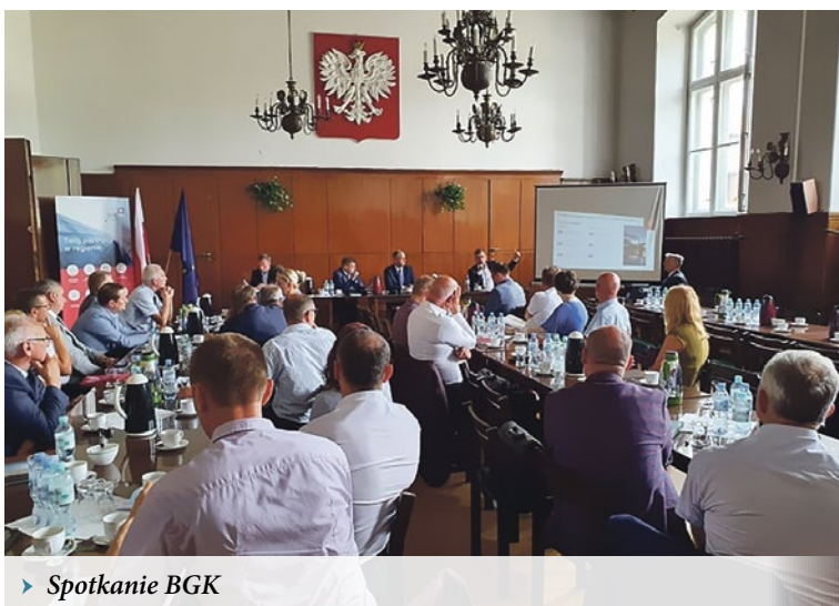
► Spotkanie BGK

Wielkopolskim, Lesznie, Pile, Koninie, Ostrzeszowie samorządowcy mogli wymienić poglądy na temat Programu. – Podczas wizyt w poszczególnych regionach naszego województwa udało się zaprezentować założenia funduszu samorządowcom z 35 powiatów oraz 226 gmin Wielkopolski. – Bardzo dziękuję wszystkim, którzy uczestniczyli w tych spotkaniach, podej-