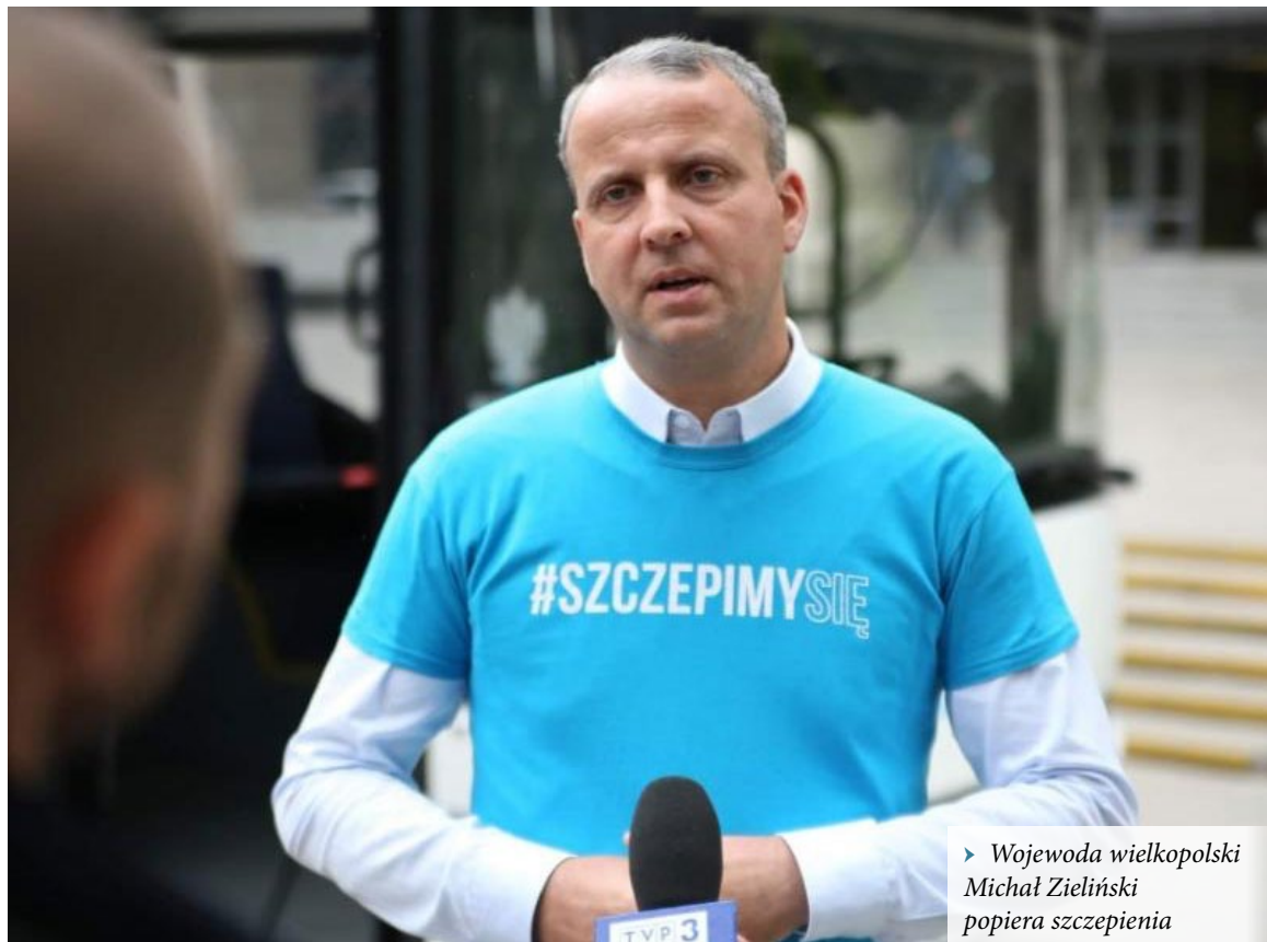
▶ Wojewoda wielkopolski Michał Zieliński popiera szczepienia