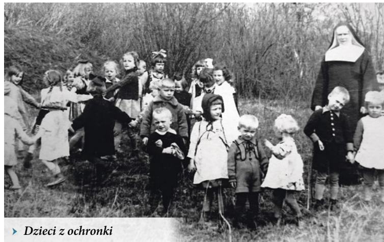
► Dzieci z ochronki