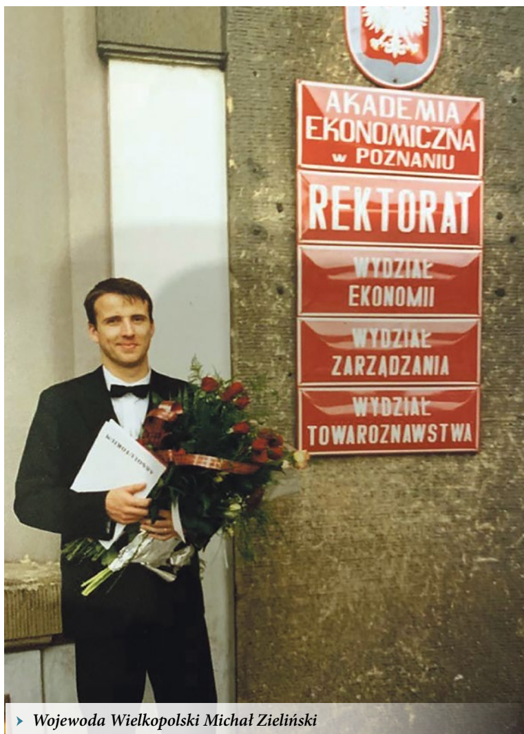
► Wojewoda Wielkopolski Michał Zieliński