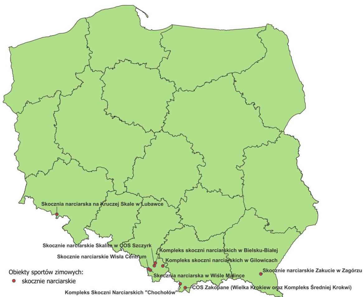
Mapa 4 – Skocznie narciarskie

Skoki narciarskie w Polsce mają długą tradycję i bogatą w sukcesy teraźniejszość. Brakuje jednak skoczni treningowych, zwłaszcza tych mniejszych, dla osób rozpoczynających