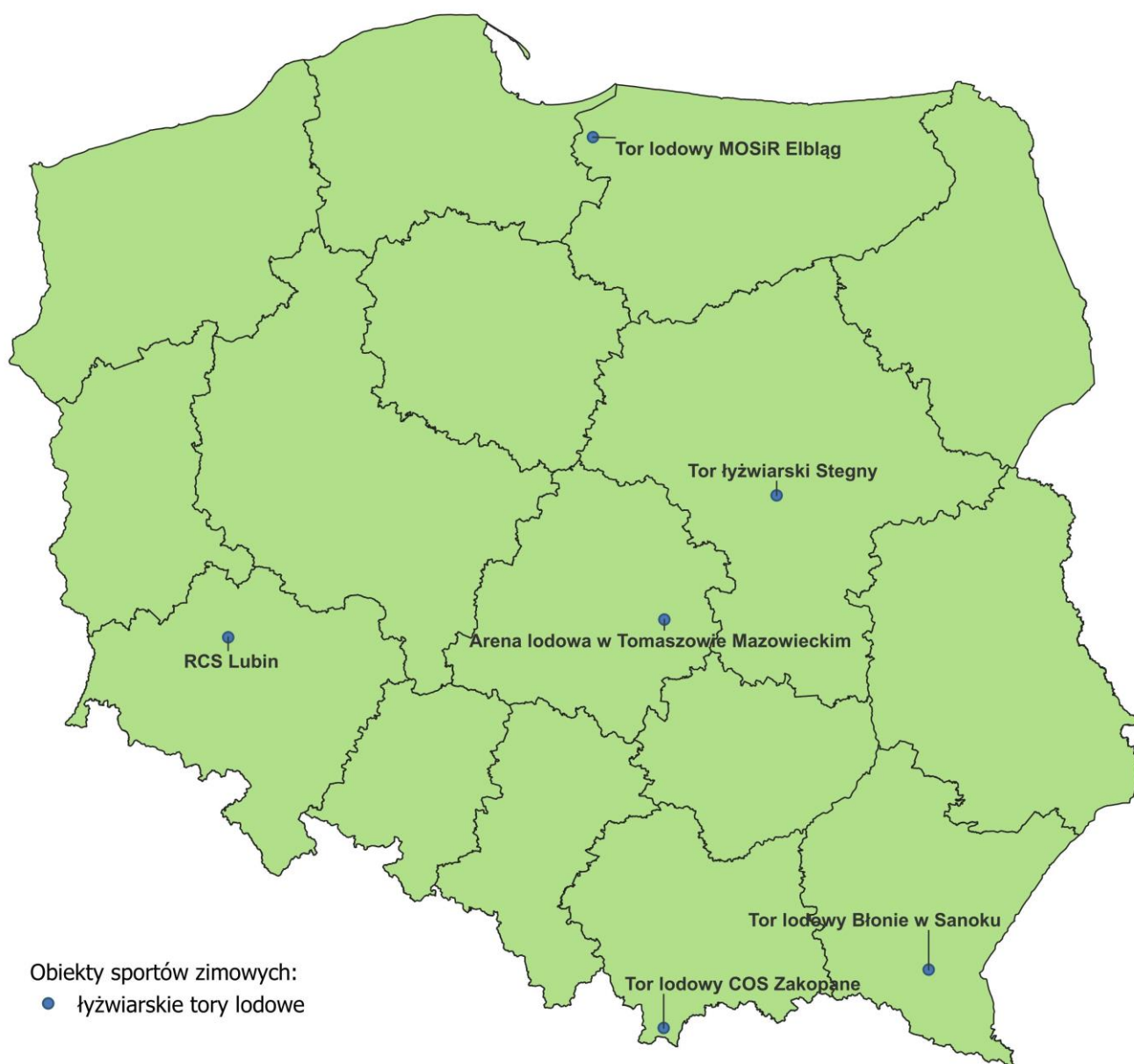
Mapa 3 – Tory łyżwiarskie