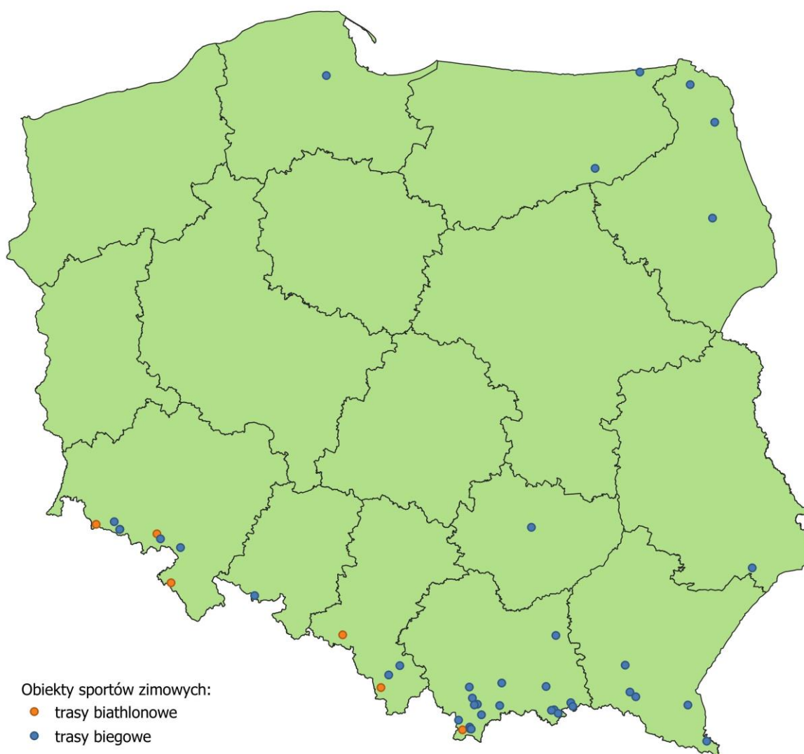
Mapa 5 – Trasy biathlonowo-biegowe

Łącznie trasy biathlonowe mają długość ok. 25 km.