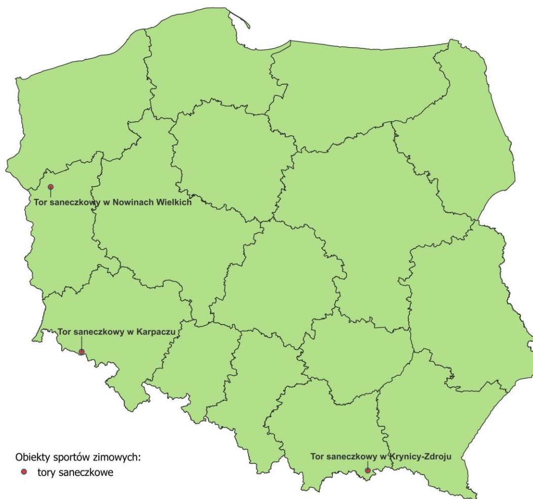
Mapa 8 – Tory saneczkowe

Aktualnie zidentyfikowano 3 tory saneczkowe w Polsce w Nowinach Wielkich, Karpaczu i Krynicy-Zdroju. Tory te są jednak w złym stanie technicznym i wymagają przebudowy/modernizacji.