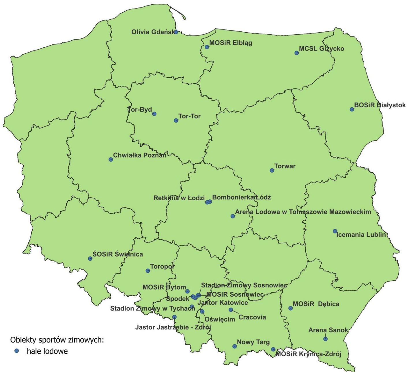
Mapa 2 – Hale lodowe

W Polsce funkcjonuje 26 hal lodowych, ponadto nowa hala jest budowana w ramach budowy Stadionu Zimowego w Sosnowcu.