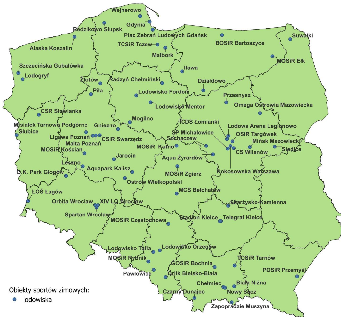
Mapa 3 – Kryte lodowiska treningowe i rekreacyjne

Warto w tym miejscu wskazać, że rozwój technologii w zakresie lekkiego budownictwa (lekkie przekrycia PVC, hale pneumatyczne, membrany, konstrukcje płytowe) w ostatnich latach przyspieszył procesy rozwoju infrastruktury lodowej (lodowisk krytych).