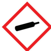
gaz pod ciśnieniem