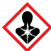
poważne zagrożenie dla zdrowia