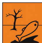
niebezpieczny dla środowiska