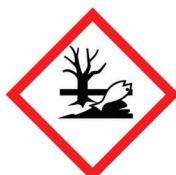
stwarzający zagrożenie dla środowiska