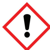
szkodliwy drażniący uczulający