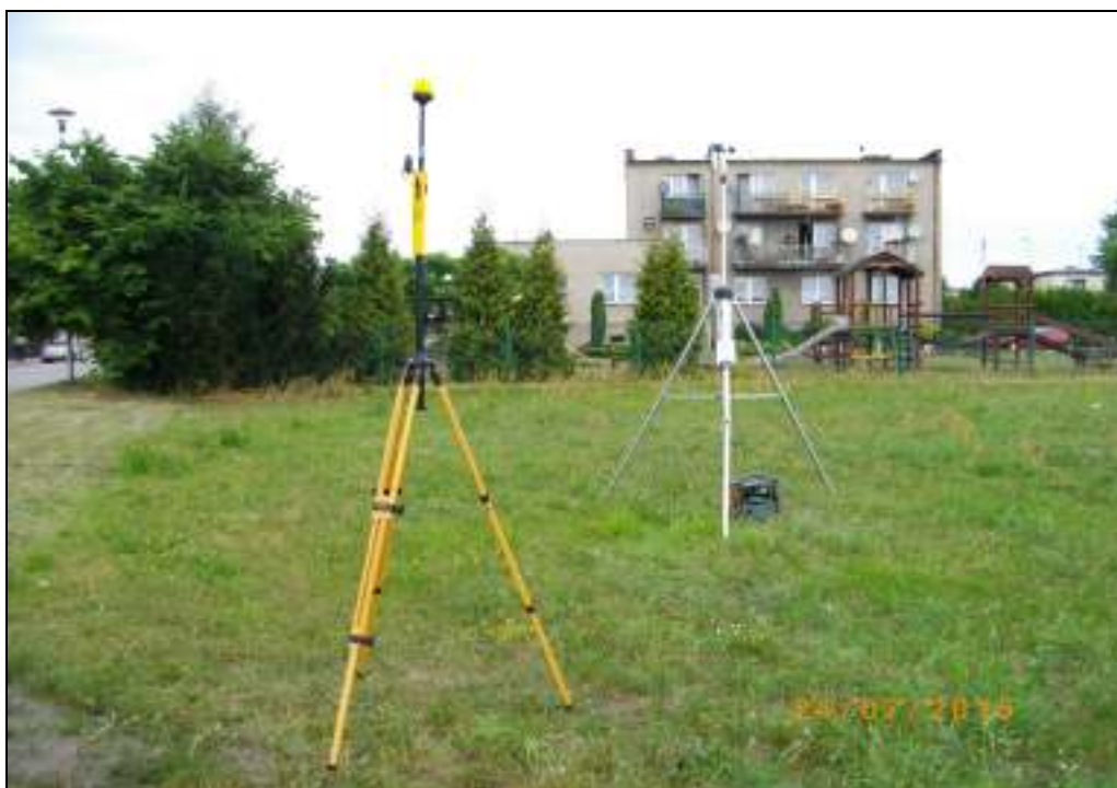
Fot. 1. Rejon badań, widok w kierunku północnym