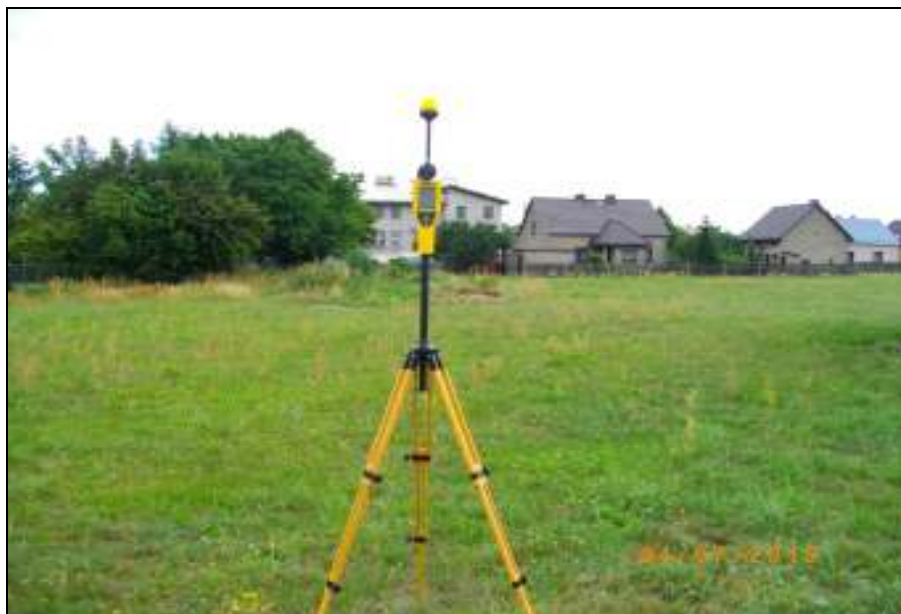
Fot. 3. Rejon badań, widok w kierunku wschodnim