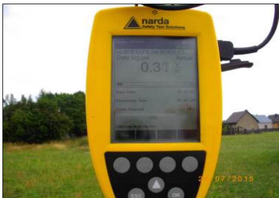
Fot. 4. Przyrząd pomiarowy w trakcie prowadzonego badania