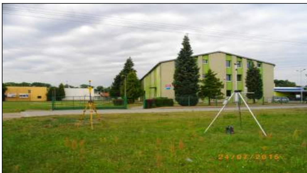
Fot. 2. Rejon badań, widok w kierunku zachodnim