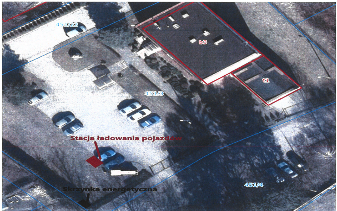
Rys.2 Planowana lokalizacja stacji ładowania pojazdów Rejon Koszalin