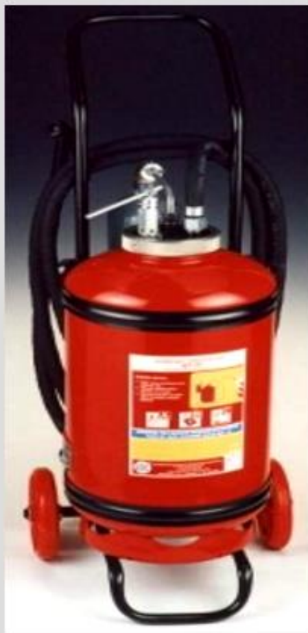
AP - 25Z ABC