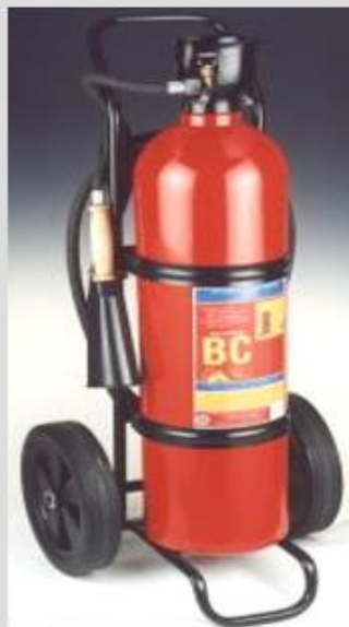
AS - 30 X BC