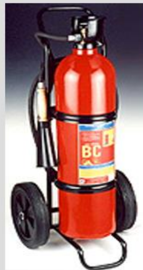
AS- 20 X BC