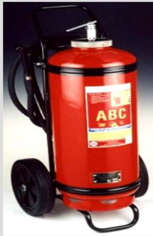
AP - 50Z ABC